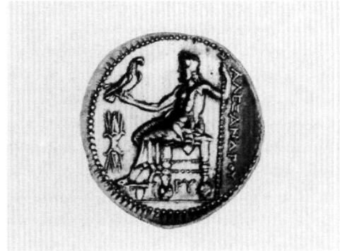
Εικ. 8. Τετράδραχμον Πτολεμαίου Α'. Νομισματικό Μουσείο Αθηνών.

scirio χρονολογείται κατά τον Hahn 23 τον Δεκέμβριο του 583 και κατά τον Grierson σε μία από τις δύο υπατείες 24 , ενώ τα νομίσματα 25 χρονολογούνται το 601/602. Ο Φωκάς αναδείχθηκε ύπατος στις 25 Δεκεμβρίου του 603 και τα νομίσματα 26 με την απεικόνιση του scirio χρονολογούνται τον Δεκέμβριο του 603/604.