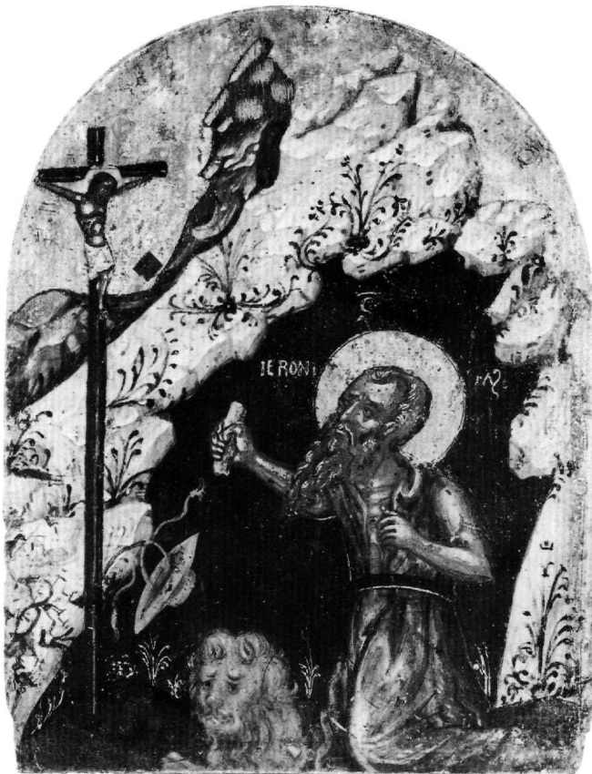
Εικ. 7. Βυζαντινό και Χριστιανικό Μουσείο (T 2232). Φύλλο τριπτύχου. Ο άγιος Ιερώνυμος μπροστά από τον Εσταυρωμένο. Αρχές του 16ου αιώνα.

Η συναπεικόνιση των δύο μεγάλων ασκητών, του Προδρόμου και του Ιερωνύμου, είναι γνωστή όχι μόνο στην ιταλική ζωγραφική 48 , όπως στα δύο έργα του Zorpo, στο πολύπτυχο της Bologna (Εικ. 5) και στον πίνακα στα Staatliche Museen του Βερολίνου (1471) 49 , καθώς και στον πίνακα του Francesco Bianchi Ferrari στο ίδιο Μου-