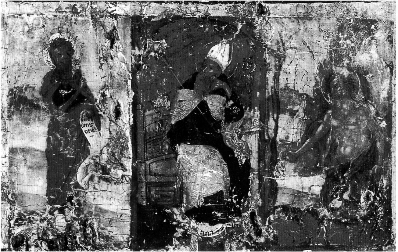
Εικ. 8. Μουσείο Κανελλοπούλου. Οι άγιοι Ιωάννης ο Πρόδρομος, Αυγουστίνος και Ιερώνυμος. Λεπτομέρεια εικόνας με την Παναγία του Πάθους, σκηές και αγίους. Γύρω στο 1500.

ίσια μακριά μύτη και το μικρό στόμα, καθώς και οι καστανοί βόστρυχοι που πέφτουν στους ώμους. Ομοιότητα επίσης εντοπίζουμε στις ρυτίδες που αυλακώνουν το μέτωπο, στην έντονη σύσπαση ανάμεσα στα φρύδια και στις ανατομικές λεπτομέρειες του σώματος.