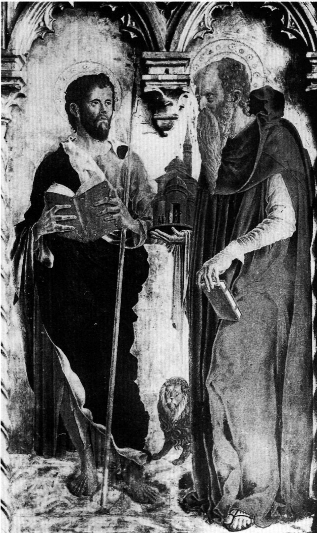
Εικ. 5. Bologna. Collegio di Spagna. Zorpo. Φύλλο πολυπτύχου με τους αγίους Ιωάννη τον Πρόδρομο και Ιερώνυμο.