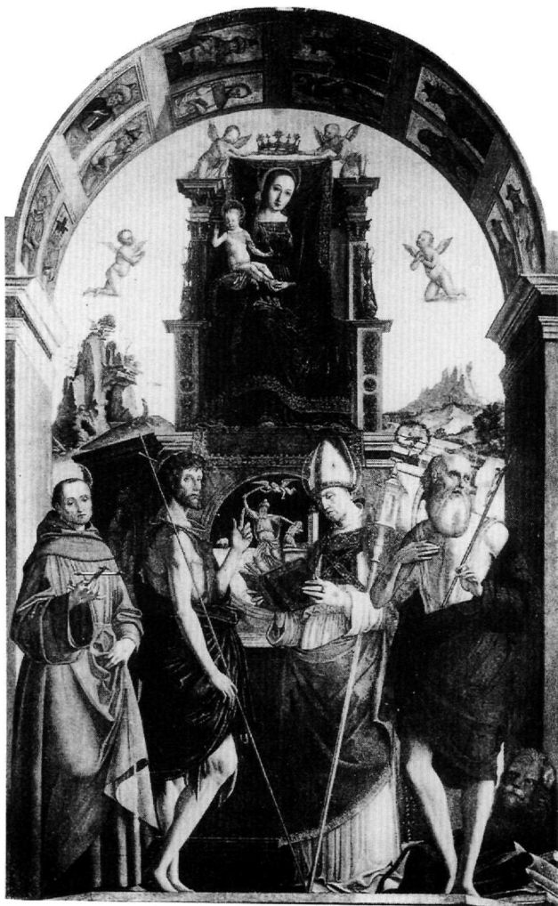
Εικ. 9. Βερολίνο, Staatliche Museen. Francesco Bianchi Ferrari. Η Παναγία βρεφονκρατούσα και οι άγιοι Φραγκίσκος, Ιωάννης ο Πρόδρομος, Αμβρόσιος και Ιερώνυμος. Δεύτερο μισό του 15ου αιώνα. (Φωτ. Berenson, Italian Pictures , II, πίν. 754).

Ο εικονογραφικός τύπος του αγίου Ιερωνύμου, με τα καλοσχεδιασμένα χαρακτηριστικά, την πλαστικότητα