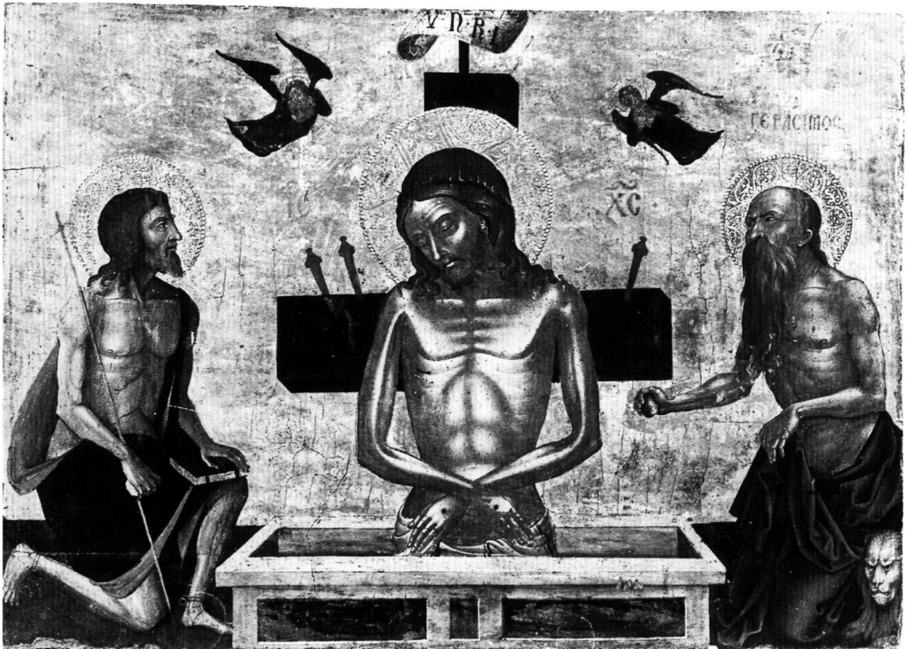
Εικ. 1. Βυζαντινό και Χριστιανικό Μουσείο. Η Άκρα Ταπείνωση και οι άγιοι Ιωάννης ο Πρόδρομος και Ιερόνυμος (Τ 227).

αγωνιμικές επιγραφές. Στον άγιο Ιωάννη τον Πρόδρομο η επιγραφή ανταποκρίνεται σωστά στην εικονιζόμενη μορφή (Εικ. 1). Τα εκφραστικά μέσα που χρησιμοποιεί ο ζωγράφος για την απόδοση του αγίου επηρεάζονται από την ιταλική ζωγραφική, όπως η στάση γονυκλισίας του Βαπτιστή μόνο με το ένα γόνατο, τύπος που κατάγεται από τη ζωγραφική της Δύσης και απαντάται επίσης σε ιταλοκρητικά έργα του 15ου-16ου αιώνα. Ορισμένες εικονογραφικές λεπτομέρειες ωστόσο