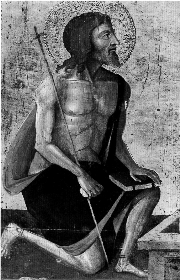
Εικ. 4. Βυζαντινό και Χριστιανικό Μουσείο. Η Άκρα Ταπείνωση και άγιοι (Τ 227). Ο άγιος Ιωάννης ο Πρόδρομος.

ρώνυμος, άγιος που καταγόταν από την Ανατολή αλλά έδρασε στη Δύση, παραλληλίζεται με τον έλληνα καρδινάλιο Βησσαρίωνα, ο οποίος διέγραψε ανάλογη πορεία και επέδειξε ιδιαίτερο ενδιαφέρον στη μελέτη και