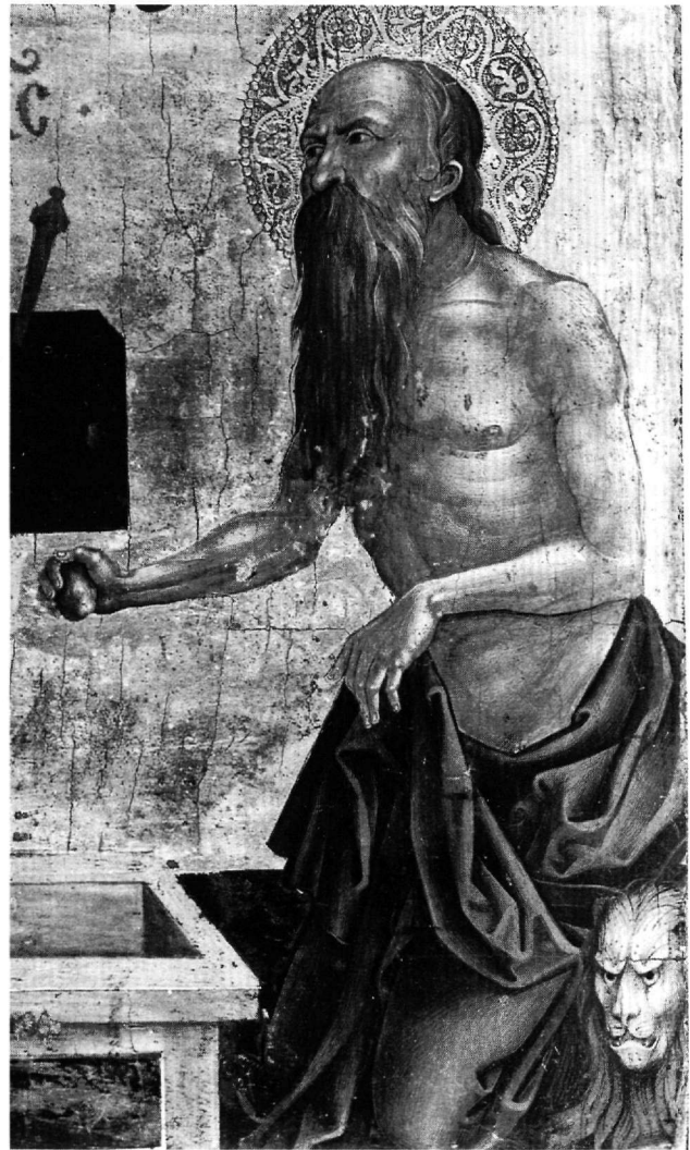
Εικ. 6. Βυζαντινό και Χριστιανικό Μουσείο. Η Ακρα Ταπείνωση και άγιοι (T 227). Ο άγιος Ιερώνυμος.

(1518) 46 και σε φύλλο τριπτύχου με αριθμό T 2232 στο Βυζαντινό και Χριστιανικό Μουσείο, που αποδίδεται στον κύκλο του 47 (αρχές του 16ου αι.) (Εικ. 7). Σύμφωνα με τα εικονογραφικά στοιχεία της παράστασης του αγίου Ιερωνύμου, που μετανιών τύπτει με λίθο το στήθος του, μπορούμε να ταυτίσουμε με ασφάλεια τη δεξιά