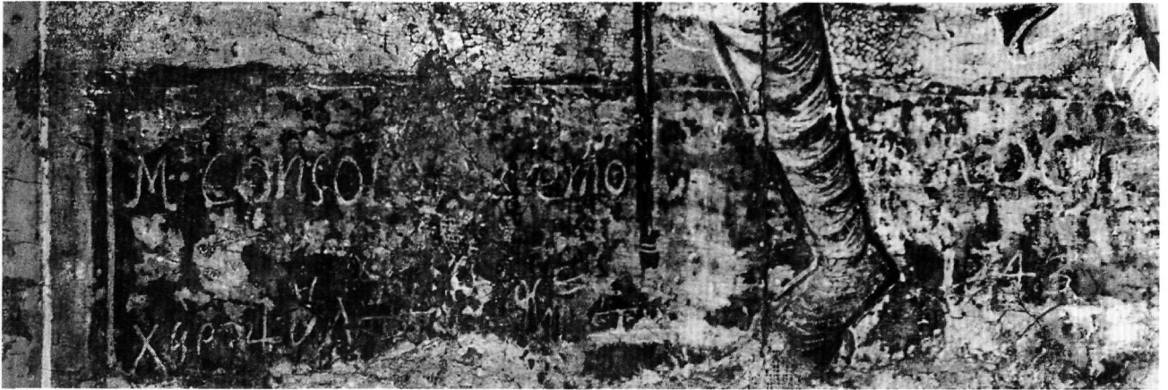
Εικ. 3. Λεπτομέρεια της Εικ. 1.

πλήττονταν κυρίως από την ασθένεια της πανώλης 8 . Το ίδιο διάστημα περίπου διαμορφώνεται και η εικονογραφία του αγίου, αν και η παλαιότερη γνωστή απεικόνισή του σώζεται ήδη από το τέλος του 14ου αιώνα σε ένα ξύλινο αγαλματίδιο στο Μουσείο της Grenoble 9 . Στις παλαιότερες απεικονίσεις ο άγιος παριστάνεται με τα ρούχα του προσκυνητή, να δείχνει την πληγή του, μόνος ή να συνοδεύεται από άλλους αγίους, ενώ αργότερα η εικονογραφία του εμπλουτίζεται με σκηνές από τη ζωή του 10 .