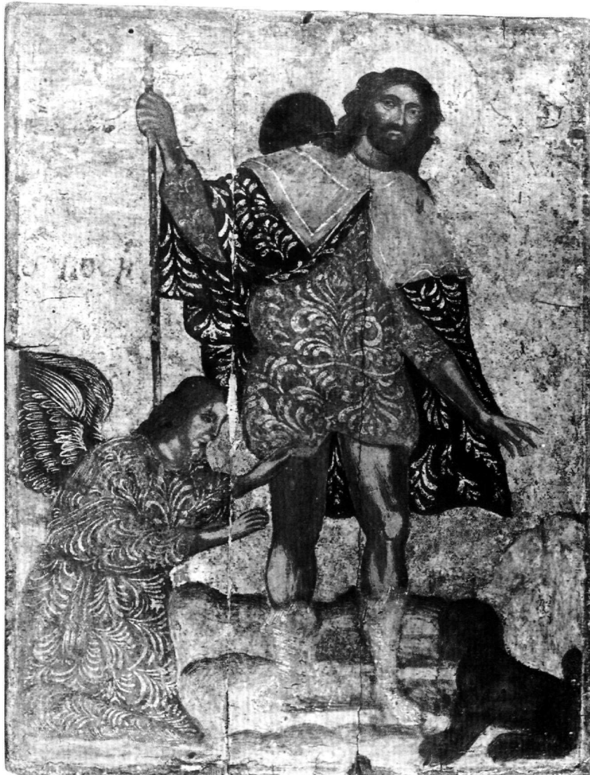
Εικ. 2. Αθήνα, Βυζαντινό και Χριστιανικό Μουσείο. Αμφιπρόσωπη εικόνα (Κ 692). Β' όψη: Ο άγιος Ρόκκος.

κοι είχαν προσβληθεί από πανώλη και αφοσιώθηκε στη θεραπεία και συμπαράσταση των ασθενών. Προσβληθείς και ο ίδιος αργότερα από την ασθένεια, κατέφυγε σε δάσος περιμένοντας το θάνατο και σώθηκε ως εκ θαύματος από θεόσταλτο άγγελο και σκύλο που τον έτρεφε καθημερινά με ψωμί. Κατά το ταξίδι επιστροφής στην πατρίδα του συνελήφθη για κατασκοπία στη Λομβαρδία και κλείστηκε στη φυλακή το 1374, όπου και παρέμεινε μέχρι το τέλος του βίου του το 1379.