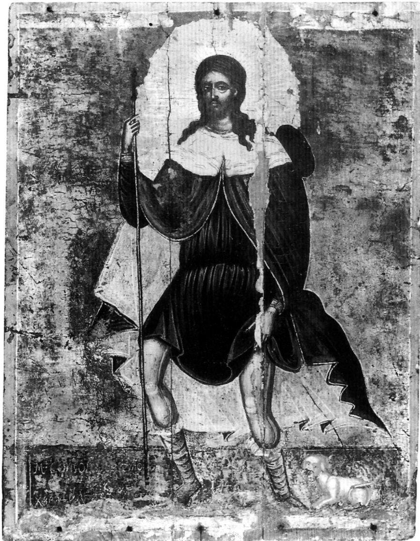
Εικ. 1. Αθήνα, Βυζαντινό και Χριστιανικό Μουσείο. Αμφιπρόσωπη εικόνα (Κ 692). Α΄ όψη: Ο άγιος Ρόκκος.

συγχρόνως από τον ίδιο καλλιτέχνη ή σε διαφορετική χρονική περίοδο από δύο ζωγράφους; Ποια άραγε είναι η παλαιότερη και ποια η μεταγενέστερη; Ο συνδυασμός του ίδιου θέματος απαντά συχνά σε αμφιπρόσωπες εικόνες στη μεταβυζαντινή τέχνη; Ποιο ήταν τέλος το δόγμα του παραγγελειοδότη της εικόνας; Προχωρώντας στη διερεύνηση των παραπάνω προβλημάτων, αξίζει πρώτα να σταθούμε στη λατρεία του αγίου και στην εικονογραφία του. Ο άγιος Ρόκκος, τιμώμενος άγιος της δυτικής Εκκλησίας ως προστάτης των πανωλόβλητων, έζησε το 14ο αιώνα 5 . σύμφωνα με μεταγενέστερες ιταλικές και γαλλικές βιογραφίες του,