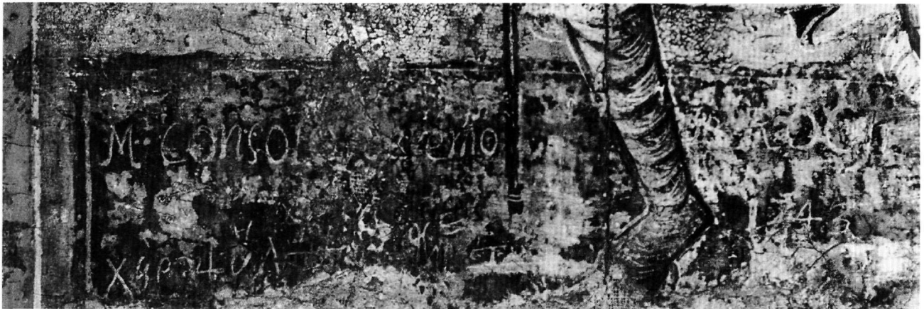
Εικ. 3. Λεπτομέρεια της Εικ. 1.

πλήττονταν κυρίως από την ασθένεια της πανώλης 8 . Το ίδιο διάστημα περίπου διαμορφώνεται και η εικονογραφία του αγίου, αν και η παλαιότερη γνωστή απεικόνισή του σώζεται ήδη από το τέλος του 14ου αιώνα σε ένα ξύλινο αγαλματίδιο στο Μουσείο της Grenoble 9 . Στις παλαιότερες απεικονίσεις ο άγιος παριστάνεται με τα ρούχα του προσκυνητή, να δείχνει την πληγή του, μόνος ή να συνοδεύεται από άλλους αγίους, ενώ αργότερα η εικονογραφία του εμπλουτίζεται με σκηνές από τη ζωή του 10 .