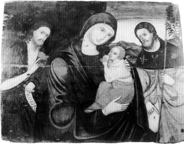
Εικ. 4. Αθήνα, Βυζαντινό και Χριστιανικό Μουσείο. Εικόνα της Παναγίας Madre della Consolazione με τους αγίους Ιωάννη τον Πρόδρομο και Ρόκκο.