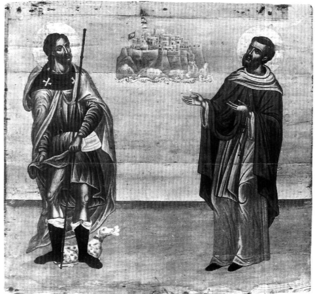
Εικ. 5. Χώρα Κυθήρων, ναός Μυρτιδιώτισσας Κάστρου. Εικόνα των αγίων Ρόκκου και Θεοδώρου.

(Εικ. 6). Η εύρωστη και επιβλητική μορφή του αγίου με την καστανή μακριά κόμη και τα πλούσια διακοσμημένα ενδύματα, που τονίζουν την ευγενική του προέλευση, πρέπει να έχουν εκτελεστεί στα μέσα περίπου του 17ου αιώνα σε καλλιτεχνικό περιβάλλον με άμεση πρόσβαση σε έργα της δυτικής τέχνης. Ενδεικτικά αναφέρω τη μορφή του αγίου Ρόκκου στον πίνακα του ιταλού ζωγράφου Girolamo dai Libri, που χρονολογείται γύρω στο 1505 και βρίσκεται στην εκκλησία του Αγίου Θωμά στη Βερόνα 28 . Η παρουσία του αγγέλου επίσης παραπέμπει σε έργα της ιταλικής ζωγραφικής. Καθώς απουσιάζει από όλες τις γνωστές απεικονίσεις του αγίου στις μεταβυζαντινές εικόνες, πρέπει να προέρχεται από εκτεταμένο κύκλο του βίου του αγίου σε δυτικά έργα 29 .