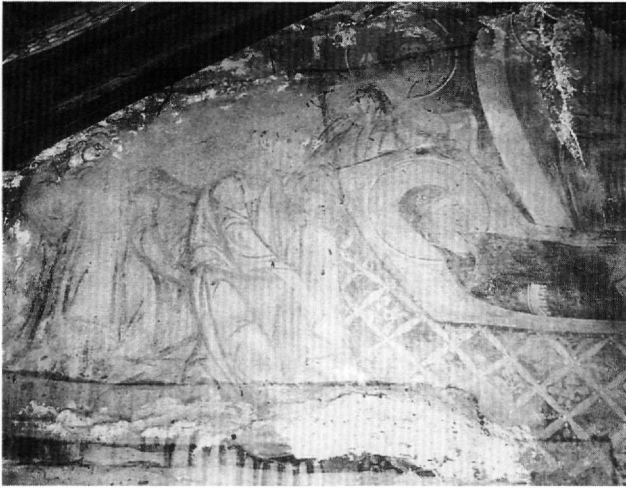
Εικ. 3. Άγιος Αθανάσιος. Η Κοίμηση της Θεοτόκου (λεπτομέρεια).

ντρο της σκηνης, πίσω από την κλίνη, απεικονίζεται ο Χριστός, όρθιος, με στραμμένο ελαφρώς προς τα αριστερά το κεφάλι, κρατώντας στα χέρια την ψυχή της Παναγίας. Περιβάλλεται από ελλειψοειδή δόξα και πλαισιώνεται εκατέρωθεν από δύο σεβίζοντες αγγέλους.