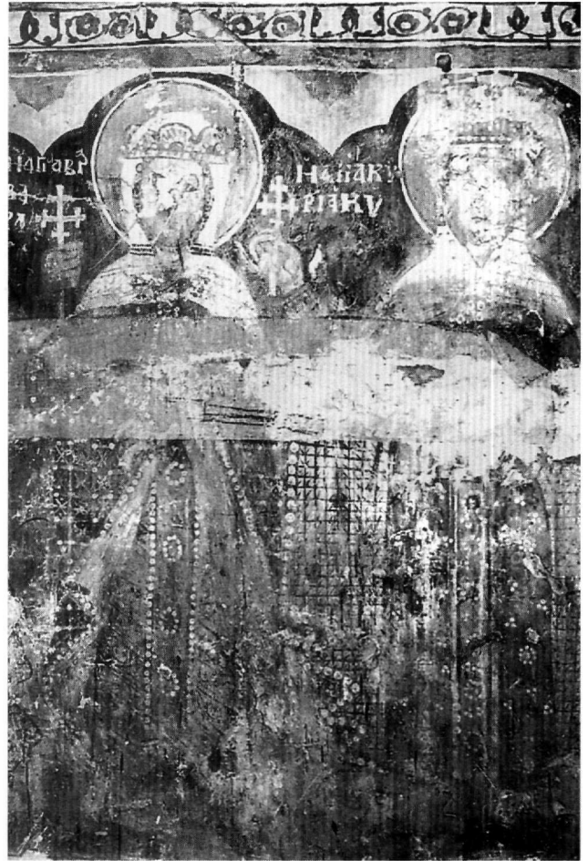
Εικ. 5. Άγιος Αθανάσιος. Οι αγίες Βαρβάρα και Κυριακή.

Εκτός από τους στρατιωτικούς αγίους, ιδιαίτερα χαρακτηριστική στις τοιχογραφίες του Κουστοχωριού είναι και η βασιλική εμφάνιση των αθλοφόρων αγίων Κυριακής και Βαρβάρας (Εικ. 5). Και οι δύο φορούν βαρύτιμα ενδύματα από πολύχρωμα υφάσματα και φέρουν στο κεφάλι κοσμημένες καλύπτρες και περιτέχνα στέμματα. Ανάμεσα στα μοτίβα των υφασμάτων απαντούν θέματα ιδιαίτερα προσφιλή στους ζωγράφους του εργαστηρίου της Καστοριάς, όπως οι ρόμβοι ή τα τετράγωνα, μέσα στα οποία εγγράφονται άνθη. Χαρακτηριστικό παράδειγμα αποτελούν τα τετράγωνα μοτίβα με τις διαγώνιες γραμμές που κοσμούν εσωτερικά το μανδύα της αγίας Κυριακής, τα οποία απαντούν και στην καλύπτρα της Παναγίας Παράκλησης στον Άγιο Νικόλαο της μοναχής Ευπραξίας 22 . Στο πλαίσιο αυτής της διακοσμητικής διάθεσης, που εκφράζεται μέσα από