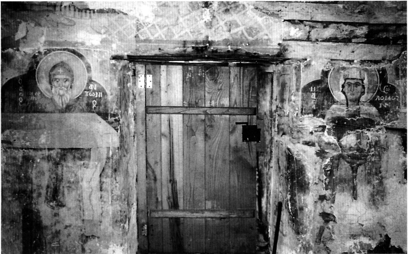
Εικ. 2. Άγιος Αθανάσιος, Δυτικός τοίχος. Ο άγιος Αντώνιος ο Νέος και η αγία Σολομωνή.

η αγία Σολομωνή 5 (Εικ. 2), ενώ ψηλά, στην αετωματική επιφάνεια, αναπτύσσεται η παράσταση της Κοίμησης της Θεοτόκου (Εικ. 3). Σε πρώτο πλάνο απεικονίζεται η Παναγία στη νεκρική κλίνη, πλαισιωμένη εκατέρωθεν από δύο ομίλους. Από δεξιά κινούνται προς αυτή άγγε-