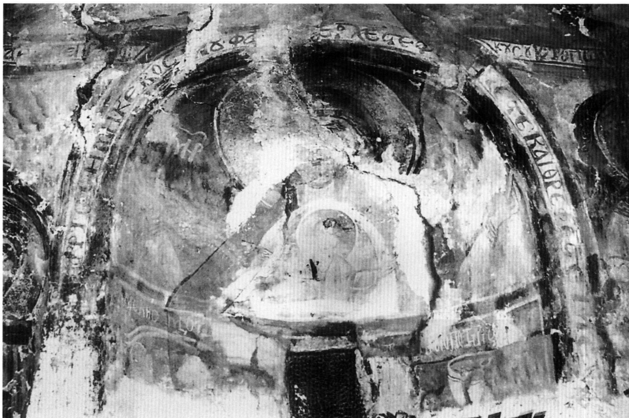
Εικ. 1. Άγιος Αθανάσιος. Κόγχη ιερού Βήματος. Η Πλατυτέρα, ο Μελισμός.

ταυτιστεί με τον προφήτη Ηλία σε στάση δέησης, ενώ από τον Μωυσή, που απεικονίζεται αριστερά, διατηρείται μόνο το κάτω τμήμα του. Αξιοσημείωτη στην απόδοση του θέματος είναι η απουσία των αποστόλων από τη σκηνή, γεγονός που μπορεί να συσχετιστεί με καθαρά πρακτικούς λόγους, δεδομένου ότι η επιφάνεια, στην οποία αναπτύσσεται η παράσταση, είναι περιορισμένων διαστάσεων.