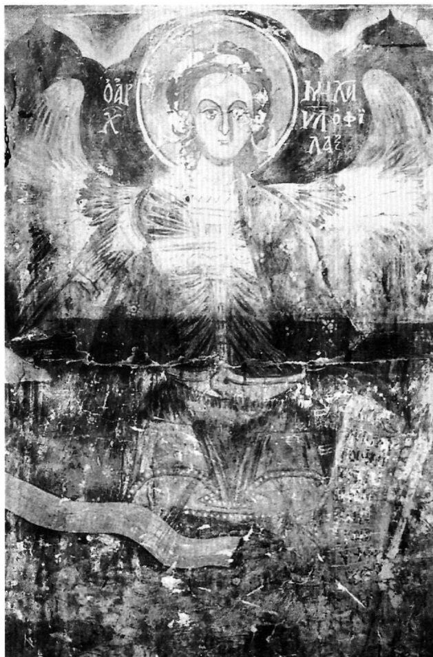
Εικ. 6. Άγιος Αθανάσιος. Ο αρχάγγελος Μιχαήλ.

Τα πρόσωπα των μορφών αποδίδονται με μεγάλες, ενιαίες, αχνά φωτισμένες επιφάνειες, που ορίζονται με έντονα περιγράμματα. Στην εντύπωση της επιπεδότητας που δημιουργείται συντελούν κατά πολύ η απουσία φωτοσκιάσεων, η κυριαρχία της γραμμής και η λιτότητα των χρωματικών μέσων στην απόδοση των σαρκωμάτων. Η ίδια τεχνική, με την οποία διαμορφώνονται οι φυσιογνωμικοί τύποι στο ναϊσκο του Κουστοχωρίου,