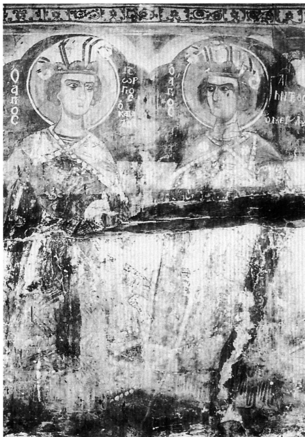
Εικ. 4. Άγιος Αθανάσιος. Οι άγιοι Γεώργιος και Δημήτριος.

Η απόδοση των παραπάνω στρατιωτικών αγίων με την επίσημη αυλική ενδυμασία και τα χαρακτηριστικά καπέλα, η οποία σε μια πρώιμη μορφή εμφανίζεται ήδη από τον 14ο αιώνα στις τοιχογραφίες του Zaum κοντά