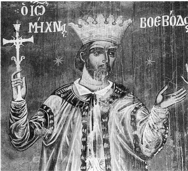
Εικ. 2. Ο βοεβόδας Ιωάννης ο Μίχνας Β'. Λεπτομέρεια από την παράσταση των κτητόρων.