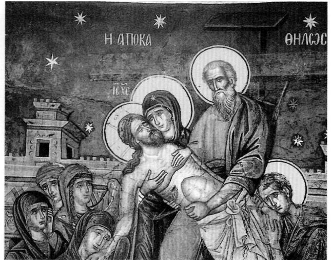
Εικ. 5. Καθολικό μονής Ιβήρων. Η Αποκαθήλωση (λεπτομέρεια).

(έγχρ. εικ.). Ο κτήτωρ της μονής Βαριλαάμ Θεοφάνης, που πέθανε το 1544, απεικονίζεται τέσσερα χρόνια μετά στις τοιχογραφίες του καθολικού (1548) με φωτοστέφανο. Βλ. Νικ. Νικονάνος, Μετέωρα , Αθήνα 1987, σ. 96, εικ. 40. Επίσης ο μητροπολίτης Σερρών Γεννάδιος εικονίζεται με φωτοστέφανο στις εξωτερικές τοιχογραφίες της Τράπεζας της Λαύρας και σε φορητή εικόνα που σωζόταν στην Παλαιά Μητρόπολη Σερρών. Βλ. σχετικά Α. Ευγγύπουλος, Σχεδιάσμα ιστορίας της θρησκευτικής ζωγραφικής μετά την Άλωση , Αθήνα 1957, πίν. 26.1-2. Millet - Pargoire - Petit, Inscriptions (υποσημ. 1), σ. 131, αριθ. 397. 12. Βλ. Kalorissi-Verti, ό.π. (υποσημ. 6), σ. 141. Ο Γκράτσιου, Μεταμορφώσεις μιας θανατοουργής εικόνας. Σημειώσεις στις όψεις παραλλαγές της Παναγίας του Κύκκου , ΔΧΑΕΙΖ' (1993-1994), σ. 326.