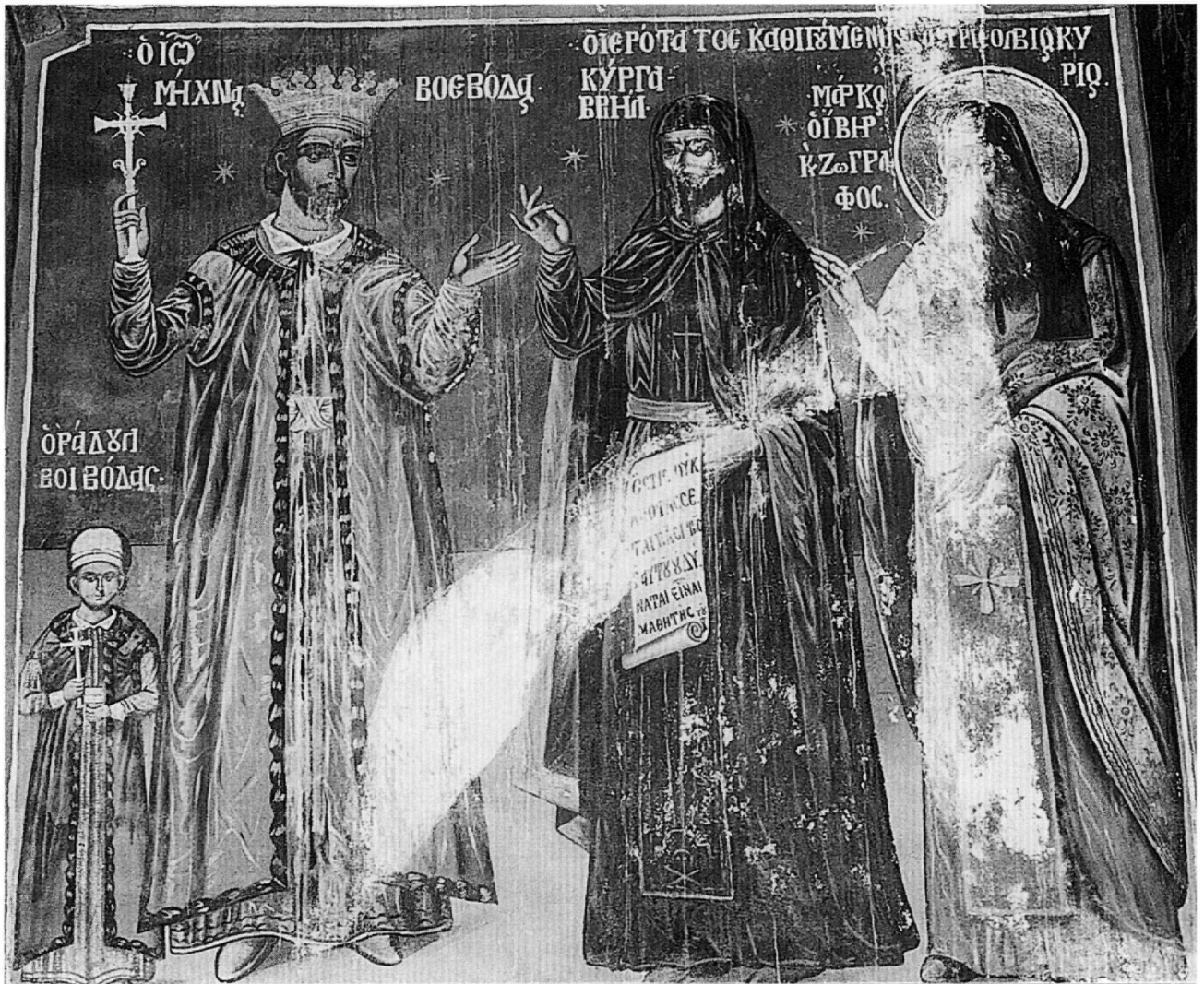
Εικ. 1. Καθολικό μονής Ιβήρων. Οι κήτορες.

τάτου Πανσέληνος. Σχέδιο του πορτραίτου αυτού, με βάση τη μη σωζόμενη σήμερα τοιχογραφία, δημοσίευσε το 1913 ο Georgienskij 7 . Επίσης ο ακαδημαϊκός Ανδρέας Ευγγόπουλος 8 εξέφρασε την άποψη ότι ο ανώνυμος καλλιτέχνης των τοιχογραφιών του Αγίου Νικολάου του Ορφανού Θεσσαλονίκης (1315-1320) επέλεξε, προκειμένου να απεικονίσει τον εαυτό του, τη μορφή του