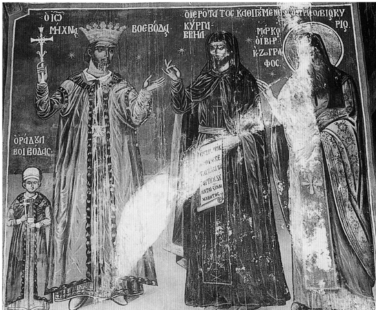
Εικ. 1. Καθολικό μονής Ιβήρων. Οι κήτορες.

τάτου Πανσέληνος. Σχέδιο του πορτραίτου αυτού, με βάση τη μη σωζόμενη σήμερα τοιχογραφία, δημοσίευσε το 1913 ο Georgievskij 7 . Επίσης ο ακαδημαϊκός Ανδρέας Ευγγόπουλος 8 εξέφρασε την άποψη ότι ο ανώνυμος καλλιτέχνης των τοιχογραφιών του Αγίου Νικολάου του Ορφανού Θεσσαλονίκης (1315-1320) επέλεξε, προκειμένου να απεικονίσει τον εαυτό του, τη μορφή του