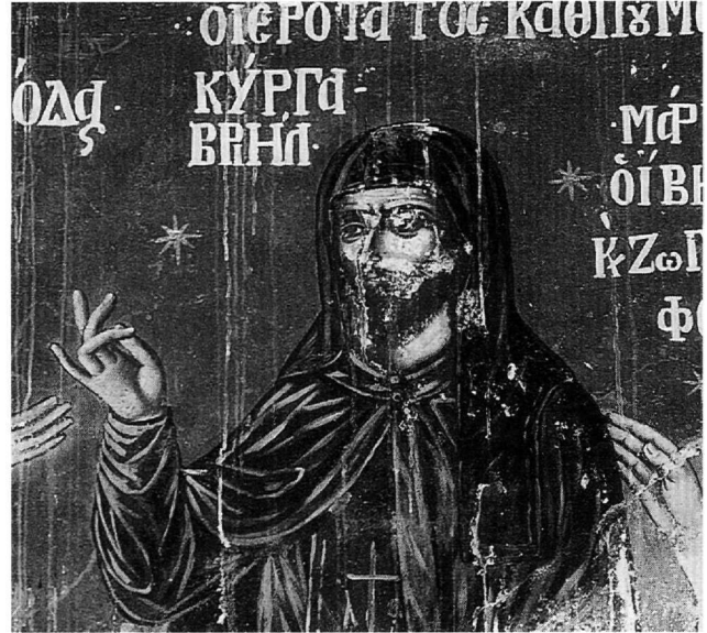
Εικ. 3. Ο καθηγούμενος της μονής Ιβήρων κυρ Γαβρούηλ. Λεπτομέρεια από την παράσταση των κτητόρων.

ακριβώς από τον Χριστό, απεικονίζεται πιθανότατα ο Πανσέληνος, ο καλλιτέχνης των τοιχογραφιών.