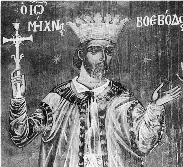
Εικ. 2. Ο βοεβόδας Ιωάννης ο Μίχνας Β'. Λεπτομέρεια από την παράσταση των κτητόρων.