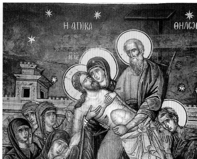
Εικ. 5. Καθολικό μονής Ιβήρων. Η Αποκαθήλωση (λεπτομέρεια).

(έγχρ. εικ.). Ο κτήτωρ της μονής Βαριλαάμ Θεοφάνης, που πέθανε το 1544, απεικονίζεται τέσσερα χρόνια μετά στις τοιχογραφίες του καθολικού (1548) με φωτοστέφανο. Βλ. Νικ. Νικονάνος, Μετέωρα , Αθήνα 1987, σ. 96, εικ. 40. Επίσης ο μητροπολίτης Σερρών Γεννάδιος εικονίζεται με φωτοστέφανο στις εξωτερικές τοιχογραφίες της Τράπεζας της Λαύρας και σε φορητή εικόνα που σωζόταν στην Παλαιά Μητρόπολη Σερρών. Βλ. σχετικά Α. Ευγγούπουλος, Σχεδιάσμα ιστορίας της θρησκευτικής ζωγραφικής μετά την Άλωση , Αθήνα 1957, πίν. 26.1-2. Millet - Pargoire - Petit, Inscriptions (υποσημ. 1), σ. 131, αριθ. 397. 12. Βλ. Kalorissi-Verti, ό.π. (υποσημ. 6), σ. 141. Ο Γκράτσιου, Μεταμορφώσεις μιας θανατοουργής εικόνας. Σημειώσεις στις όψεις παραλλαγές της Παναγίας του Κύκκου , ΔΧΑΕΙΖ' (1993-1994), σ. 326.