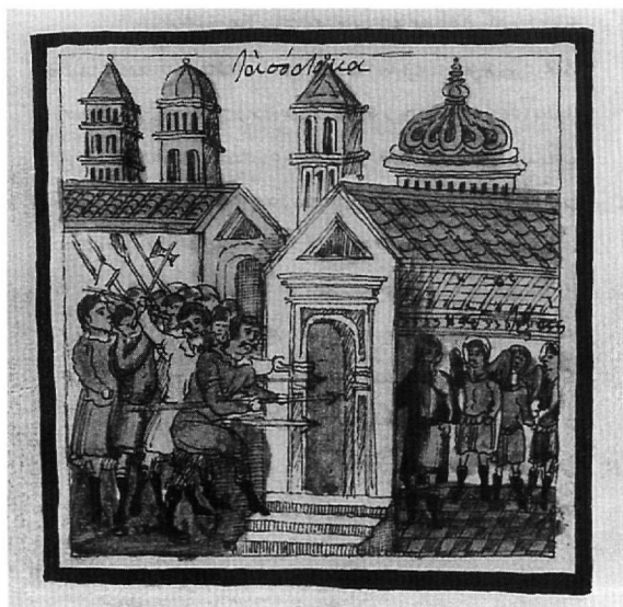
Εικ. 5. Κώδ. Σινά 1187. Οι Σοδομίτες μπροστά στην οικία του Λωτ.