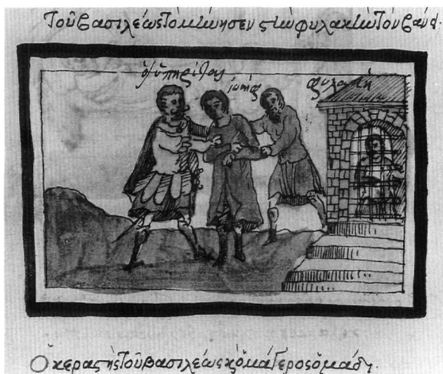
Εικ. 9. Κώδ. Σινά 1187. Η σύλληψη και η φυλάκιση του Ιωσήφ.