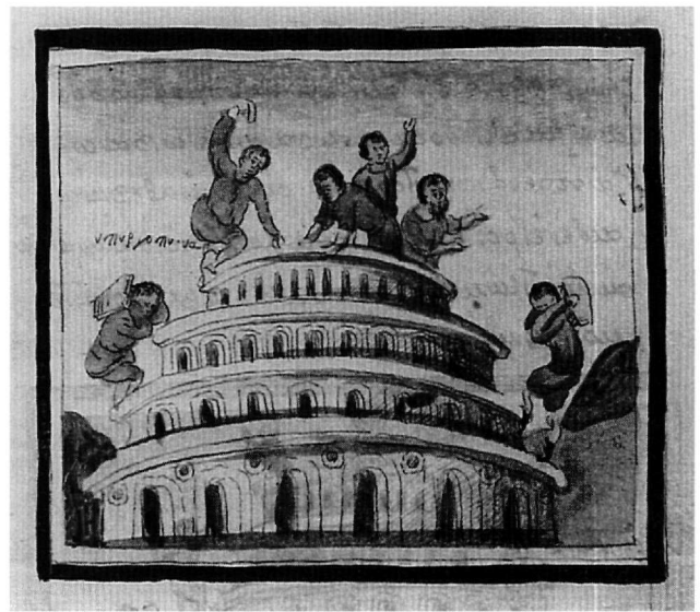
Εικ. 4. Κώδ. Σινά 1187. Η ανοικοδόμηση του πύργου της Βαβέλ.

Σε άλλες συνθέσεις ο μικρογράφος θα στραφεί σε εικονογραφικά σχήματα που είχαν ήδη υιοθετηθεί από άλλους και τα οποία κυκλοφορούσαν σε χαλκογραφίες και ξυλογραφίες που διακοσμούσαν τυπωμένα βιβλία, αλλά και σε ζωγραφικούς πίνακες. Είναι πιθανό ο άγνωστος μοναχός να είχε έλθει σε επαφή με τα έργα αυτά στην Κρήτη. Ο D. Holton παρατήρησε ότι μία ξυλογραφία με σκηνή γεύματος σε έντυπη έκδοση της Ιλιάδος, στη μετάφραση του Ν. Λουκάνη, που κυκλοφόρησε το 1526 στην Κρήτη, χρησιμοποιήθηκε ως πρό-