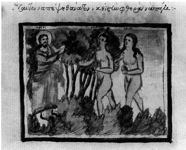
Εικ. 1. Κώδ. Σινά 1187. Ο Θεός προειδοποιεί τους Πρωτοπλάστους.

απεικονίσεις του ουρανού και της γης, του στερεώματος και των υδάτων. Ακολουθούν τα επεισόδια της πτώσης του ανθρώπου.