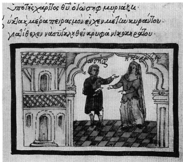
Εικ. 6. Κώδ. Σινά 1187. Η γυναίκα του Ποτιφάρ πλησιάζει τον Ιωσήφ.

μανική, είναι εμφανής σε πολλές μικρογραφίες, όπως στο φ. 75β, όπου απεικονίζονται Σοδομίτες μπροστά από τη θύρα της οικίας του Λωτ (Γέν. 19) (Εικ. 5). Οι Σοδομίτες, στα αριστερά, καλούν απειλητικά τον Λωτ, ο οποίος στη φάση αυτή βρίσκεται μέσα στην οικία μαζί με τους τρεις αγγέλους, σκηνή που απεικονίζεται στο δεξιό μέρος της σύνθεσης. Η μικρογραφία, όπως σε όλες τις περιπτώσεις, συνοδεύει τον αντίστοιχο στίχο του στιχουργήματος (στ. 1093 κ.ε.). Η θύρα της οικίας τοποθετείται εμφανώς στο κέντρο της σύνθεσης, διότι ο ρόλος της στην αφήγηση είναι σημαντικός. Ως προς τη μορφή της η θύρα είναι καθαρά αναγεννησιακή, ενώ πίσω από τα οικοδομήματα του βάθους υψώνονται ρωμανικά κωδωνοστάσια και ένας τρούλος, του οποίου η απόληξη υποδεικνύει αναγεννησιακή αρχιτεκτονική 27 . Αρχιτεκτονική της όψιμης Αναγέννησης παρουσιάζεται επίσης συχνά, όπως στο φ. 117α, όπου εικονίζεται η γυναίκα του Ποτιφάρ να πλησιάζει τον Ιωσήφ (Εικ. 6). Άλλα έντονα βενετσιάνικα και γενικότερα αναγεννησιακά στοιχεία είναι οι απεικονίσεις κρηνών και ο τρόπος δομής των τοξωτών πυλών που συνδέεται με αρχιτεκτονήματα του πρώτου μισού του 16ου αιώνα.