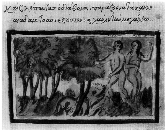
Εικ. 2. Κώδ. Σινά 1187. Ο Πειρασμός.

Αν περιορισθεί κανείς στα κύρια εικονογραφικά στοιχεία χωρίς θεώρηση του ύφους –αυτό θα επιχειρηθεί λίγο πιο κάτω– θα πρέπει να παραδεχθεί ομοιότητες με σκηνές σε εικονογραφημένα πολύ πιο πρώιμα βιβλία της Παλαιάς Διαθήκης, όπως π.χ. η Γένεσις του Cotton 11 . Ωστόσο, πρέπει να σημειωθεί ότι η αφήγηση του κειμένου δεν παρέχει δυνατότητες ποικιλίας στην εικονο-