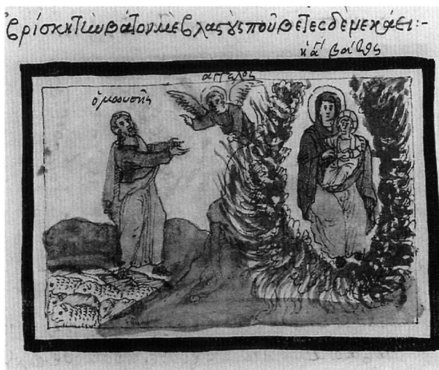
Εικ. 10. Κώδ. Σινά 1187. Ο Μωυσής και η Φλεγόμενη Βάτος.

Λονδίνο, δεν μας οδηγούν στην αναζήτηση κάποιου μακρινού προγόνου. Δεν γνωρίζουμε πότε κυκλοφόρησε το έργο του Χούμνου εικονογραφημένο και εάν ο δημιουργός αυτής της πρώτης έκδοσης έλαβε υπόψη του κάποια εικονογραφημένα βιβλία. Αλλά και αν δεχθούμε την ύπαρξη κάποιου σήμερα «χαμένου προτύπου», ο δημιουργός του σιναϊτικού χειρογράφου έχει απομακρυνθεί τόσο από την παράδοση αυτού του προ-