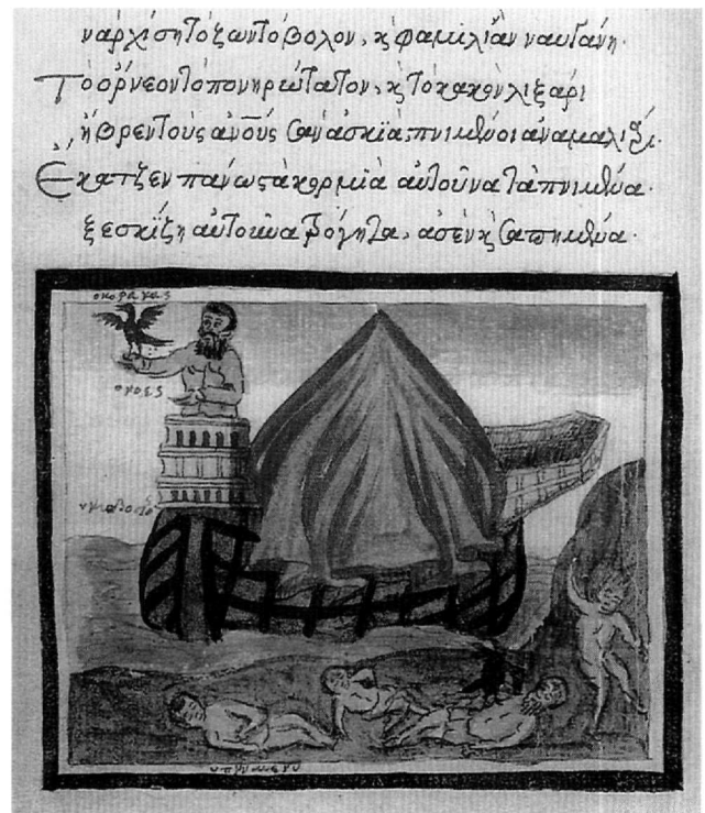
Εικ. 3. Κώδ. Σινά 1187. Ο Νώε αποστέλλει το κοράκι από την κιβωτό.

Η απόδοση όμως του «όφως» δεν συνδέεται ούτε με τό κείμενο του Χούμνου, που σύμφωνα με τη Γένεση ορίζει τη μεταμόρφωση του διαβόλου σε φίδι, ούτε με την καθιερωμένη παράδοση στη βυζαντινή τέχνη που επίσης μένει πιστή στο βιβλικό κείμενο. Εξαιρεση παρουσιάζουν οι μεσοβυζαντινές οκτάτευχοι. Σε τρεις κώδικες στους οποίους έχει διατηρηθεί η παράσταση καλύτερα, τα χειρόγραφα στο Τορκαρί της Κωνσταντινούπολης, του Βατικανού 746 και στο χαμένο χειρόγραφο της Σμύρνης, στη σκηνή του Πειρασμού ο όφης παρουσιάζεται ως καμήλα με το φίδι όμως να σέρνεται στη ράχη της. Οι μελετητές των χειρογράφων αυτών χαρακτηρίζουν την εικονιστική αυτή σύλληψη «an eccentric version of the cycle» που δεν πηγάζει από την Παλαιά Διαθήκη αλλά από εβραϊκές παραδόσεις 13 . Θα ήταν υπερβολή και πάλι να αναγνωρίσουμε στη μικρογραφία τον απόηχο μιας συγκεκριμένης παράδοσης, εφόσον ακριβής εικονιστική σύνδεση δεν υπάρχει μεταξύ των μεσοβυζαντινών μικρογραφιών και της εικόνας του Χούμνου, αλλά και διότι γενικότερα η απόδοση του διαβόλου ως δράκοντος στη βυζαντινή και τη μεταβυζαντινή τέχνη λαμβάνει διάφορες μορφές. Ιδιαίτερα στο βιβλίο του Ιώβ και σε αποκαλυπτικές σκηνές αποτελεί τερατώδεις συνδυασμούς, πολλοί με ανθρωπόμορφα στοιχεία, οι οποίοι έχουν ονομασθεί «μειξογενείς» 14 . Οι πολυάριθμες απει-