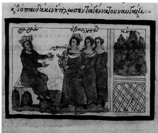
Εικ. 7. Κώδ. Σινά 1187. Η βασιλοπούλα παρουσιάζει το βρέφος Μωυσή στον φαραώ.

βλίο, και πολλές άλλες. Στην απεικόνιση της σύλληψης του Ιωσήφ αξιοσημείωτο είναι το «σύγχρονο» ιδίωμα, εμφανές στην απόδοση της φυλακής με τα σίδερα, αλλά και στην παρουσίαση του οπλισμένου δεσμοφύλακα, η εξουσία του οποίου υπογραμμίζεται ακόμη και με το στριφτό μουστάκι του. Η μορφή αυτή προαγγέλλει τους «ήρωες» του Θεόφιλου (Εικ. 9). Ο βοηθός του, που φοράει κρητική βράκα, μεταφέρει την πανάρχαιη ιστορία στον σύγχρονο κόσμο και εκφράζει μια ελκυστική αμεσότητα. Ο τύπος αυτός επαναλαμβάνεται στην απεικόνιση του κλειδούχου-δεσμοφύλακα στην επόμενη σκηνή της φυλάκισης του Ιωσήφ (φ. 119α).