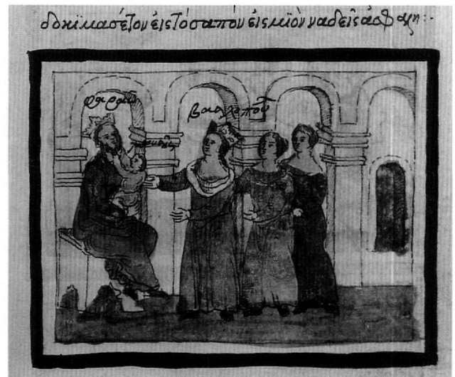
Εικ. 8. Κώδ. Σινά 1187. Το βρέφος επιχειρεί να βγάλει τα γένια του φαραώ.

βλίο, και πολλές άλλες. Στην απεικόνιση της σύλληψης του Ιωσήφ αξιοσημείωτο είναι το «σύγχρονο» ιδίωμα, εμφανές στην απόδοση της φυλακής με τα σίδερα, αλλά και στην παρουσίαση του οπλισμένου δεσμοφύλακα, η εξουσία του οποίου υπογραμμίζεται ακόμη και με το στριφτό μουστάκι του. Η μορφή αυτή προαγγέλλει τους «ήρωες» του Θεόφιλου (Εικ. 9). Ο βοηθός του, που φοράει κρητική βράκα, μεταφέρει την πανάρχαιη ιστορία στον σύγχρονο κόσμο και εκφράζει μια ελκυστική αμεσότητα. Ο τύπος αυτός επαναλαμβάνεται στην απεικόνιση του κλειδούχου-δεσμοφύλακα στην επόμενη σκηνή της φυλάκισης του Ιωσήφ (φ. 119α).