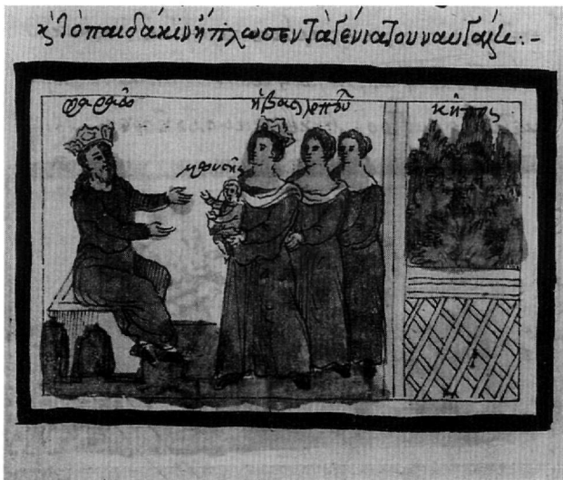
Εικ. 7. Κώδ. Σινά 1187. Η βασιλοπούλα παρουσιάζει το βρέφος Μωυσή στον φαραώ.