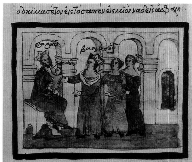
Εικ. 8. Κώδ. Σινά 1187. Το βρέφος επιχειρεί να βγάλει τα γένια του φαραώ.

Άλλες μικρογραφίες επαναλαμβάνουν θέματα με ευρεία διάδοση στη βυζαντινή και τη μεταβυζαντινή τέχνη, πέρα από τον συγκεκριμένο χώρο μιας εικονογρα-