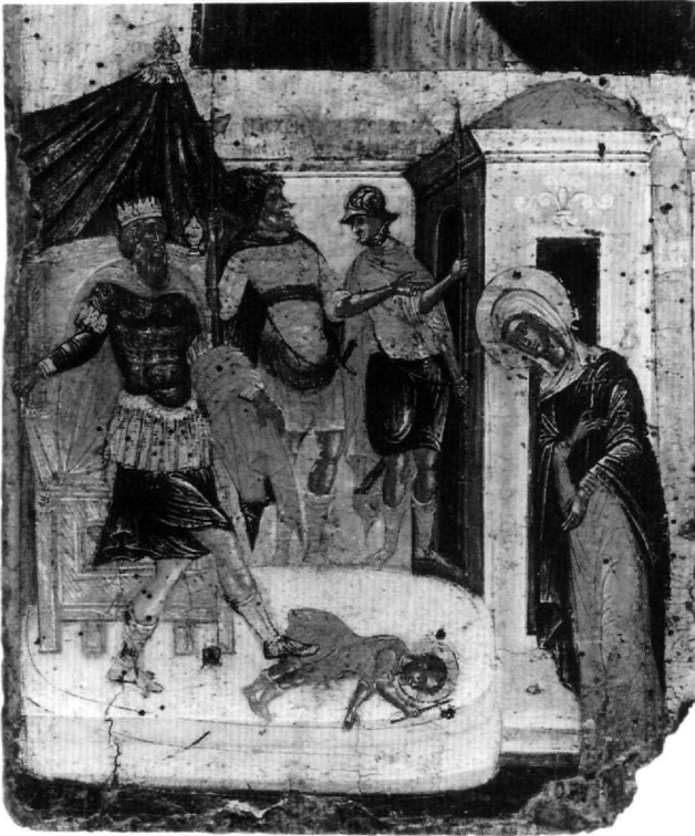
Εικ. 2. Βυζαντινό Μουσείο Αθηνών. Εικόνα αγίων Ιουλίττας και Κηρύκου. Το μαρτύριο του αγίου Κηρύκου.