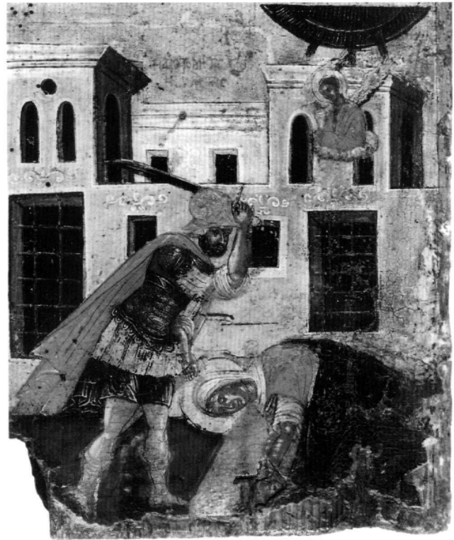
Εικ. 3. Βυζαντινό Μουσείο Αθηνών. Εικόνα αγίων Ιουλίττας και Κηρύκου. Το μαρτύριο της αγίας Ιουλίττας.

αι.) 27 και στην Dečani 28 . Αυτός ο τρόπος απόδοσης επιβιώνει και στη μεταβυζαντινή ζωγραφική, όπως στο παλαιό καθολικό του Μεγάλου Μετέωρου 29 και αργότερα στο νέο καθολικό (1552) 30 , στον Άγιο Νικήτα στο Čučer (1483/1484) 31 , στον Άγιο Δημήτριο στα Παλατίτσια και στη μονή Ζέρμας 32 , στον Άγιο Νικόλαο στη Βίτσα και στον Άγιο Μηνά στο Μονοδένδρι 33 .