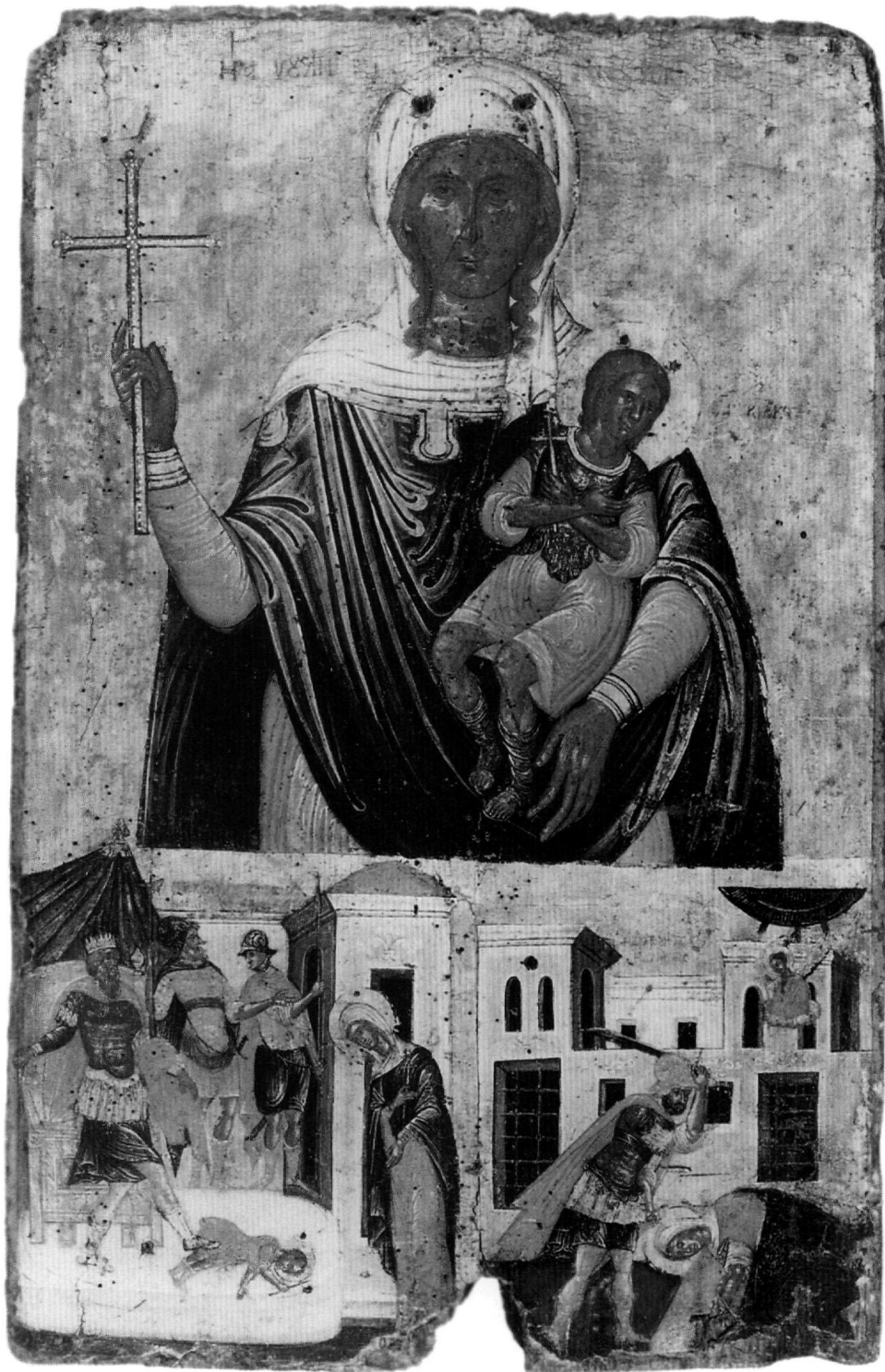
Εικ. 1. Βυζαντινό Μουσείο Αθηνών. Εικόνα των αγίων Ιουλίττας και Κηρύκου με σκηνές του μαρτυρίου τους.