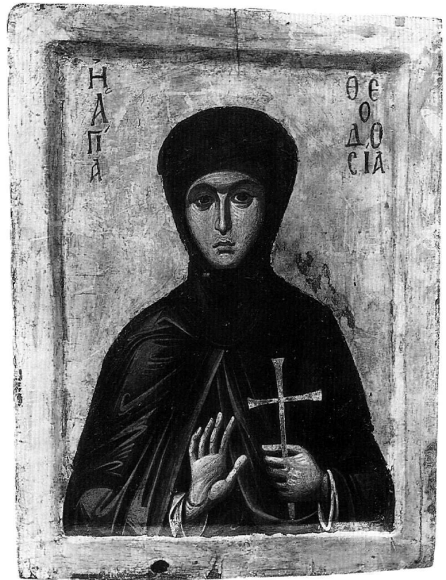
Εικ. 2. Εικόνα της αγίας Θεοδοσίας. 13ος αιώνας. Μονή Σινά.

Ενδιαφέρον για τη χρονολογική ένταξη της εικόνας παρουσιάζουν τα τεχνοτροπικά χαρακτηριστικά της παράστασης, που παραπέμπουν, περίεργα, τόσο σε παλαιολόγια έργα όσο και στα πρώιμα κρητικά. Παρά την κάποια τυποποίηση της μορφής, που μένει ακίνητη και μετωπική και συνδέεται, από αυτή τη θεώρηση, με τα μεταβυζαντινά έργα της πρώιμης κρητικής ζωγραφικής, άλλα στοιχεία της φέρνουν το έργο κοντά στα πρώιμα παλαιολόγια. Στα τελευταία εντάσσεται η έντονη ματιά της αγίας, που διαπερνά το θεατή και βλέπει πέρα από αυτόν, τα αδρά χαρακτηριστικά της και η ένταξη της