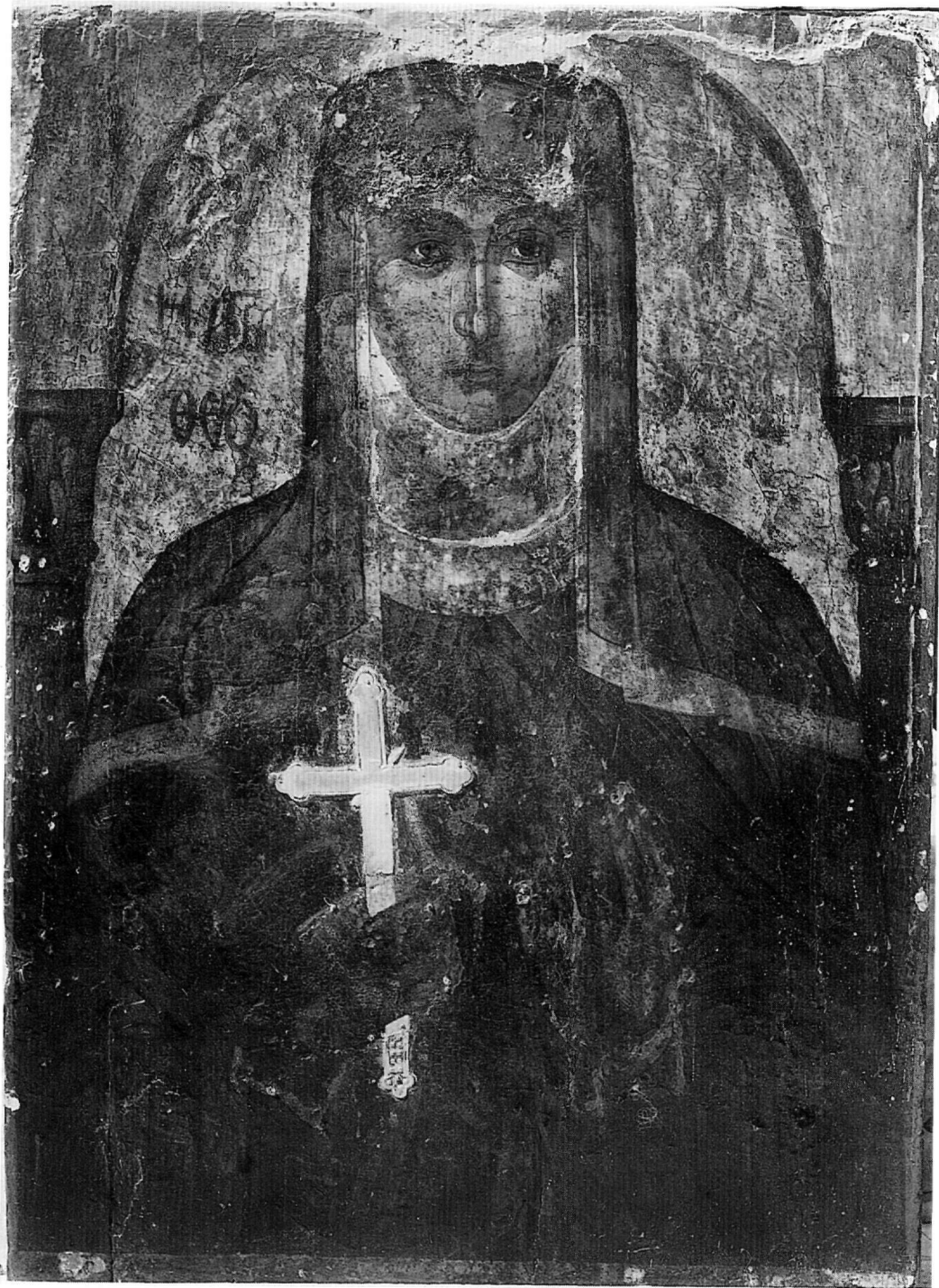
Εικ. 1. Εικόνα της αγίας Θεοδοσίας. Αρχές 15ου αιώνα. Χώρα Νάξου.