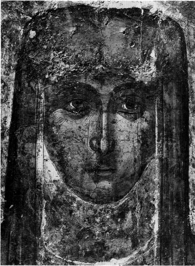
Εικ. 3. Εικόνα της αγίας Θεοδοσίας. Λεπτομέρεια της Εικ. 1.

με εργαστήριο της Τραπεζούντας 4 και χρονολογήθηκε στις αρχές του 14ου αιώνα. Στην ίδια εικόνα διακρίνονται και οι φωτεινές δέσμες από ψιμυθίες στις άκρες των όγκων, που επιβιώνουν και στην εικόνα της Νάξου. Πρέπει να σημειωθεί εδώ ότι το ζωγραφικό αυτό μέσον χρησιμοποιείται και από τα κωνσταντινουπολίτικα εργαστήρια του τέλους του 14ου αιώνα, από τα οποία περνάει και στην πρώιμη κρητική ζωγραφική. Αβρές και με