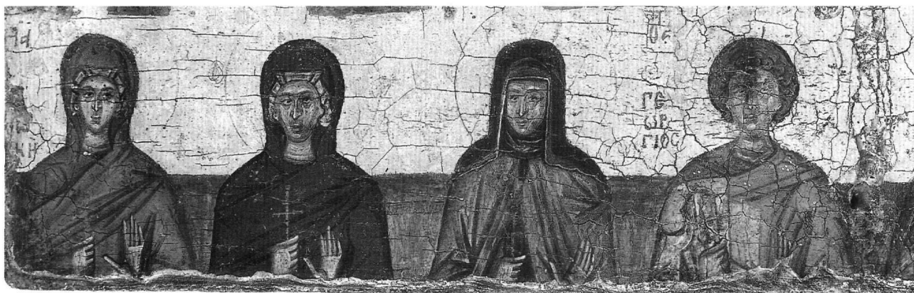
Εικ. 6. Η αγία Θεοδοσία και άλλοι άγιοι. Λεπτομέρεια από την εικόνα της Παναγίας Θεοσκεπάστης Τ 139. 15ος αιώνας. Βυζαντινό Μουσείο.

λες κοινές των δύο εικόνων, ιδιαίτερες εικονογραφικές λεπτομέρειες, που δεν φαίνεται να είναι ακόμη γνωστές στα αρχαιότερα δείγματα απεικόνισης της αγίας.