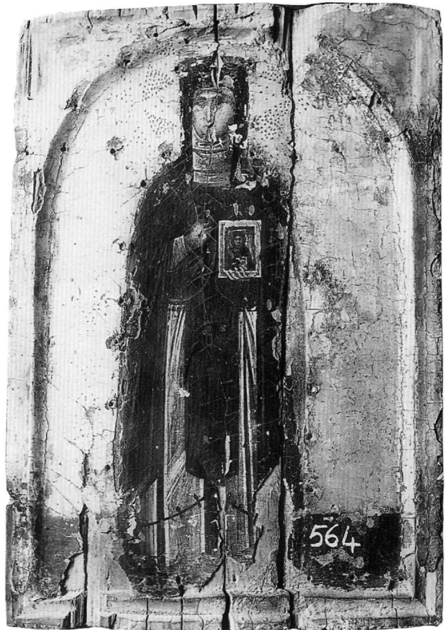
Εικ. 7. Εικόνα της αγίας Θεοδοσίας. Τέλη 14ου αιώνα. Μονή Σινά.

Στο Βίο της αγίας από ανώνυμο στο χειρόγραφο 109 της μονής Κουτλουμουσίου 32 , που χρονολογείται στο