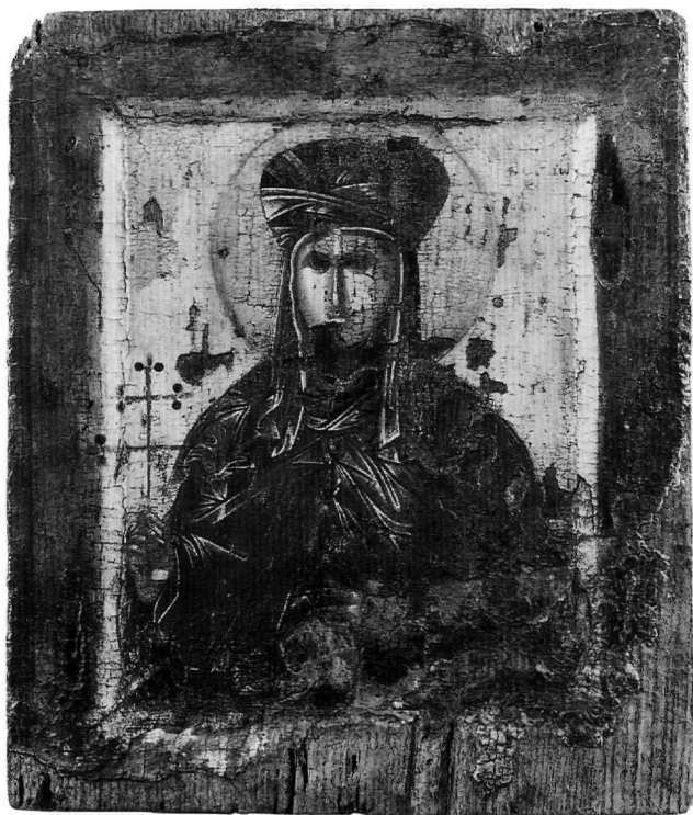
Εικ. 5. Εικόνα της αγίας Θεοδοσίας T 179, άλλοτε στο Βυζαντινό Μουσείο και σήμερα στο Μουσείο Βυζαντινού Πολιτισμού. Μέσα 14ου αιώνα.

Μακεδονίας συνηγορεί και η προέλευσή της από τη Θεσσαλονίκη. Τέλος, η ιδιαίτερη σχέση της παράστασης με τις τοιχογραφίες της Dečani χρονολογεί την εικόνα στα μέσα του 14ου αιώνα.