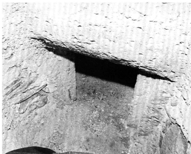
Εἰκ. 1. Μέγαρα. Ναός τῶν Ἁγίων Ἐξι Μαρτύρων. Ἡ εἴσοδος τοῦ κιβωτιόσχημου τάφου ἐντός τοῦ ναοῦ.

Ὁ ἕνας ναός-μαρτύριο βρισκόταν πιθανότατα στή θέση ὅπου σήμερα ὑψώνεται ὁ νεότερος τρουλαῖος ναός τῶν Ἁγίων Ἐξι Μαρτύρων καί θά περιέκλειε τόν τάφο πού βρίσκεται μέσα στό σημερινό ναό, παρά τή βορειοδυτική γωνία, καί εἶναι προσιτός μέ στενή κλίμακα. Ἔχει μῆκος 1,10, πλάτος 0,65 καί ὕψος ἐπάνω ἀπό τήν ἐπίχωση 1 μ. (Εἰκ. 1). Πρόκειται γιά κιβωτιόσχημο τάφο σκαμμένο πιθανῶς στό κατώτερο, γεμάτο ἐπίχωση σήμερα, τμήμα του στό μαλακό βράχο. Τό ἀνώτερο τμήμα του εἶναι κτισμένο μέ ἀργολιθοδομή καί ἀρκετά βήσσαλα σέ ὕψος 1 μ. περίπου καί καλύπτεται μέ ἐγκάρσια τοποθετημένους κορμούς δένδρων. Πρόκειται γιά νεότερη διαμόρφωση. Στή νότια πλευρά ἀνοίγεται μικρό τετράπλευρο ἄνοιγμα. Ἐντός τοῦ τάφου αὐτοῦ βρέθηκαν τά λείψανα τῶν ἁγίων Βασιλείου καί Δημητρίου. Μᾶλλον πρόκειται, στό κατώτερο τμήμα του, γιά ἀρχαῖο τά-