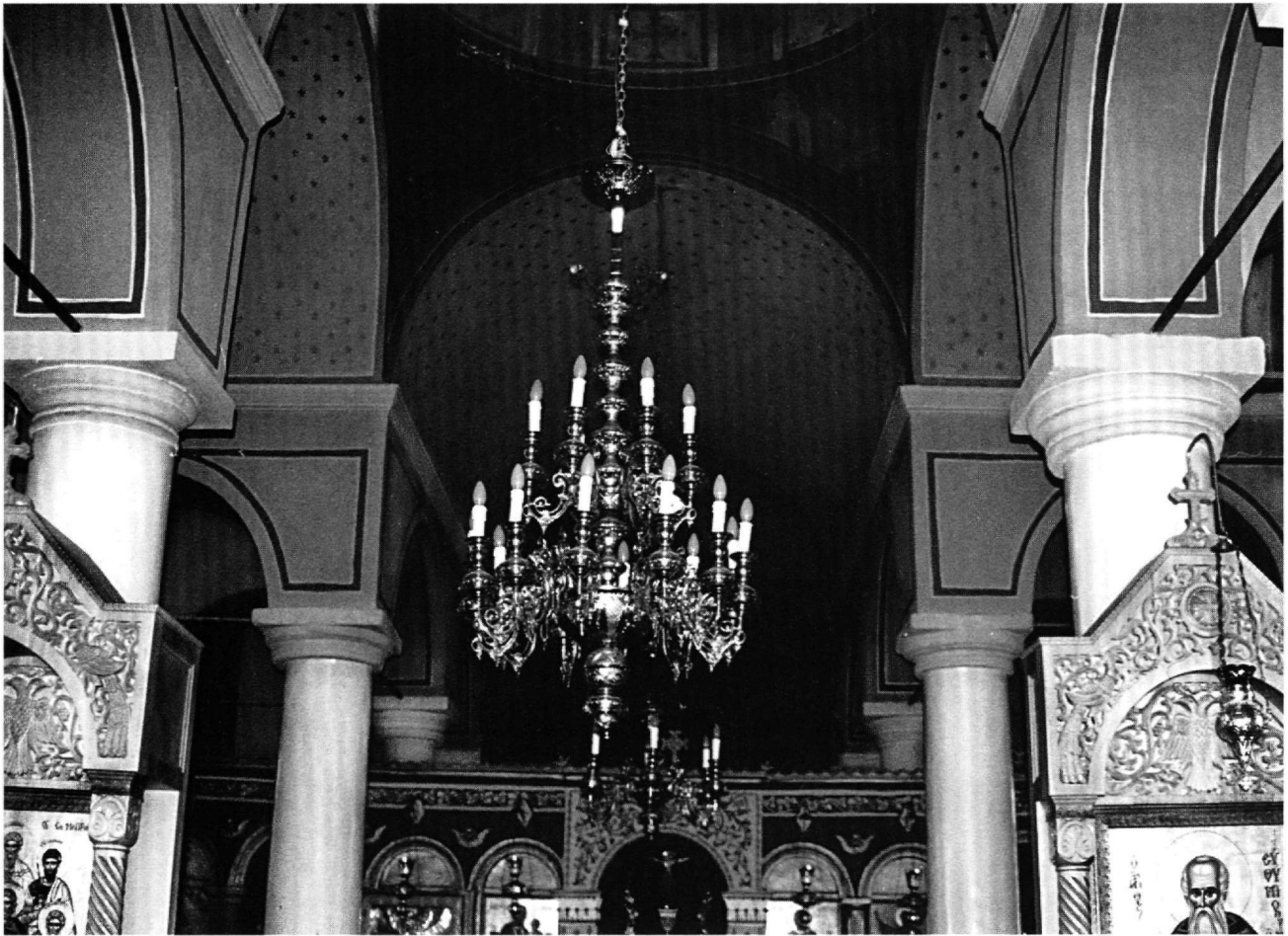
Εικ. 3. Μέγαρα. Ναός τῶν Ἁγίων Ἑξή Μαρτύρων. Τό ἐσωτερικό πρὸς Α. μέ τούς κίονες σέ δεύτερη χρῆση.

ἀμελῶς σχεδιασμένα τρίφυλλα στίς ἄκρες. Ὁ διάκοσμος τοῦ ἐχίνου μοιάζει μέ τόν ἐχίνο δύο κιονοκράνων ἀπό τήν Ἀθήνα, πού χρονολογοῦνται στό τρίτο τέταρτο τοῦ 5ου αἰώνα 52 . Στήν ἴδια ἐποχή μπορεῖ νά χρονολογηθεῖ καί τό μεγαρικό χριστιανικό κιονόκρανο. Δύο ἀμφικιονίσκοι παραθύρου μέ τά ἀντίστοιχα ἐπιμήκη ἐπιθήματά τους χωρίζουν τά δίλοβα παράθυρα στήν ἀψίδα καί στό βόρειο τοῖχο. Ἡ στενή πλευρά τοῦ ἐπιθήματος τῆς ἀψίδας κοσμεῖται στά ἄκρα μέ δύο λογχοειδή φύλλα, τά ὁποῖα πλαισιώνουν μέταλλο πού ἐγκλείει