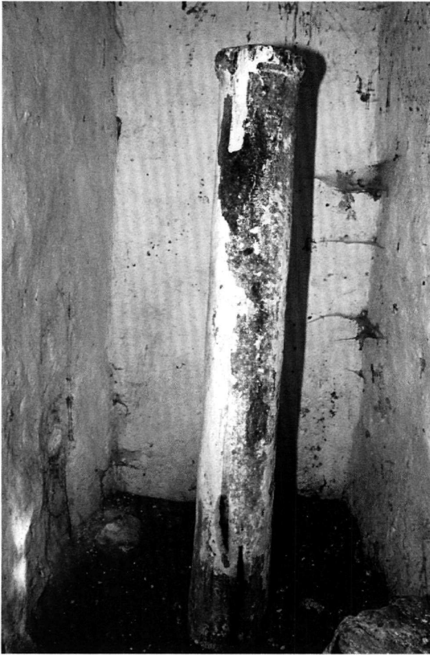
Εἰκ. 2. Μέγαρα. Ναός τῶν Ἁγίων Ἐξι Μαρτύρων. Τὸ ἐσωτερικὸ τοῦ τάφου μὲ τὸν κίονα.

σηματα τῆς περιοχῆς 49 . Κοντὰ στὴ βόρεια στενὴ πλευρὰ ὑψώνεται λεπτός ἀρράβδωτος κίονας (ὑψ. 1,97, διαμ. ἐπάνω 0,19 μ.) ἀπὸ γκρίζο μάρμαρο μὲ ἀπόφυση ἀπὸ σπείρα καὶ ταινία στὸ ἐπάνω μέρος (Εἰκ. 2). Ὁ κίονας εἶναι πιθανῶς χριστιανικός. Ἀνῆκε ἴσως ἀρχικά σὲ κιβώριο ἢ μικρὸ προστώο καὶ μᾶλλον τοποθετήθηκε ἐκεῖ