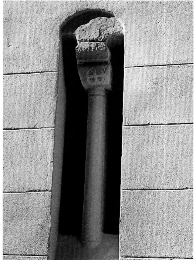
Εἰκ. 5. Μέγαρα. Ναός τῶν Ἁγίων Ἑξι Μαρτύρων. Ὁ ἀμφικιονίσκος μέ τό ἐπίθημα στό παράθυρο τῆς ἀψίδας τοῦ Ἱεροῦ (β' μισό 5ου αἰ.).

νάνθημα 55 . Ἀνάλογος εἶναι ὁ διάκοσμος ὁμοίων ἐπιθημάτων ἀμφικιονίσκων πού βρίσκονται ἐντοιχισμένα στό ἐπάνω μεσαῖο τμήμα τοῦ νότιου καί τοῦ δυτικοῦ τοίχου. Τό ἴδιο συνέβαινε καί στό ἐπίθημα τοῦ δίλοβου παραθύρου στό βόρειο τοῖχο, ὅπου διακρίνεται μόνον ἓνα λογοειδές φύλλο. Ὁ λιτός αὐτός διάκοσμος φαίνεται νά συνηθίζεται τήν παλαιοχριστιανική ἐποχή σέ ἀνάλογα γλυπτά τῆς κεντρικῆς Ἑλλάδας.