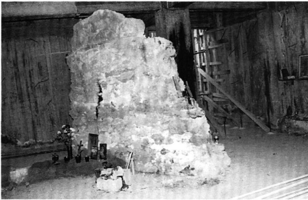
Εικ. 8. Μέγαρο. Ναός τῶν Ἁγίων Τεσσάρων Μαρτύρων. Κατάλοιπα τῆς παλαιοχριστιανικῆς ἀψίδας.

ἀπλές μὲν, ἀρκετά ὁμως ἰσχυρές ἐνδείξεις, πού γιὰ νά ἐπιβεβαιωθοῦν χρειάζεται περαιτέρω ἀνασκαφική διερεύνηση τοῦ χώρου γύρω ἀπό τό ναό τῶν Ἁγίων Ἑξι Μαρτύρων.