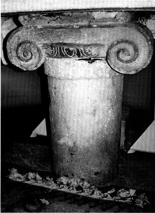
Εἰκ. 4. Μέγαρα. Ναός τῶν Ἁγίων Ἑξι Μαρτύρων. Τμήμα κίονα μέ ἰωνικό κιονόκρανο (γ' τέταρτο 5ου αἰ.), ὡς βάση τῆς ἁγίας Τράπεζας.