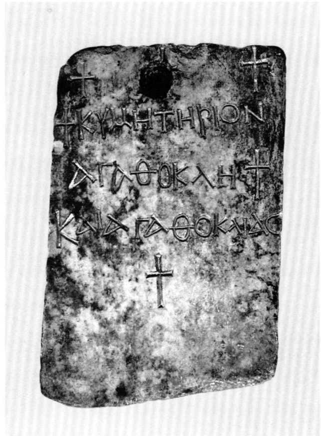
Εἰκ. 11. Μέγαρα. Ναός Ἁγίας Παρασκευῆς. Ἐνεπίγραφη ἐπιτύμβια πλάκα (5ος-6ος αἰ.).

Ἡ ἴδια ἐγκατάλειψη παρατηρεῖται καί στό μεγάλο προσκνήμα τοῦ Ἁγίου Λεωνίδη στή γειτονική Κόρινθο. Καί στίς δύο περιπτώσεις δέν κτίστηκαν ἐπάνω στούς παλαιούς ναούς κάποιοι μεσαιωνικοί, πού θά συνέχιζαν τήν παράδοση τῶν παλαιοχριστιανικῶν προσκνημάτων, μέ ἀποτέλεσμα νά ξεχαστεῖ ἡ παλαιά λατρεία. Ὁ Βίος τοῦ ἁγίου καί τά ἀρχαιολογικά κατάλοιπα ὁδήγησαν τόν ἀείμνηστο καθηγητή Δημήτριο Πάλλα στό Λέχαιο, στήν ἀνασκαφή τῆς ἐντυπωσιακῆς βασιλικῆς τοῦ Ἁγίου Λεωνίδη. Κάτι ἀνάλογο φαίνεται ὅτι συμβαίνει καί στά Μέγαρα. Ἐδῶ ἡ «συλλογική ὑποσυνείδητη μνήμη» τῶν κατοίκων τῆς περιοχῆς διατήρησε κάποια ἀνάμνηση τῶν παλαιοχριστιανικῶν προσκνημάτων. Ἡ μνήμη αὐτή καλλιέργησε τίς παραδόσεις γιά ὑπαρξή λειψάνων πρωτοχριστιανικῶν ἁγίων στά Μέγαρα. Τά λείψανα αὐτά ἀνακαλύφθηκαν κατά θαυμαστό τρόπο τό 18ο αἰῶνα μέσα στό γενικότερο πνεῦμα τῆς ἐποχῆς γιά ἀναζήτηση ἀπό τούς χριστιανούς προτύπων προκειμένου νά ἀντιμετωπιστεῖ ὁ κίνδυνος τοῦ ἐξισλαμισμοῦ. Ὅλα αὐτά ἔρχονται τώρα νά τά ἐπιβεβαιώσουν καί τά ἐλάχιστα ἐναπομείναντα ἀρχαιολογικά κατάλοιπα.