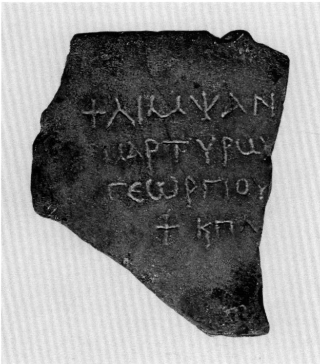
Εικ. 10. Μέγαρα. Ναός Αγίας Παρασκευής. Τμήμα ἐνεπίγραφης πλάκας ἀπὸ τὸ κάλυμμα λευκανοθήκης ἐγκαίνιου (περ. 500).

φῆς μὲ τὸ «Πάτερ ἡμῶν...», πού βρέθηκε τὸ 19ο αἰώνα στὰ Μέγαρα. Σήμερα ἀπόκειται στὸ Βυζαντινὸ Μουσεῖο στὴν Ἀθήνα (BM 375, T 367) καὶ χρονολογεῖται στὸν 5ο αἰώνα 73 . Ἡ γραφή ἐδῶ, ἐπειδὴ τὸ κείμενο χαράχθηκε σὲ μαλακό, ἄψητο πηλό, εἶναι μὲν περισσότερο ἄνετη, ἀλλὰ ἀμελέστερα ἀποδοσμένη ἀπὸ τῆς ἐπιγραφῆς πού παρουσιάζεται ἐδῶ. Τὰ στοιχεῖα ὁμως Α, Ε, Λ, Μ, Ν, Ρ, Υ, Ω ἀποδίδονται μὲ τὸν ἴδιο τρόπο καὶ στίς δύο. Τοῦτο ἐπιτρέπει τὴ χρονολόγησι καὶ τῆς παρούσας ἐπιγραφῆς στὴν ἴδια ἐποχή. Ἀνάλογες ὁμοιότητες παρατηροῦνται καὶ μὲ τὴν ἀθηναϊκὴ ἐπιγραφή τῆς