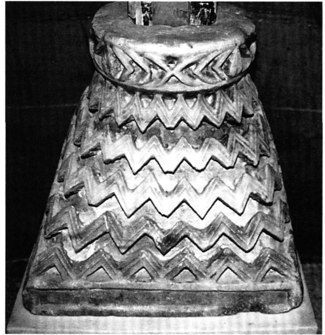
Εικ. 6-7. Μέγαρα. Ναός Κομήσεως της Θεοτόκου. Κολουροσφραμοειδές τεκτονικό κιονόκρανο, εμπρόσθια και όπισθια όψη (α' μισό βου αι.).

ώργιος. Στή σπείρα της βάσης τοποθετούνται συμμετρικά τέσσερα έλλειψοειδή φύλλα, πού τό καθένα πλαισιώνεται από τριάδες μικρών λογοχειδών φύλλων διατεταγμένων σε σχήμα ψαροκόκαλου 57 . Τό κιονόκρανο μπορεί νά χρονολογηθεί στό πρώτο μισό του βου αιώνα και προέρχεται, όπως παραδίδεται, από την περιοχή του ναού τών Άγίων Έξι Μαρτύρων 58 . Όμοιο, θραυσμένο στό κάτω τμήμα κιονόκρανο έχει έντοιχιστεί στόν έξω-νάρθηκα του ναού της Καπνικαρέας στην Άθήνα 59 .