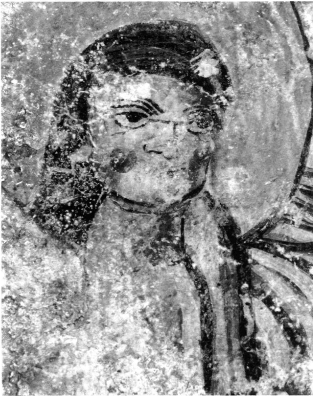
Εικ. 7. Χάλκη, Αντράμασος. Άγιος Ανδρέας. Ιερό. Καμάρα, νότια πλευρά. Ο αρχάγγελος του Ευαγγελισμού.

που στα Κορογονιάνικα 59 , όλα στη Μάνη, και να τοποθετηθεί με επιφύλαξη στις αρχές του 11ου αιώνα 60 . Πρόκειται για τοιχογραφίες λαϊκού χαρακτήρα, που διακρίνονται από αφέλεια και αυθορμητισμό, με επίπεδη και γραμμική εκτέλεση και σχετική αδιαφορία για τη σωστή ανατομία. Χωρίς να υπάρχει άμεση σύνδεση με τις λεγόμενες αρχαϊκές τοιχογραφίες της Καππαδοκίας, πιθανόν να πρόκειται για τοπική, απλοποιημένη και παραποιημένη απόδοση λαϊκότερης τάσης που φθάνει, με καθυστέρηση, ίσως από τη Μικρά Ασία. Η