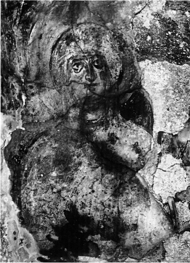
Εικ. 9. Νίσυρος, Καρδιά. Παναγία η Φανερωμένη. Ιερό. Ανατολικός τοίχος. Η αγία Κυριακή.

υπόθεση αυτή μάλιστα ενισχύεται από το γεγονός ότι η Χάλκη 61 πρέπει να ήταν από τα νησιά που δέχθηκαν στα τέλη του 11ου αιώνα μέρος του προσφυγικού ρεύματος από τη Μικρά Ασία 62 . Η εκκλησία αυτή της Χάλ-