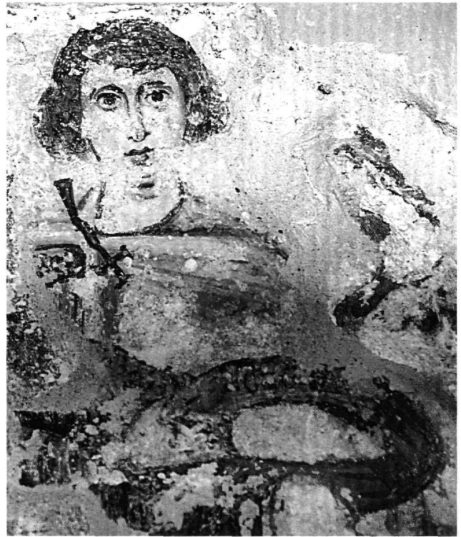
Εικ. 10. Κάλυμνος, Βαθύ. Άγιος Κήρυκος. Ιερό. Βόρειος τοίχος. Αδιάγνωστος άγιος.

Είναι γεγονός πάντως ότι τα λίγα δείγματα της μεσοβυζαντινής περιόδου στα Δωδεκάνησα δεν μας παρέχουν ξεκάθαρη εικόνα της μετάβασης στην τέχνη του 11ου αιώνα ούτε και του 12ου, όπου μέχρι το τελευταίο τέταρτο δεν έχουν σωθεί ζωγραφικά έργα. Είναι εξίσου βέβαιο ότι τα ζωγραφικά σύνολα στα Δωδεκάνησα της εποχής που μας απασχολεί θα ήταν ασφαλώς περισσότερα. Για παράδειγμα, στο αυτοκρατορικό χρυσόβουλλο του Μαΐου του 1087, που βρίσκεται στο πατμιακό αρχείο, υπάρχει έμμεση αναφορά σε δύο μνημεία στα Τεμένια της Λέρου που διακοσμούνταν με τοιχογραφίες, στην εκκλησία των Αγίων Αναργύρων και στην εκκλησία της Παναγίας που περικλειόταν από τριώροφο πύργο: «τό βήμα υπάρχει δι' ύλογραφίας» 72 . Η εκκλησία των Αγίων Αναργύρων, ανακαινισμένη το 1906,