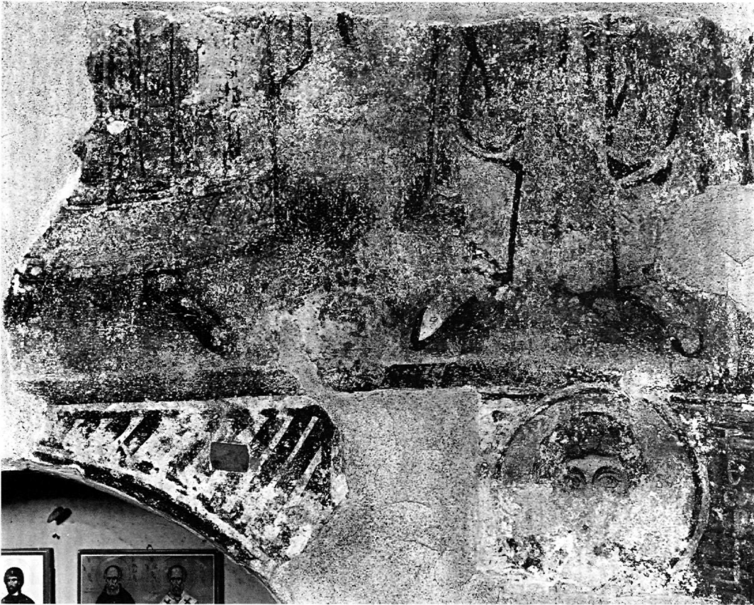
Εικ. 3. Ρόδος, Μαλώνα. Άγιος Γεώργιος ο Πλακωτός. Ιερό. Καμάρα και νότιος τοίχος. Ολόσωμες μορφές και άγιος Γεώργιος.

σφαίριο της αψίδας στη Δροσιανή της Νάξου, στον 11ο αιώνα, και μάλιστα αντικαθιστώντας την παράσταση του αναλαμβάνόμενου Χριστού 27 .