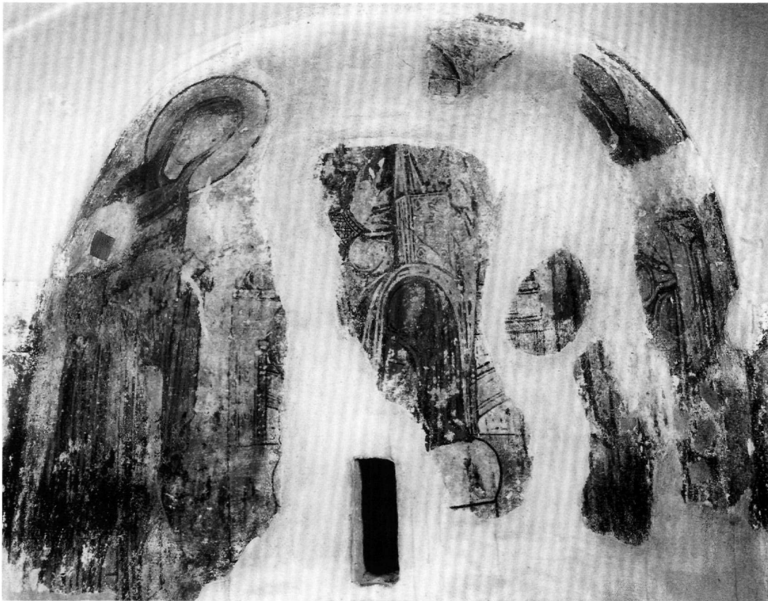
Εικ. 2. Ρόδος, Μαλώνα. Άγιος Γεώργιος ο Πλακωτός. Ιερό. Η Δέηση.

κού προγράμματος, επειδή πρόκειται για ιδιωτικούς ναούς 24 , δεν είναι ικανή να μας οδηγήσει να παραβλέψουμε το γεγονός ότι μόνο από τα μνημεία της περιοχής αυτής αποκομίζουμε ολοκληρωμένη εικόνα για τα εικονογραφικά προγράμματα της εποχής. Η Δέηση είναι παράσταση πολύσημη που συμβολίζει τη μεσιτεία της Παναγίας και του Προδρόμου προς τον Χριστό για τη σωτηρία των ανθρώπων, αλλά και τη μαρτυρία των μεσιτευομένων για την ενανθρώπιση του Λόγου. Όπως σωστά έχει συνοψιστεί για τη θέση και την ερμηνεία της παράστασης, η απεικόνιση της Δέησης, εκτός από τον εσχατολογικό της χαρακτήρα, εκφράζει την επιθυμία