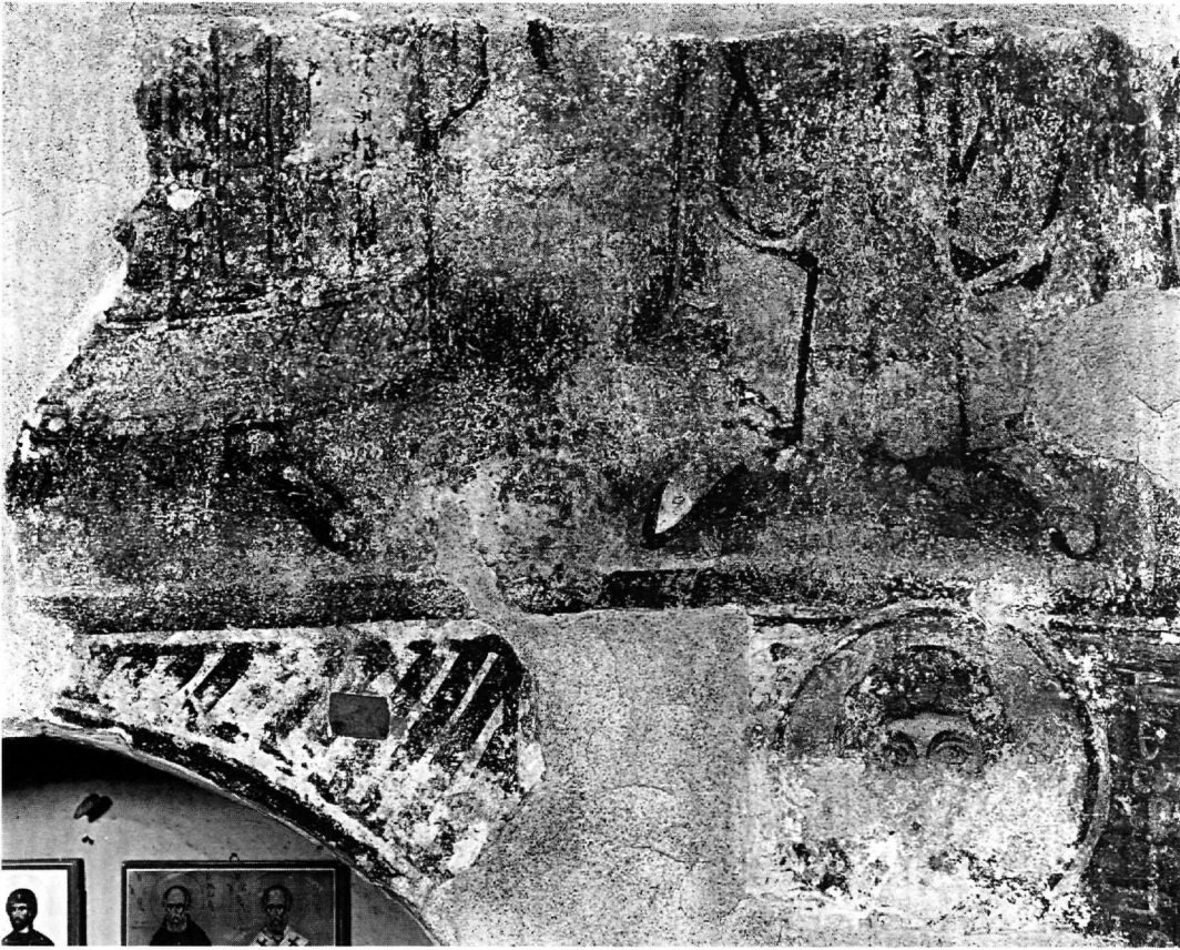
Εικ. 3. Ρόδος, Μαλώνα. Άγιος Γεώργιος ο Πλακωτός. Ιερό. Καμάρα και νότιος τοίχος. Ολόσωμες μορφές και άγιος Γεώργιος.

σφαίριο της αψίδας στη Δροσιανή της Νάξου, στον 11ο αιώνα, και μάλιστα αντικαθιστώντας την παράσταση του αναλαμβάνόμενου Χριστού 27 .