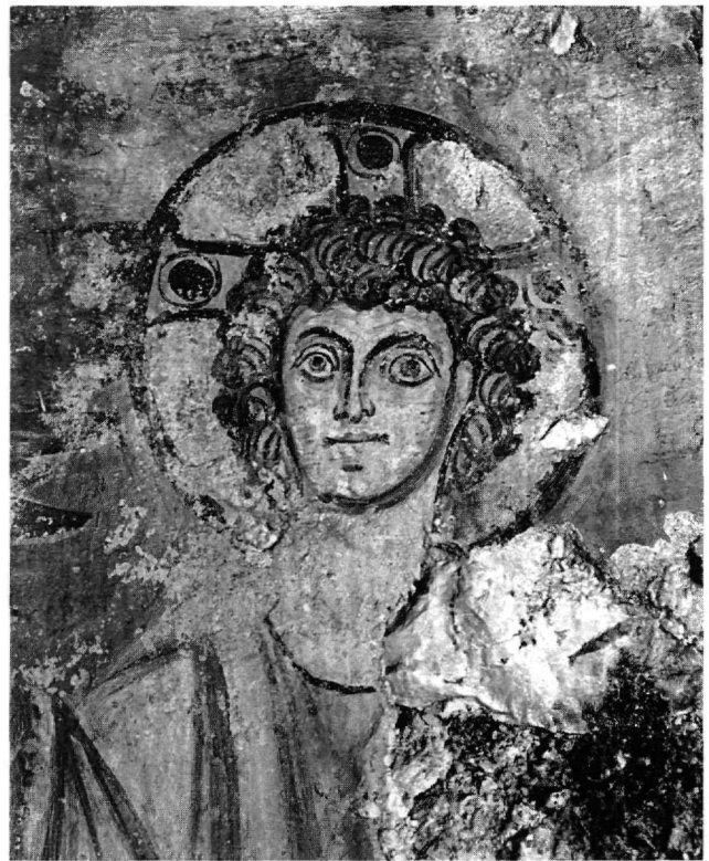
Εικ. 11. Χάλκη, Κελλιά. Ασκηταριό. Ο Χριστός Εμμανουήλ.

Πιστεύουμε ότι δεν αποκλείεται οι ανεικονικές τοιχογραφίες στα Δωδεκάνησα να χρονολογούνται πράγματι στην περίοδο της εικονομαχίας. Αν μέσα σε αυτή την περίοδο, σε συγκεκριμένες περιπτώσεις, ακολουθείται