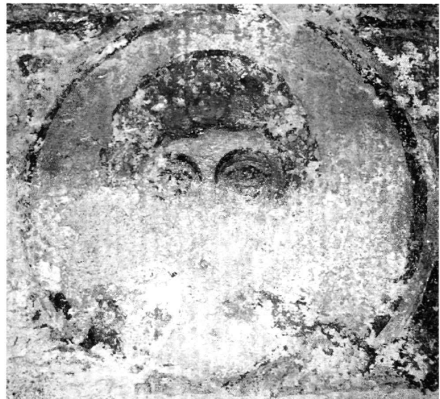
Εικ. 4. Ρόδος, Μαλώνα. Άγιος Γεώργιος ο Πλακωτός. Ιερό. Νότιος τοίχος. Ο άγιος Γεώργιος.

Στον ημικύλινδρο της αψίδας του Πλακωτού δεν απεικονίζονται ιεράρχες. Όπως έχει παρατηρηθεί 28 , μετά την εικονομαχία μέχρι και τον 11ο αιώνα, δεν έχει σταθεροποιηθεί ακόμα η θέση και η σύνδεση των παραστάσεων των ιεραρχών με το Ιερό Βήμα, ενώ από το 12ο αιώνα και μετά η σημασία των ιεραρχών στην εικονογράφηση της αψίδας σταθεροποιείται σύμφωνα με