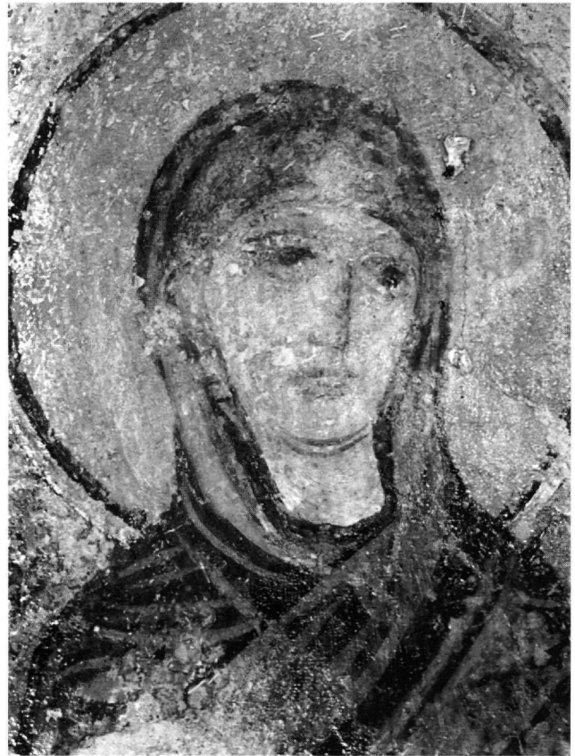
Εικ. 5. Ρόδος, Μαλώνα. Άγιος Γεώργιος ο Πλακωτός. Ιερό. Η Θεοτόκος της Δέησης.

Οι συγκρίσεις με την τέχνη που καλλιεργείται αυτή την εποχή στις Κυκλάδες πιθανόν να μην είναι υπερβολικές, αφού η Νάξος ανήκει στη μητρόπολη Ρόδου μέχρι το 1083 38 . Η ομοιότητα όμως με άλλα ζωγραφικά σύνολα από την Κρήτη ίσως είναι περισσότερο διαφωτιστική. Η συγγένεια ως προς τη γραμμική αντιμετώπιση και την επίπεδη απόδοση με τα πρώτα στρώματα της Παναγίας στα Μυριοκέφαλα Ρεθύμνου 39 (του πρώτου τετάρτου του 11ου αι.) και του Αγίου Ευτυχίου και της Παναγίας Κεράς στο Χρωμοναστήρι Ρεθύμνου 40 (προς το τέλος του 11ου αι.) τοποθετεί τη ζωγραφική του Πλακωτού σε ενδιάμεσο στάδιο. Οι τοιχογραφίες του Αγίου Γεωργίου είναι κατώτερες ποιοτικά από των Μυριοκεφάλων, ενώ διαφοροποιούνται από τις δύο εκκλησίες στο Χρωμοναστήρι 41 με τη λαϊκότερη τεχνοτροπία τους. Δεν είναι βέβαια εφικτός ο στενότερος χρονολογικός προσδιορι-