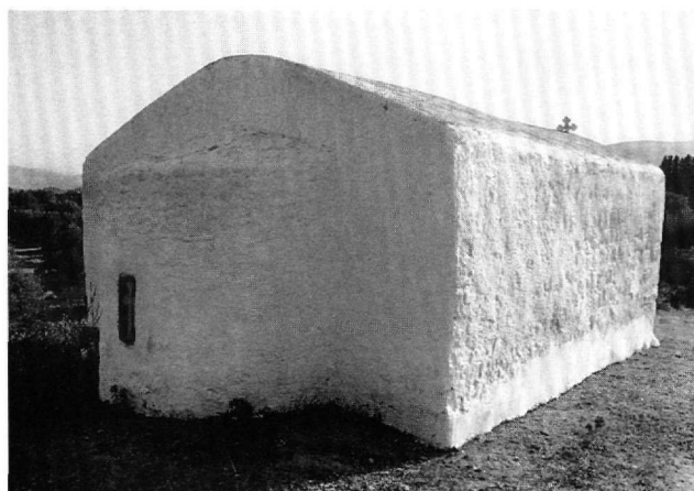
Εικ. 1. Ρόδος, Μαλώνα. Ο Άγιος Γεώργιος ο Πλακωτός.

Οι εικονογραφικές παρατηρήσεις, δεδομένης της αποσπασματικότητας του διακόσμου του ιερού, εστιάζονται σε τρία κυρίως σημεία: στην απεικόνιση της Δέησης στην αφίδα, στην απουσία ιεραρχών από τον ημικύλινδρο και, τέλος, στην απουσία της Ανάληψης ή άλλης παράστασης από την καμάρα του ιερού, με την παράλληλη απεικόνιση σε αυτή ολόσωμων αγίων.