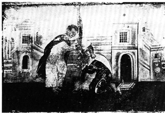
Εικ. 7. Εικόνα στο ναό της Αγίας Ελένης, κάστρο Χώρας Μυκόνου. Η σκηνή της ευλογίας του αγίου Νέστορος (Ξυγούπουλος, πίν. VI).

Ωστόσο, η περιγραφή της συγκεκριμένης σκηνής από τον Διονύσιο τον εκ Φουρνά στην Ερμηνεία της ζωγραφικής τέχνης είναι διαφορετική: Ὁ ἅγιος Νέστορ γονατιστός, ἔχων ὑψωμένα τὰ χέρια κι ἔμπρὸς αὐτοῦ λουτρὸν καὶ ἀπὸ τὸ παράθυρον τοῦ λουτροῦ ὀλίγο φαινόμενος ὁ ἅγιος Δημήτριος εὐλογεῖ αὐτόν 12 . Ασφα-