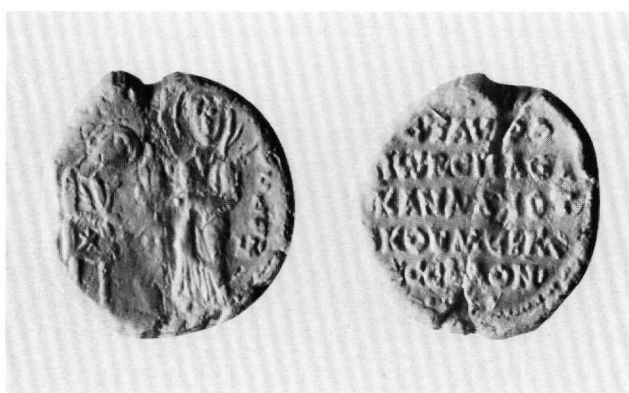
Εικ. 2. Εκμαγείο από το μολυβδόβουλλο του Σταυρακίου, βασιλικού σπαθαροκανδιάτου, πρωτονοταρίου και κομμερκαρίου Θεσσαλονίκης. Αθήνα, Νομισματικό Μουσείο (Κωνσταντόπουλος, αριθ. 7).

[τ(ωνίτη)] (;) (και) (πρωτο)νοτ(αρίω). Η ανάγνωση είναι αβέβαιη ως προς τα τρία τελευταία γράμματα του τρίτου στίχου, όπου δηλώνεται ένα ακόμα αξίωμα του κατόχου, πιθανώς του κοιτωνίτη.