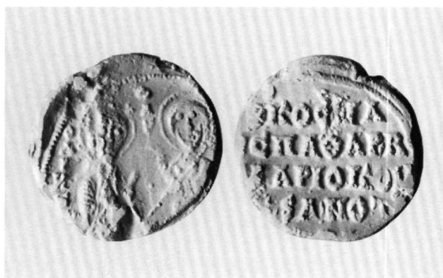
Εικ. 3. Εκμαγείο από το μολυβδόβουλλο του Κοσμά, σπαθαροκουβικουλαρίου, κοιτωνίτη (;) και πρωτονοταρίου. Αθήνα, Νομισματικό Μουσείο (ΑΗ10/1931).