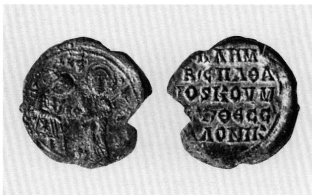
Εικ. 1. Μολυβδόβουλλο του Κλήμεντος, βασιλικού σπαθαρίου και κομμερκαρίου Θεσσαλονίκης. Dumbarton Oaks Collection, Fogg 1775 (DOSeals, 1, αριθ. 18.37).