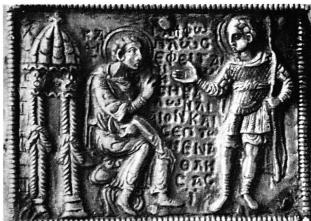
Εικ. 4. Αργυρό επιχρυσωμένο κιβωτίδιο στη μονή Βατοπεδίου. Η σκηνή της ευλογίας του αγίου Νέστορος (ΑΕ 1936, πίν. Β, εικ. 3).

4. Τοιχογραφίες στον Άγιο Δημήτριο στο Ρεέ και στην