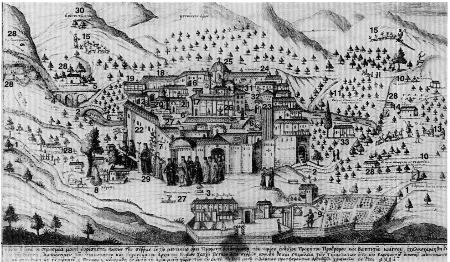
Εικ. 1. Χάρτινη εικόνα από τη μονή Τιμίου Προδρομού Σερρών (1. Ο δρόμος από Σέρρας, ο δρόμος διά τὰ Σέρρας. 2. Γεφύρι. 3. Τό ξενοδοχείον. 4. Τό ποτάμι. 5. Τό ύδραγωγείον. 6. Οί βρύσες. 7. Ο μίλος. 8. Η δρύστα (= νεροτριβή). 9. Ο κήπος. 10. Τά άμπέλια. 11. Ο μέγας έλαιώνας του κοιμητηρίου. 12. Ο λινός. 13. Τό άλλόνι. 14. Η δοχή. 15. Κοπάδια. 16. Τό ώρολόγιον. 17. Καμπαναρείον. 18. Τό άρχονταρίκιον. 19. Τό δεσποτικόν. 20. Τό μαγηρείον. 21. Η τράπεζα. 22. Ο περιβόλος. 23. Ο πύργος. 24. Νοσοκομείον. 25. Καθολικό. 26. Η φιάλη. 27. Άγίασμα, τόπος του άγιασμού. 28. Έκκλησίες (ή άγία παρασκευή, ό Ταξιάρχης, ή μεταμόρφωσις, οί άγιοι άνάγκυροι). 29. Λιτανεία. 30. Η σκήτη του κίτορος. 31. Χαροφυλάκιον. 32. Σκευοφυλάκιον. 33. Τό κοιμητήριον).

νο, τότε, ταξίδι, που απαιτούσε αντοχή και δαπάνη ξεχωριστή, αποτελούσε το ίδιο, ως μετάβαση και ως επιστροφή, μια δοκιμασία. Ήταν τότε τμήμα ουσιαστικό της όλης προσκυνηματικής διαδικασίας, γιατί πρόσφερε ευκαιρίες προσκυνήματος και σε ενδιάμεσους σταθμούς, γνωριμίες με άλλες χριστιανικές κοινότητες, νέους, διαφορετικούς γεωγραφικούς και κοινωνικούς ορίζοντες, έναν άλλο τύπο ομαδικής ζωής, πολλαπλές εμπειρίες και αφορμές για αναθεωρήσεις –ελευθερία. Για όλους αυτούς τους λόγους απέβαινε ένα ταξίδι άγιο. Σκοπός της ιεραποδημίας η επίσκεψη της Παλαιστίνης, του ιερού χώρου της ιστορίας του Κυρίου, η προσκύνηση του Πανάγιου Τάφου, των χώρων που αναφέρονται στα Ευαγγέλια, των τάφων και των λειψάνων άλλων αγίων, η συμμετοχή στις ιεροτελεστίες, σε κηρύγματα,