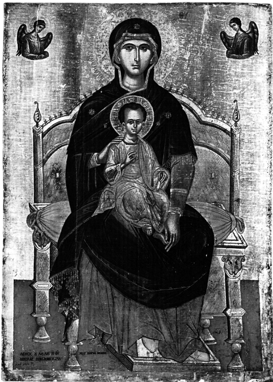
Εικ. 1. Αθήνα. Μουσείο Μπενάκη. Ένθρονη Παναγία βρεφοκρατούσα.