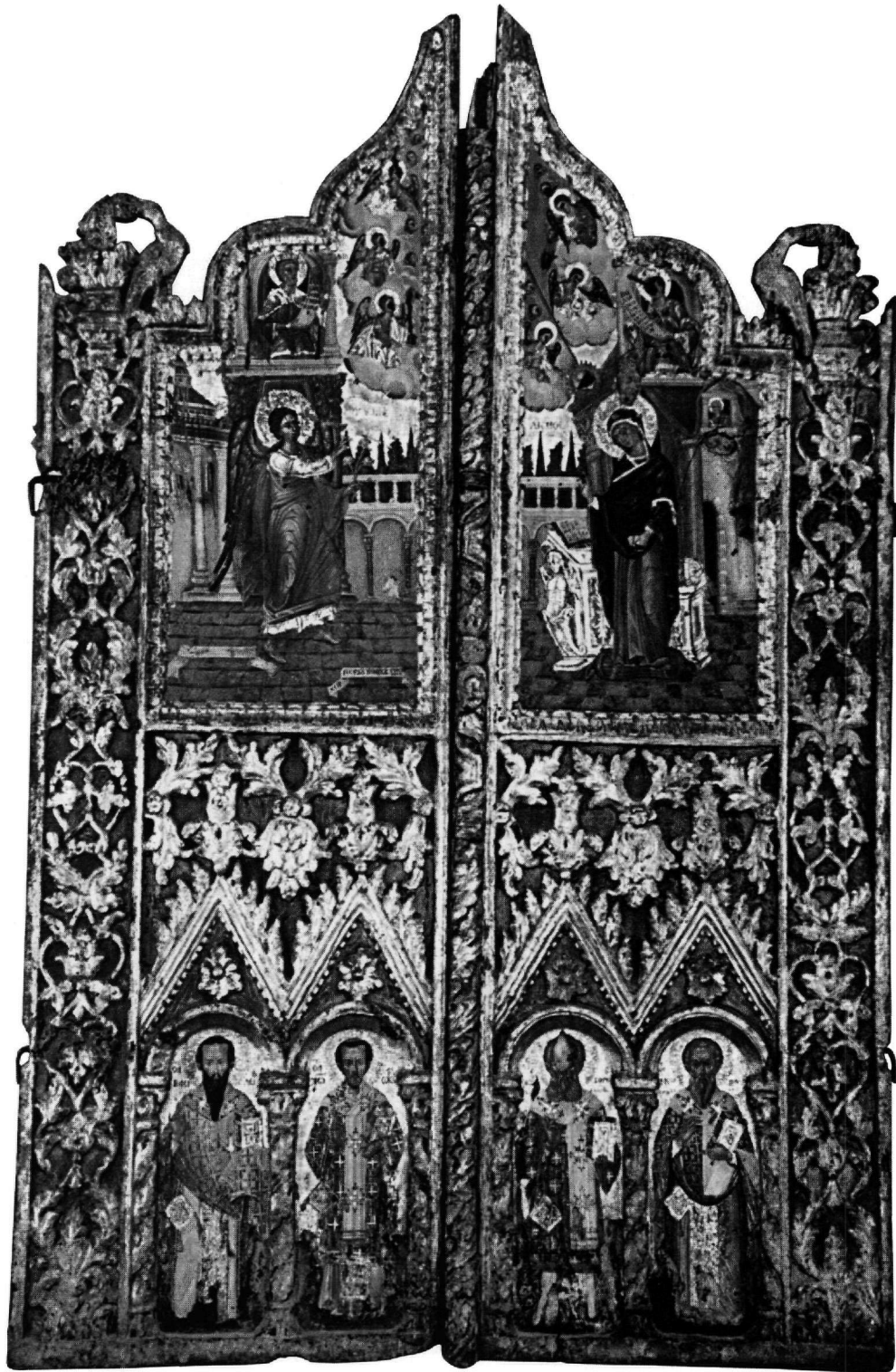
Εικ. 2. Άρτα. Ναός Αγίου Μερκουρίου. Βημόθυρο.