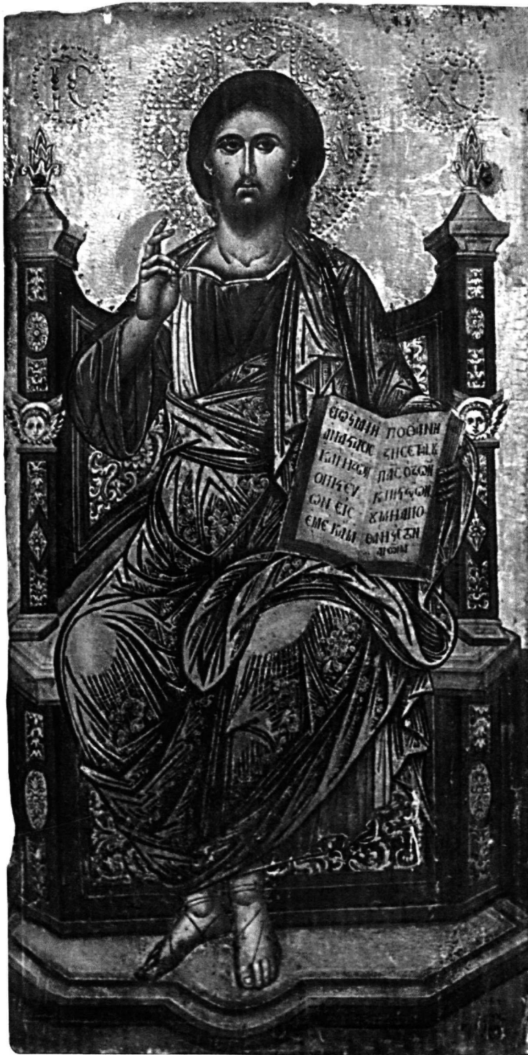
Εικ. 7. Μασούκι Ιωαννίνων. Μονή Βύλιζας. Ο Χριστός Παντοκράτορας.