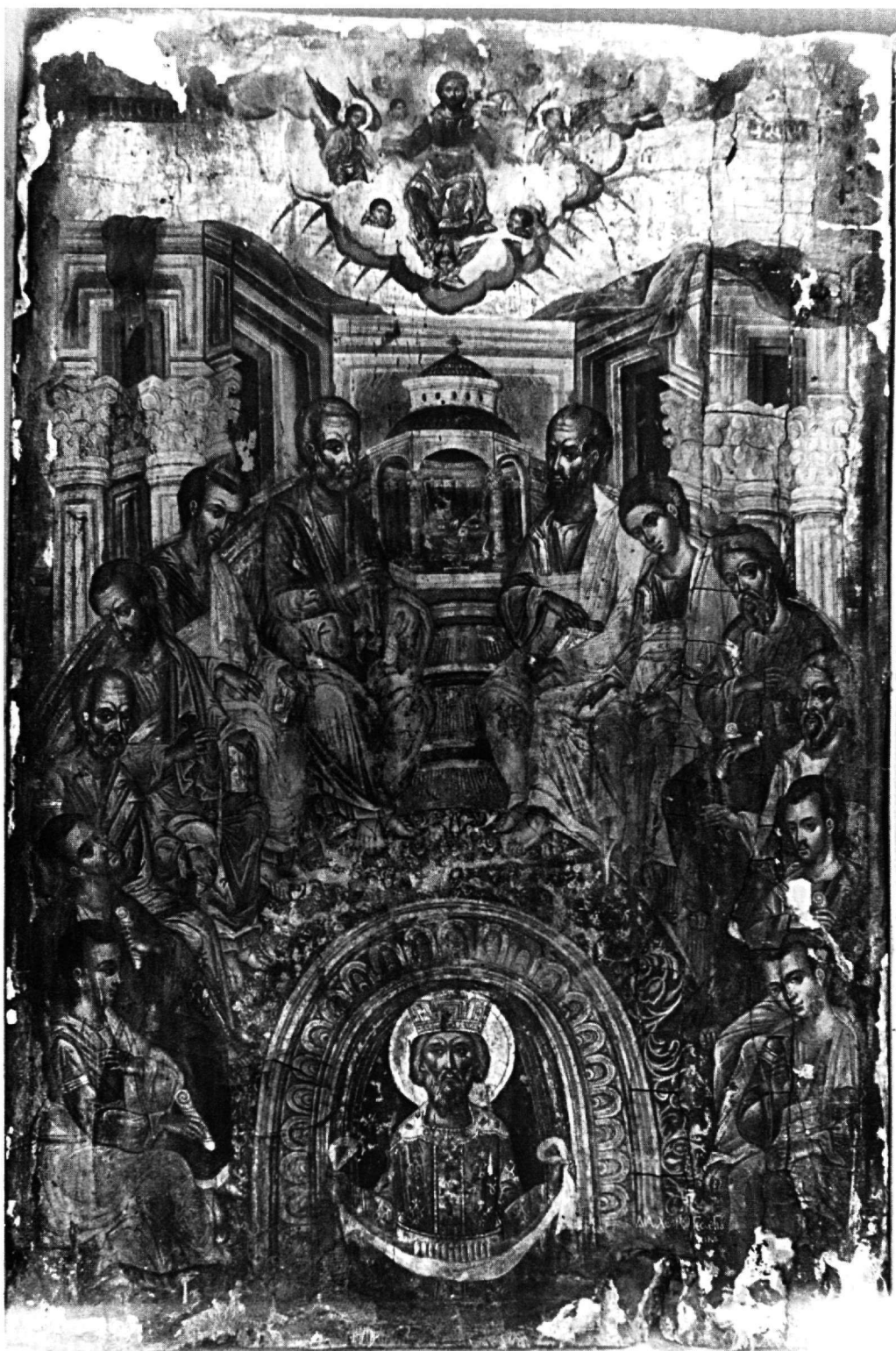
Εικ. 6. Άρτα. Μονή Φανερωμένης. Η Πεντηκοστή.