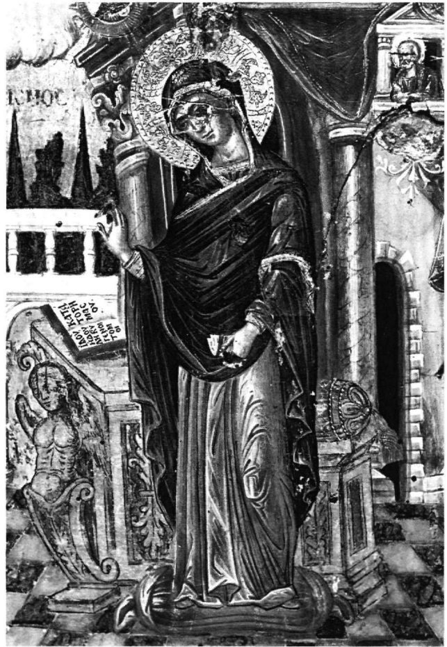
Εικ. 3-4. Άρτα. Ναός Αγίου Μερκουρίου. Βημόθυρο. Λεπτομέρειες από την παράσταση του Ευαγγελισμού.

θύρου του 1480-1500, που βρίσκεται στο ναό του Χριστού στη Χώρα της Πάτμου 73 . Είναι γνωστό ότι πολλά έργα ξυλογλυπτικής μεταφέρθηκαν λίγο πριν και μετά τη μετανάστευση των Κρητών στα Επτάνησα, όπου και επηρέασαν βαθιά την ντόπια καλλιτεχνική παραγωγή 74 . Με δεδομένη λοιπόν αυτή την επιρροή, μπορούμε να θεωρήσουμε ότι το βημόθυρο του Αγίου Μερκουρίου αποτελεί έργο δημιουργικής συγχώνευσης των στοιχείων της ντόπιας και της επείσακτης παράδοσης, που