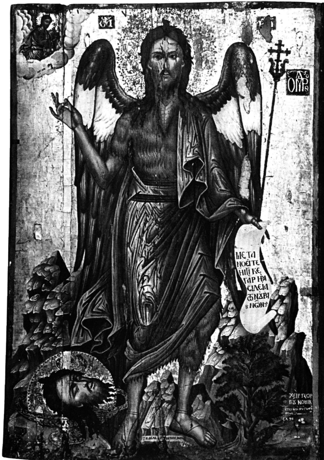
Εικ. 5. Αρτα. Μονή Κάτω Παναγιάς. Ο άγιος Ιωάννης ο Προδρομος.