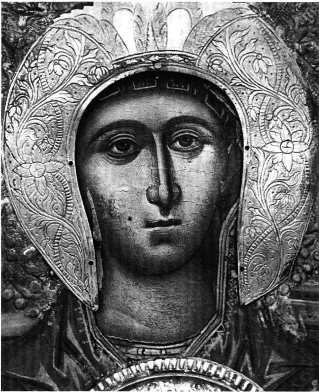
Εικ. 10. Μασσούκι Ιωαννίνων. Μονή Βύλιζας. Ένθρονη Παναγία βρεφοκρατούσα. Λεπτομέρεια.