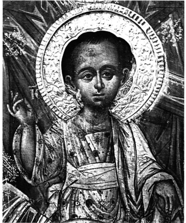
Εικ. 11. Μασσούκι Ιωαννίνων. Μονή Βύλιζας. Ο Χριστός. Λεπτομέρεια της εικόνας της ένθρονης Παναγίας (Εικ. 9).

ρό του γόνατο κλειστό ειλητάριο. Το δεξί χέρι της Παναγίας ακουμπά προστατευτικά τα πόδια του Ιησού, ενώ το αριστερό πέφτει χαλαρό στο πλάι. Και οι δύο μορφές είναι μετωπικές, στον ίδιο άξονα, με μόνη απόκλιση τα γόνατα της Θεοτόκου που κλίνουν προς τα αριστερά. Το κεφάλι της πλαισιώνεται από ανάγλυφο φωτοστέφανο, διακοσμημένο με άνθη και βλαστούς, και φέρει ένα δεύτερο, μικρότερο, ασημένιο φωτοστέφανο με εγχάρακτη φυτική διακόσμηση. Ανάγλυφα επίσης είναι και τα συμπλήματα ΜΡ ΘΥ, δεξιά και αριστερά. Αργυρό φωτοστέφανο με σφυρήλατη φυτική διακόσμηση φέρει επίσης και ο Χριστός.