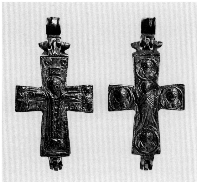
Εικ. 1. Σταυρός-λειψανοθήκη. Α' όψη: Η Σταύρωση. Β' όψη: Η Παναγία και οι ευαγγελιστές.

νης στο επάνω τμήμα της κάθετης κεραίας αποτελούν τους μάρτυρες του γεγονότος της Σταύρωσης 9 . Στην άλλη όψη παριστάνεται η Παναγία με τα χέρια σε δέηση 10 (Εικ. 1). Φορεί μακρύ μάτιο και μαφόριο που πτυχώνεται στο ύψος του στήθους. Περιβάλλεται από τους τέσσερις ευαγγελιστές σε μέταλλα, διατεταγμένα στα άκρα των κεραίων.