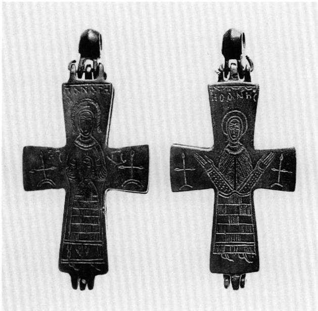
Εικ. 5. Σταυρός-λειψανοθήκη. Α' όψη: Η Παναγία με τον Χριστό. Β' όψη: Ο άγιος Ιωάννης.

της κάθετης κεραίας. Παριστάνεται μετωπικός, σε στάση δέησης, με χέρια που εκτείνονται μέχρι τις επάνω γωνίες της οριζόντιας κεραίας. Φορεί βραχύ χειριδωτό