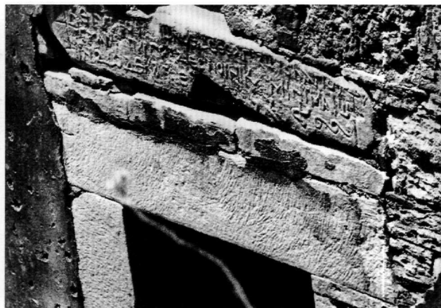
Εικ. 1-2. Η επιγραφή στο κάστρο Πυθαγορείου της Σάμου.