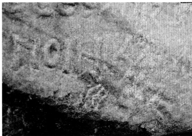
Εικ. 4. Λεπτομέρεια της επιγραφής, όπου η χρονολογία.

Χριστό που γίνεται στην παρούσα επιγραφή. Συνεχίζει με τη φράση «ὁ εἰς σὲ ἐλπίζων οὐκ ἀποτυγχάνει», πάλι όμοια με την παρούσα επιγραφή 9 , και καταλήγει με μία κάπως ασαφή και λίγο ακατάληπτη προσφορά προς την Θεοτόκο, που υποδηλώνει κυριότητα της Παναγίας, όπως κυριότητα της Παναγίας ενδέχεται να υποδηλώνει η φράση πύργος δεσποινικός στην επιγραφή