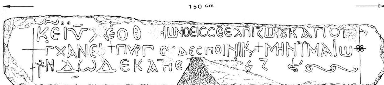
Εικ. 3. Σχεδιαστική απόδοση της επιγραφής (υπό Ν. Καλλιοντζή).

Μετά τα παραπάνω, οι πρώτες δύο σειρές της επιγραφής πρέπει μάλλον να διαβάζονται ως εξής: