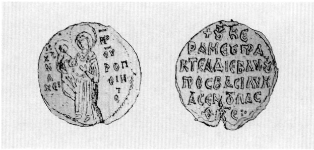
Εἰκ. 1. Παναγία ἢ «Ἀχειροποιήτος». Μολυβδόβουλλο τοῦ Κεραμέα (ἀπό G. Schlumberger).

τοῦ Θεοδοσίου Σκαράνου πρὸς τὴ μονὴ Ξηροποτάμου, ὁ Μιχαὴλ Η΄ Παλαιολόγος ἀπογραφέα ὄρισεν τὸν Κεραμέα 6 . Μεταξὺ τῶν ἐτῶν 1274-1280/81 ὁ ἴδιος αὐτοκράτορας σέ χρυσόβουλλο λόγο πρὸς τὴ μονὴ Δοχειαρίου ἐξασφάλισε στὸν πρωτοβεσιάριο Δημήτριο Μουρῖνο τὸ χωρίον Ἀντιγόχεια στὴν περιοχὴ τῆς Θεσσαλονίκης, ὅπερ παρεδόθη αὐτῷ παρὰ τοῦ Κεραμέα 7 .