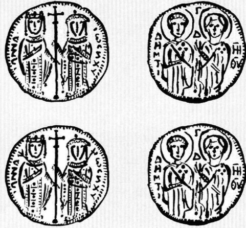
Εἰκ. 6. Ἡ Παναγία καὶ ὁ ἅγιος Δημήτριος. Ἀργυρὰ νομίσματα Ἰωάννη Ε' Παλαιολόγου καὶ Ἀννας τῆς Σαβοΐας (ἀπὸ S. Bendall - P.J. Donald).

Στὴν εἰκόνα τής Παναγίας Φανερωμένης τής Κυζίκου ἡ Θεοτόκος παριστάνεται στόν τύπο τής Ὁδηγήτριας πού ὑποβαστάζει μὲ τὸ ἀριστερό της χέρι τὸν Χριστό (Εἰκ. 5). Ἄν καὶ ἡ εἰκόνα φέρει ἀργυρόχρυση ἐπένδυση καὶ τὰ πρόσωπα εἶναι φθαρμένα, τὸ ἔργο χρονολογήθηκε στὸ 12ο αἰώνα ἐξαιτίας τής μετωπικῆς στάσης τῶν μορφῶν 66 . Ὁ ἴδιος εἰκονογραφικὸς τύπος ἀποτέλεσε τὸ πρότυπο γιὰ ὅλες τίς παλαιολόγειες φορητὲς εἰκόνες τίς ἀφιερωμένες στήν Παναγία Φανερωμένη 67 . Εἶναι βέβαιο πὼς ἐσκεμμένα ἐπέλεξε ὁ Μιχαήλ Η' Παλαιολόγος τὴν περιφημὴ εἰκόνα τής Θεοτόκου Ὁδηγήτριας γιὰ προπομπὸ τής θριαμβικῆς εἰσόδου του στή Βασιλεύου-