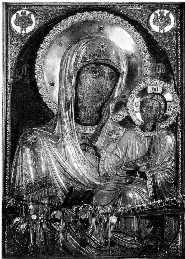
Εἰκ. 5. Κωνσταντινούπολη, πατριαρχικός ναός. Εἰκόνα τῆς Παναγίας Φανερωμένης τῆς Κυζίκου.

Σύμφωνα μέ τὴν παράδοση, ἡ ἀχειροποίητη εἰκόνα προερχόταν ἀπὸ τὴν περιώνυμη μονή τοῦ Μεγάλου Ἀγροῦ, πού καταστράφηκε κατὰ τὴν πρώτη δεκαετία τοῦ 14ου αἰῶνα 60 . Ἀφοῦ χάθηκε, φανερώθηκε ξανά, μετὰ ἀπὸ ὑπόδειξη τῆς ἴδιας τῆς Θεοτόκου, καί τοποθετήθηκε στή μονή τῆς Θεοτόκου Ἀχειροποιήτου καί Φανερωμένης τῆς Κυζίκου 61 . Ἔχω τὴ γνώμη πὼς πίσω ἀπὸ τὴν ἐκδοχὴ τῆς ἀπώλειας τῆς εἰκόνας καί τὴ θεϊκὴ φα-