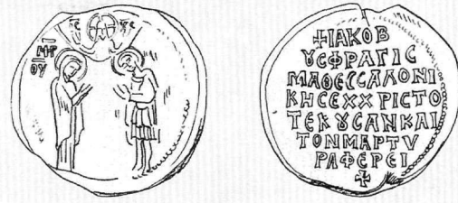
Εἰκ. 2. Ἡ Παναγία καί ὁ ἅγιος Δημήτριος. Μολυβδόβουλλο τοῦ Ἰακώβου Θεσσαλονίκης (ἀπό V. Laurent).

Τήν περιγραφή τῆς λατρευτικῆς εἰκόνας τῆς Θεοτόκου