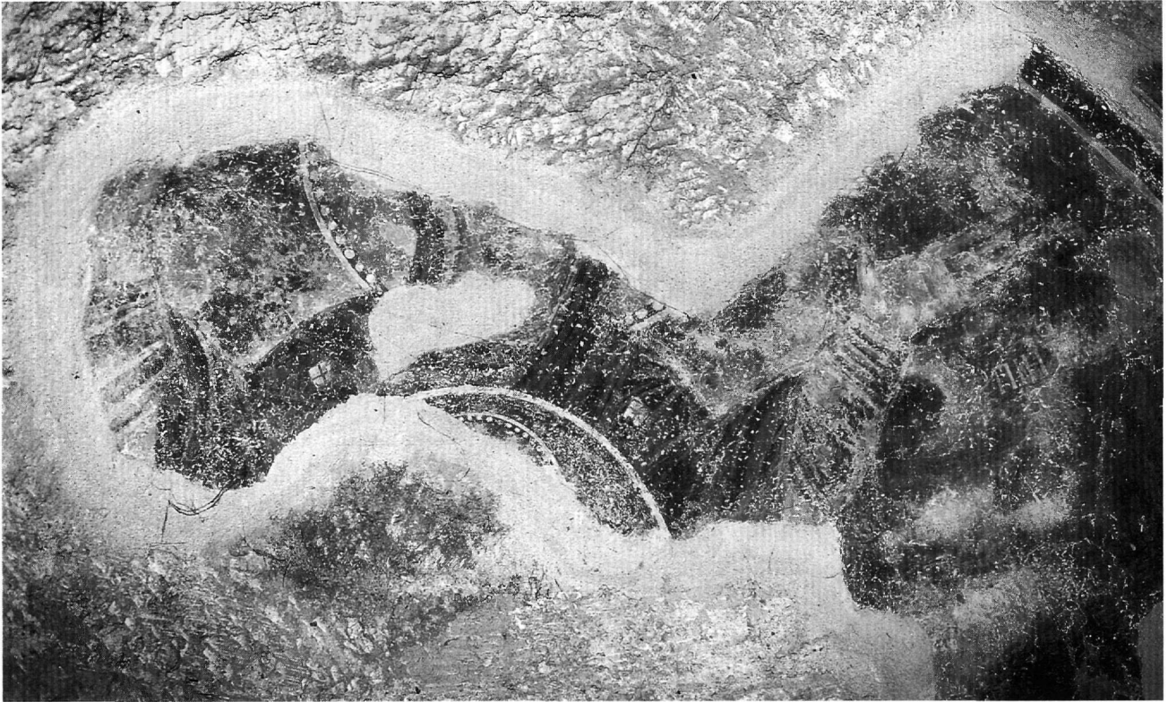
Εἰκ. 4. Sorocani, μονή Ἁγίας Τριάδας, παρεκκλήσιο Ἁγίου Στεφάνου. Παναγία ἢ «Ἀχειροποίητος».

τρεῖς τῆς Θεοτόκου καί τοῦ ἁγίου Δημητρίου ἀποτελοῦσε ἐπιβίωση μιᾶς παράδοσης πού ὑφίστατο στούς δύο σημαντικούς ναοούς τῆς Θεσσαλονίκης, Ἅγιο Δημήτριο καί μεγάλο ναό τῆς Θεοτόκου 29 . Ὁ ναός τῆς Θεοτόκου Καταφυγῆς ταυτίστηκε μέ τό μεγάλο κτίσμα πού βρισκόταν κάτω καί βόρεια τοῦ ναοῦ τοῦ Ἁγίου Νικολάου Τρανοῦ, στήν ἀνατολική πλευρά τῆς ἀρχαίας Ἄγορᾶς 30 .