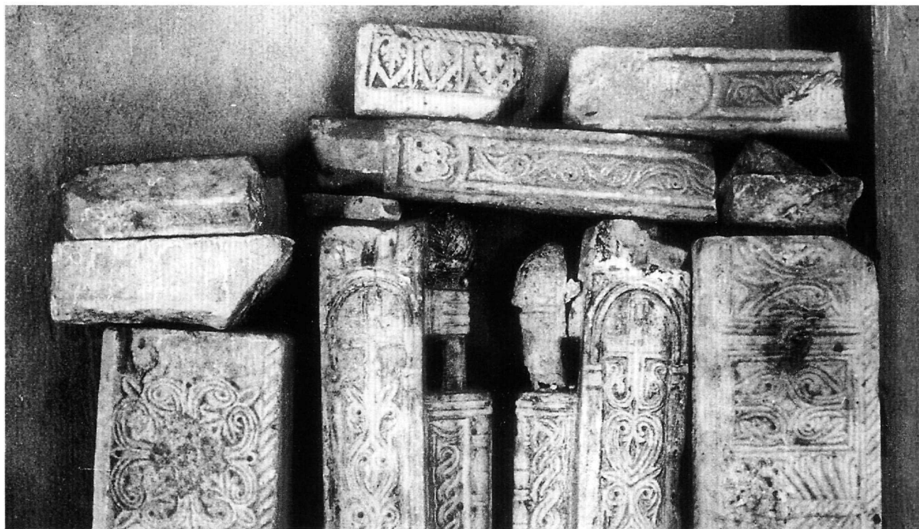
Εικ. 3. Φωτογραφία των μελών του τέμπλου, όπου διακρίνονται τα θραύσματα που δεν σώζονται πλέον.

βόρειο πεσσό, ενώ το αντίστοιχο του νότιου έφερε κατά τον Ορλάνδο βότρυν σταφυλής. Στο πίσω μέρος των σταθμών των βημοθύρων σώζονται εγχοπές για την υποδοχή της θύρας. Οι κιονίσκοι εκατέρωθεν της κεντρικής πύλης είχαν διατομή επιμηκυσμένου οκταγώνου, στην κύρια πλευρά του οποίου διαμορφώνεται δέση τεσσάρων κιονίσκων. Παρόμοιες διατάξεις είναι συνήθεις από το 12ο αιώνα και εξής. Στο μέσον του ύψους του κιονίσκου σχηματιζόταν κατά κανόνα κόμβος σε μορφή ηράκλειου δεσμού 4 , όπως ασφαλώς θα συνέβαινε και εδώ. Ως αντίστοιχα παραδείγματα μπορούν να αναφερθούν ενδεικτικά το τέμπλο της μονής Βλαχέρνας στην Άρτα 5 ,