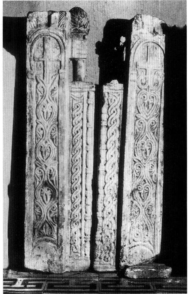
Εικ. 2. Οι πεσίσκοι που τοποθετούνται εκατέρωθεν της Ωραίας Πύλης.

Αν και δεν σώζεται ο αρχικός στυλοβάτης, από την ύπαρξη επιμέρους επιστυλίων εύκολα προκύπτει ότι η διάταξη του τέμπλου ήταν τριμερής, κατ' αντιστοιχίαν προς τα ανοίγματα του ιερού Βήματος. Τα δύο μέλη, των οποίων η ταύτιση είναι σαφέστατη, είναι οι δύο πεσίσκοι που τοποθετούνται εκατέρωθεν της Ωραίας Πύλης (Εικ. 2). Σώζονται σχεδόν ακέραιοι, εκτός από τους συμφυείς κιονίσκους που έφεραν, των οποίων είναι ορατή μόνον η γένεση. Έχουν πλάτος 0,16 μ. περίπου και ύψος 0,96 μ., ο δε διάκοσμός τους περιλαμβάνει στο ανώτερο μέρος το σύνθημα του σταυρού κάτω από τόξο, που στον μεν βόρειο συνδυάζεται με τα αρχι-