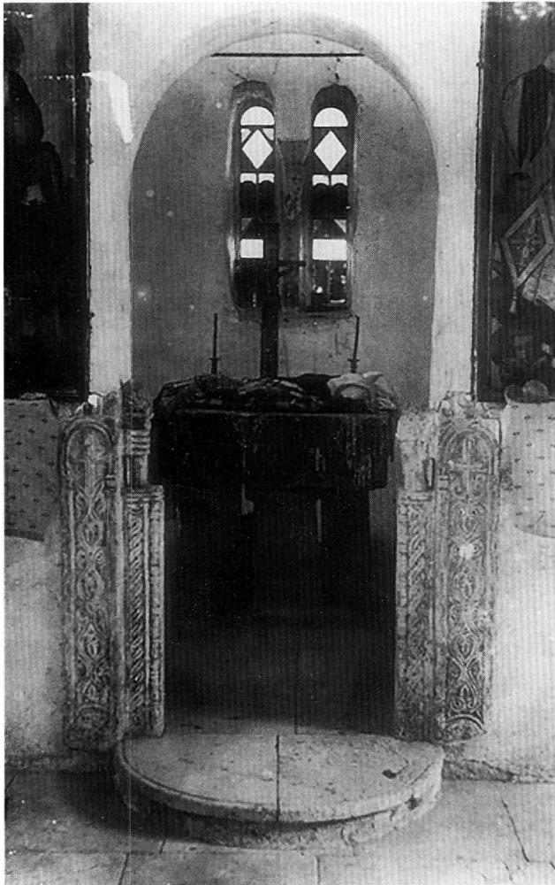
Εικ. 1. Άμφισσα, ναός Μεταμορφώσεως. Η Ωραία Πύλη με τους κατά χώραν σωζόμενους πεσίσκους.