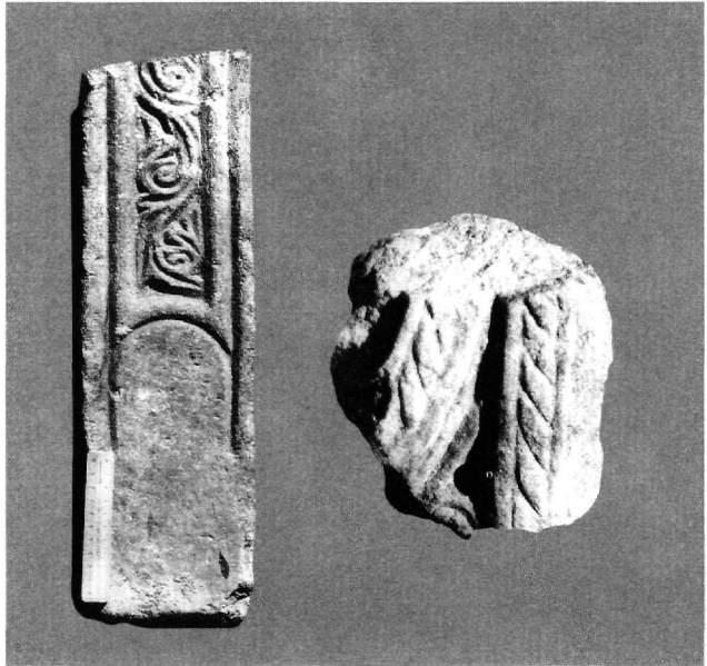
Εικ. 5. Θραύσμα από πεσσίσκο της πρόθεσης ή του διακονικού (Αρχείο Ε.Μ.Π. 1970) και θραύσμα θωρακίου.

Τα θωράκια δεν σώθηκαν, βρέθηκε μόνο ένα πολύ μικρό θραύσμα πλάκας, πάχ. 0,04 μ., με κατεργασία αντίστοιχη αυτής του τέμπλου (διακρίνονται δύο σχοινία –ένα κατακόρυφο και η γένεση ενός τοξωτού–, καθώς και οπή από τρυπάνι στην ένωσή τους), που θα μπο-