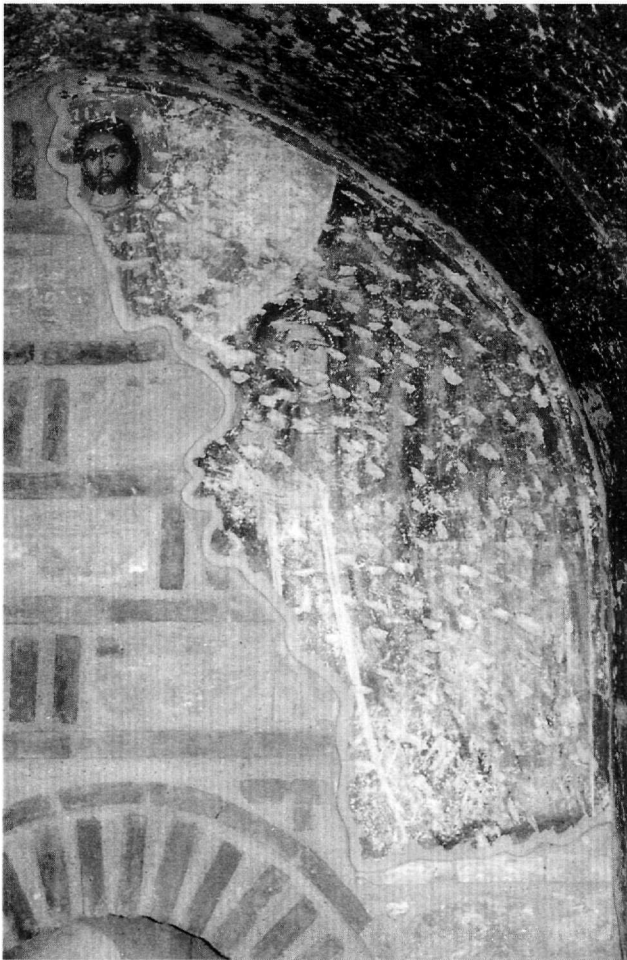
Εικ. 1. Ομορφοκκλησιά. Ναός Αγίου Γεωργίου. Η κτητορική παράσταση.

κή (Εικ. 3). Πάνω στον προπλασμό από βαθύχρωμη ώχρα τοποθετούνται πράσινες και καστανοπράσινες σκιές, που είναι ιδιαίτερα έντονες γύρω από τα βλέφαρα, και λίγες ρόδινες κηλίδες στις παρειές και στο μέτωπο. Με καστανόμαυρη διαγράμμιση περιγράφονται τα χαρακτηριστικά του προσώπου. Η κόμη, η γενειάδα και το μουστάκι είναι καστανοκόκκινα. Το κεφάλι στηρίζεται σε στιβαρό κωδωνόσχημο λαϊμό που φέρει γραμμισκιά στη βάση του. Ο Ιησούς φορεί ρόδινο χιτώνα και χρυσοκίτρινο ιμάτιο που κολπώνεται πλούσια. Σώζεται το αριστερό χέρι του που ευλογεί σε έκταση, αλλά την ίδια κίνηση πρέπει να έκανε και με το δεξί, που θα το έτεινε προς την πάριση μορφή στα δεξιά του.