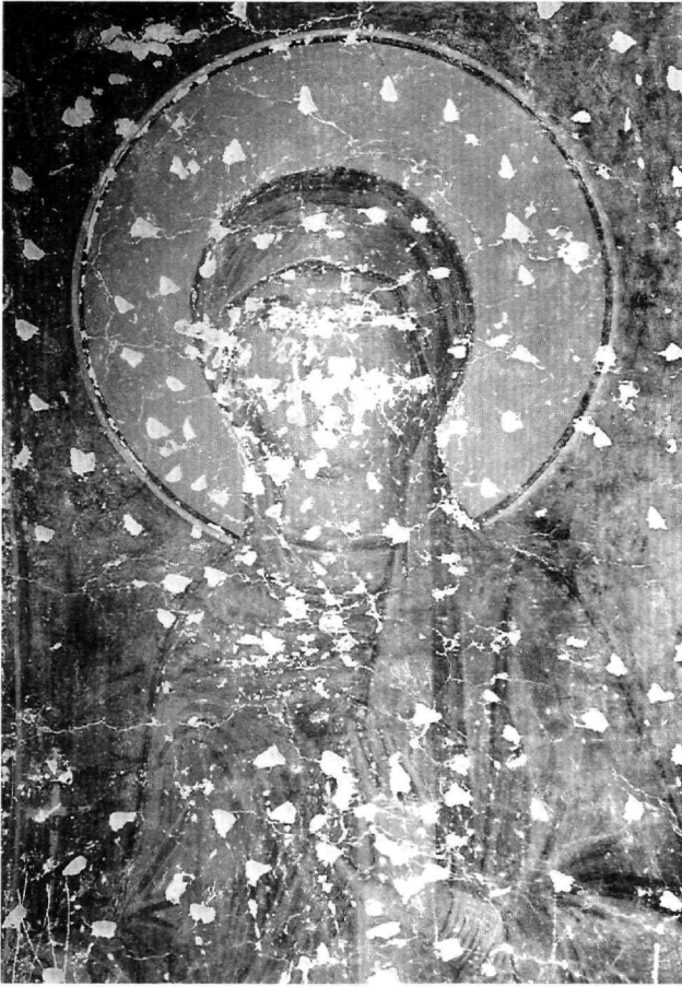
Εικ. 4. Η αγία Μητροδώρα (λεπτομέρεια).

(Εικ. 4) και Νυμφοδώρα (Εικ. 5), στους αγίους Σέργιο (Εικ. 6) και Βάγκχο και στους μοναχούς αγίους το πρόσωπο πλάθεται με βαθύχρωμη όχρα, ανοιχτοπράσινες και καστανοκόκκινες σκιές, ρόδινες κηλίδες και λεπτό μαύρο περίγραμμα. Μικρές, άτακτες, λευκές πινελιές φωτίζουν την επιφάνεια του προπλασμού. Τα χαρακτηριστικά αποδίδονται λεπτά και καλλιγραφημένα. Το βλέμμα είναι έντονο με μαύρη κηλίδα, η μύτη λεπτή και μακριά και το στόμα μικρό, σαρκώδες και ρόδινο, τα ζυγωματικά τονισμένα και το πηγούνι οξύληκτο. Ο κυλινδρικός λαιμός φέρει τη χαρακτηριστική γραμμή-