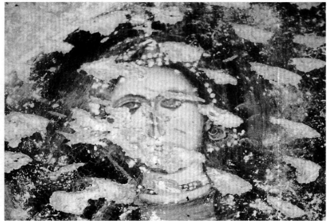
Εικ. 2. Η κτητόρισα (λεπτομέρεια).

Και οι δύο μορφές έχουν μικρό κεφάλι, ραδινό σώμα, χαμηλούς ώμους, επιπεδότητα και περιορισμένη σωματικότητα, αλλά εκφραστικές χειρονομίες και κίνηση. Ο