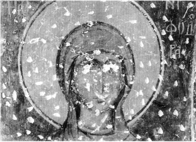
Εικ. 5. Η αγία Νυμφοδώρα (λεπτομέρεια).

σταση της κτητόρισσας και των αγίων μορφών υπάρχει διαφορά, ώστε να διαπιστώσουμε αναμνήσεις ακαδημαϊσμού στην κοσμική μορφή και τάσεις απόδοσης της ιδεατής ομορφιάς, έναντι των ρεαλιστικότερων αντικλασικών στοιχείων στα άγια πρόσωπα. Η καλλιγραφία και η συμμετρία των χαρακτηριστικών της παραπέμπουν στην ανάγλυφη εικόνα του αγίου Δημητρίου που προέρχεται από το παλαιότερο τέμπλο του ναού της Ομορφοκκλησίας και χρονολογείται περίπου στο τέλος του 14ου αιώνα 26 (Εικ. 7).