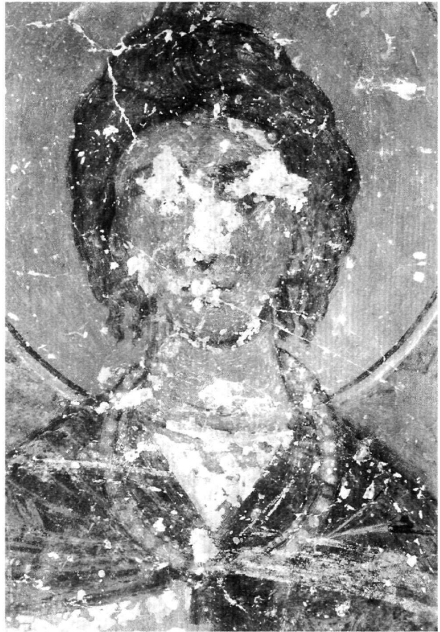
Εικ. 6. Ο άγιος Σέργιος (λεπτομέρεια).

Με βάση τα παραπάνω πιστεύουμε ότι οι εξωτερικές τοιχογραφίες του Αγίου Γεωργίου χρονολογούνται στο διάστημα 1365-1385. Πρόκειται για ένα ακόμη παράδειγμα που ανήκει στην αντικλασική τέχνη της λεγόμε-