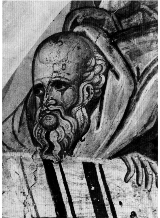
Εικ. 3. Η Κοίμηση της Θεοτόκου. Ο άγιος Ιωάννης ο Θεολόγος. Λεπτομέρεια.