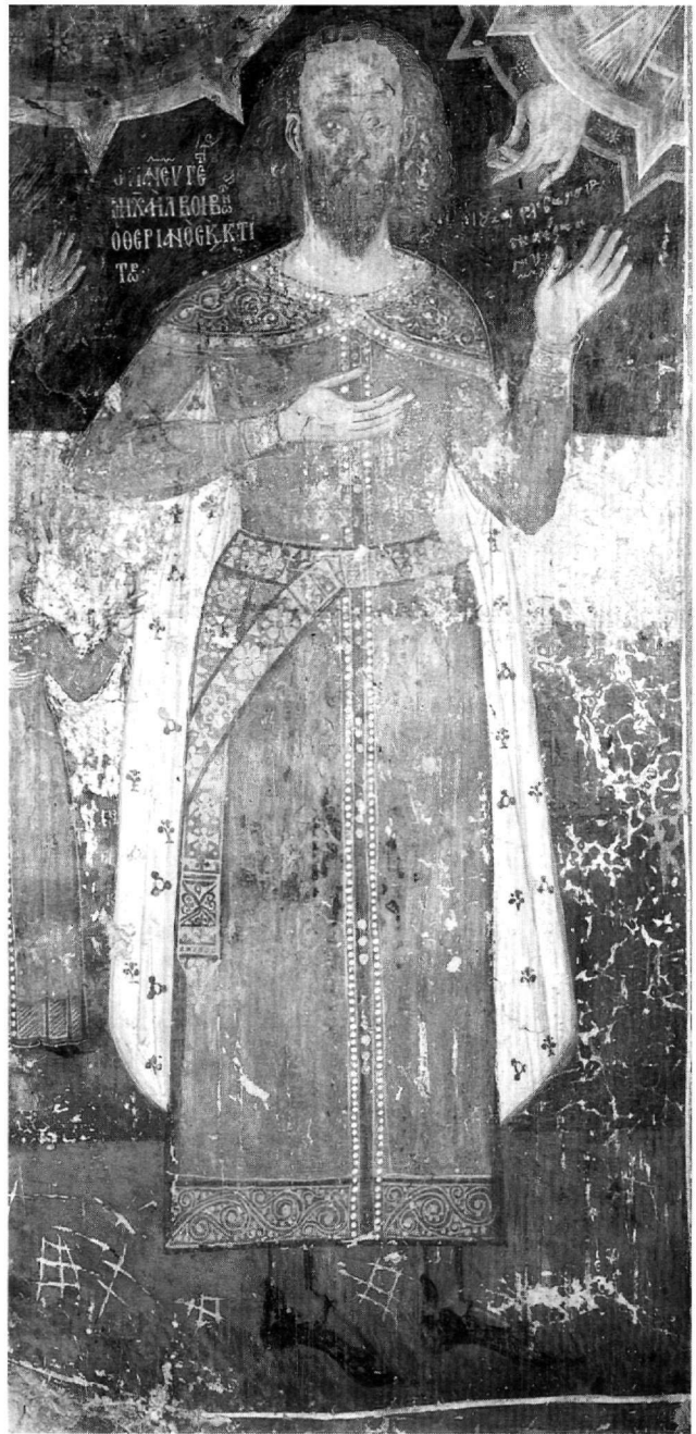
Εικ. 5. Ο βοεβόδας Μιχαήλ Θεριανός.

Στην τοιχογραφία της μονής του Βίκου, ο Μιχαήλ Θεριανός και οι οικείοι του εικονίζονται «ἔμορφα φορεμένοι», όπως θα ἔλεγε ο σύγχρονος στιχουργός του Χρονικού των Τόκκων 32 με ρούχα ακριβά και καλά, τα ἀλλάξιμα των Βυζαντινῶν 33 , προορισμένα για τις εορτές και επίσημες, όπως αυτή, περιστάσεις. Η φορεσιά του Μιχαήλ (Εικ. 5) αποτελείται από μακρὺ χειριδωτὸ φόρεμα, καμίσιον , με διακριτικὴ της θέσης του ζώνη και μανδύα 34 . Το φόρεμα, σε φωτεινὸ κόκκινο χρώμα, κοσμούν δύο σειρές μαργαριτάρια κατά μήκος στο μέσον όπου κλείνει με χρυσὰ στρογγυλά κομβία ἀνά τρία, επιρράμματα στα χέρια ψηλά 35 , σφιχτὰ χρυσοῦνημα επιμανίκια και καστανὴ παρυφή κάτω, χρυσοκέντητη με λεπτὸς ελικοειδείς βλαστὸς, ὅπως τα περικάρπια 36 . Φθάνοντας λίγο ἐπάνω ἀπὸ τα σφυρά, ἀφήνει να φαίνονται οι φαιές κάλτσες και τα μαύρα, χαμηλά και μακρυμύτικα υποδήματα 37 . Η ζώνη εἶναι γαλάζια με χρυσὰ ἀνθίνα σχέδια, κομρὰ φορεμένη χαμηλά στη μέση, με τακτοποιημένες ἀριστερά τις μακριές ἀκρες σε τρίγωνο 38 . Ο πολυτελής μανδύας, κοντύτερος ἀπὸ το καμίσιο και με στρογγυλεμένα ἀκρὰ, εἶναι καστανὸς χρυ-