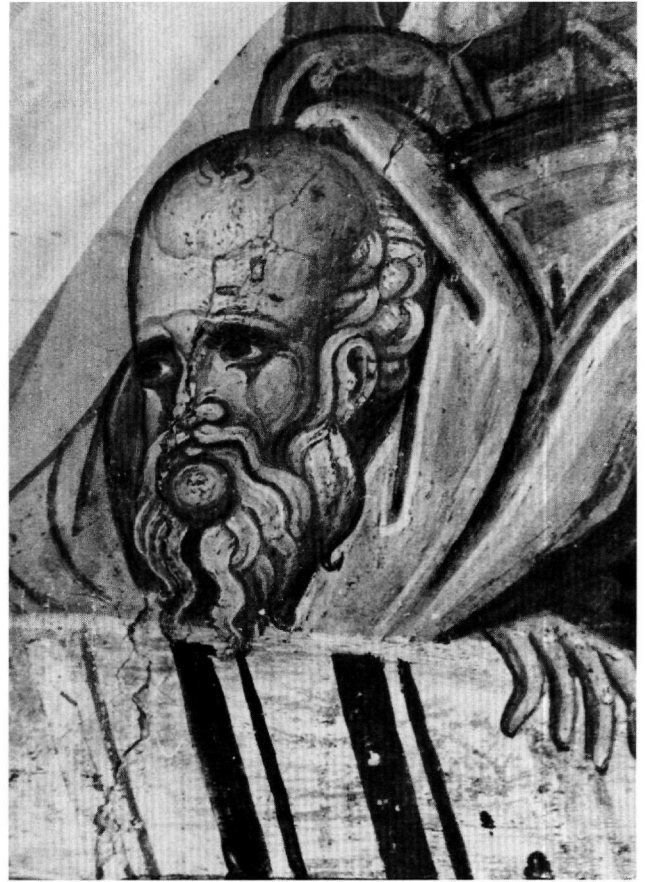
Εικ. 3. Η Κοίμηση της Θεοτόκου. Ο άγιος Ιωάννης ο Θεολόγος. Λεπτομέρεια.