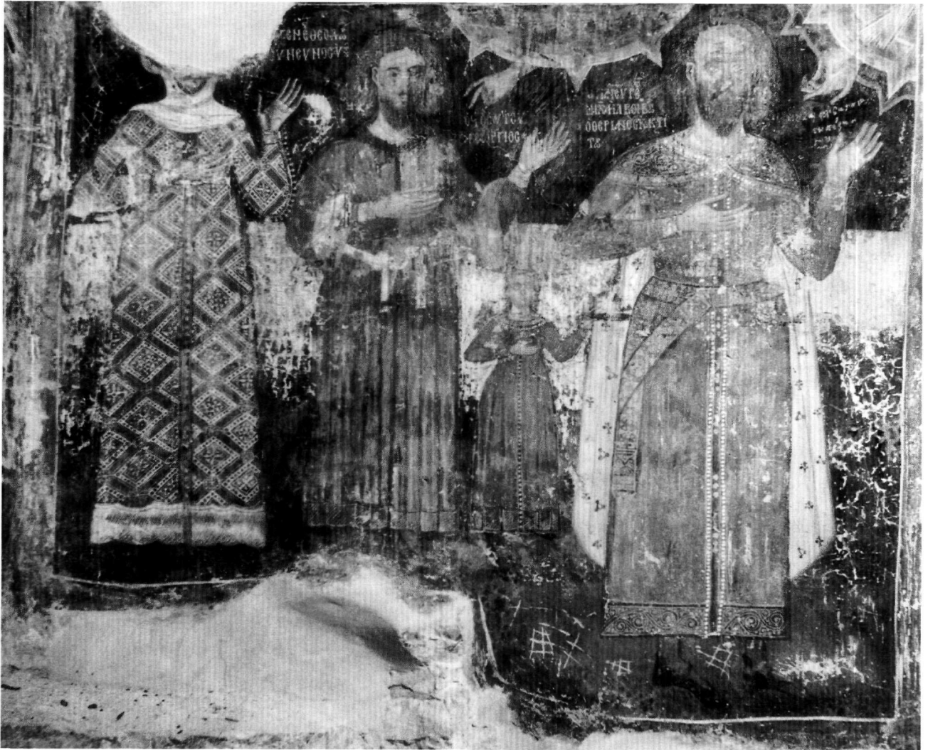
Εικ. 1. Η κτιτορική παράσταση.

διάνοιξη παραθύρων, οι αρχικές τοιχογραφίες διατηρούνται στις άλλες επιφάνειες και είναι οργανωμένες σε δύο επάλληλες ζώνες 6 . Στην αψίδα του Ιερού εικονίζεται η Θεοτόκος με την επωνυμία «Ἡ Μεγάλη Παναγία», και κάτω συλλειτουργούντες οι άγιοι Ιωάννης ο Χρυσό-