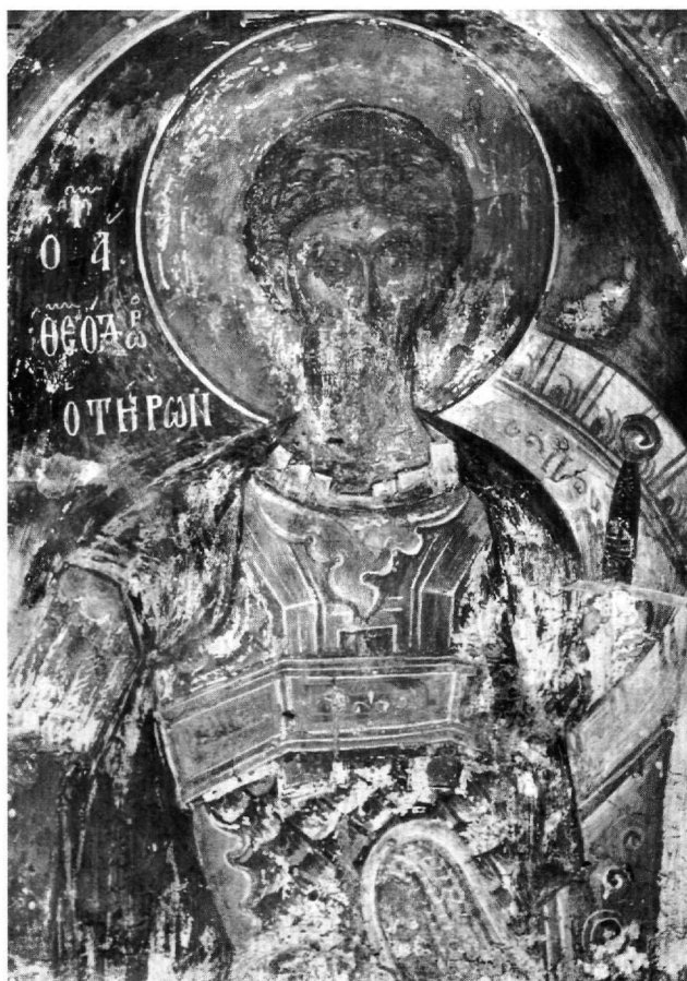
Εικ. 4. Ο άγιος Θεόδωρος ο Τήρων. Λεπτομέρεια.

Ο τίτλος του «εὐγενεστάτου» και του «πανευγενεστάτου», με άλλους τρέχοντες στο Βυζάντιο τιμητικούς τίτλους που ήταν όμοια σε χρήση για εξέχοντα πρόσωπα στο ανεξάρτητο «δυσμικό» κράτος από το 13ο αιώνα, το καλούμενο αργότερα δεσποτάτο 19 , είναι χαρακτηριστικοί για τη δομή της κοινωνίας στην Ήπειρο που ήταν, όπως έχει παρατηρηθεί, τυπικά βυζαντινή 20 . Ο τίτλος του «πανευγενεστάτου», που απαντάται συχνότερα σε ηπειρωτικά κείμενα αυτών των χρόνων, συνοδεύει μέλη της οικογένειας των δεσποτών, κάποτε τον ίδιο το δεσπότη, και αξιωματούχους με υψηλή θέση