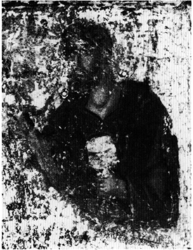
Εικ. 3. Ο Χριστός, λεπτομέρεια της Εικ. 1.

Όπως στην περίπτωση των τεσσάρων μεταβυζαντινών εικόνων, δεν χωρεί αμφιβολία ότι και η παλαιότερη του αποστόλου Ιακώβου φιλοκαλήθηκε με την πνευματική καθοδήγηση και επιθυμία των πατρίων μοναχών είτε ευπαιδευτου αφιερωτή, ο οποίος θέλησε να έχει το ευλαβικό δώρημα προσήκουσα της μονής εικονογραφία. Το δείχνουν η ποιότητα, το βάθος και η λεπτότητα των θεολογικών στοχασμών που επενδύθηκαν στη λιτή και εξαιρετικής τέχνης παράσταση του αδελφού του Ιωάν-