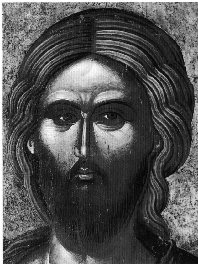
Εικ. 5. Βυζαντινό Μουσείο Καστοριάς. Εικόνα του Χριστού Παντοκράτορος από τον ναό του Αγίου Νικολάου Κυριτζή. Λεπτομέρεια.

Βυζαντινού Πολιτισμού της Θεσσαλονίκης 26 , στον Χριστό από την τοιχογραφία της Δεήσεως στον Άγιο Γεώργιο του Βουνού στην Καστοριά (γύρω στο 1385) 27 κ.α. Τέλος, η απόδοση της πτυχολογίας, με τα γεωμετρικά, κοφτά, φωτεινά επίπεδα σε δύο τόνους του αυτού χρώματος, απαντά σε έργα του δεύτερου μισού του 14ου αιώνα, όπως είναι η εικόνα του Χριστού Παντοκράτορος «Σοφία Θεού» 28 , ο Χριστός της Δεήσεως στο ναό του Αγίου Γεωργίου του Βουνού 29 και στην εικόνα του Χριστού Παντοκράτορος στο Βυζαντινό Μουσείο της Βέροιας (αρχές 15ου αι.) 30 .