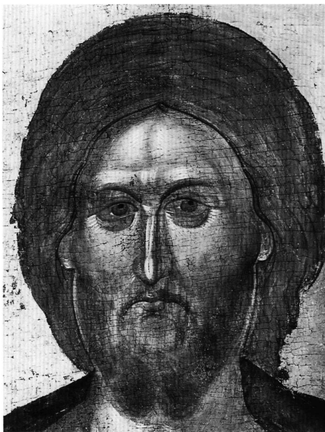
Εικ. 4. Άγιον Όρος, μονή Βατοπαιδίου. Εικόνα του Χριστού Παντοκράτορος. Λεπτομέρεια.