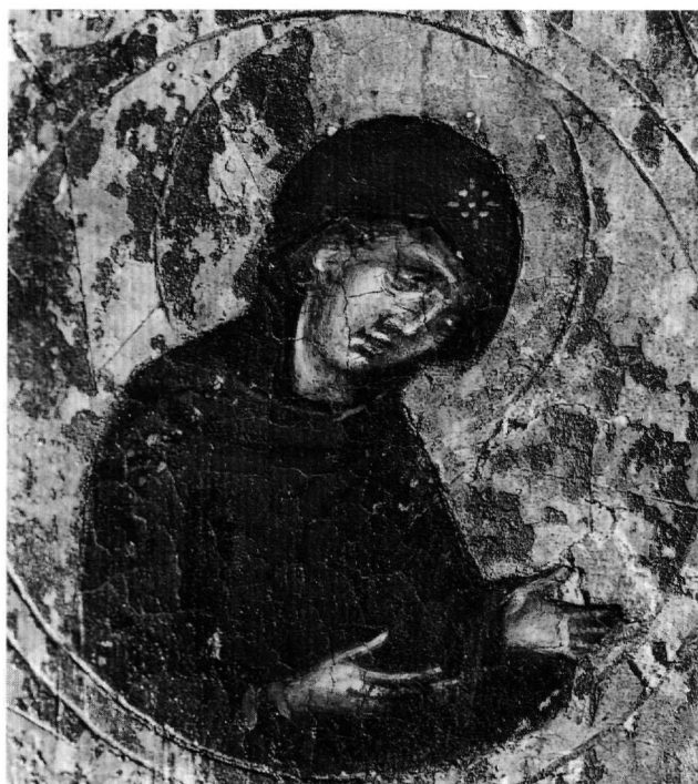
Εικ. 2. Η Παναγία, λεπτομέρεια της εικόνας του Χριστού Παντοκράτορος (βλ. Εικ. 1).