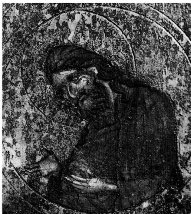
Εικ. 3. Ο άγιος Ιωάννης ο Πρόδρομος, λεπτομέρεια της εικόνας του Χριστού Παντοκράτορος (βλ. Εικ. 1).

ρεια κορυφαίων έργων εργαστηρίων της Πρωτεύουσας, όπως ο Χριστός Παντοκράτωρ της Μυτιλήνης και ο Χριστός Παντοκράτωρ στη μονή Παντοκράτορος του Αγίου Όρους, σήμερα στο Μουσείο Hermitage της Πετρούπολης 19 . Αμεσότερα σχετίζεται με εικόνες του δεύτερου μισού του 14ου αιώνα, όπως είναι η εικόνα του Χριστού Παντοκράτορος στη Βέροια 20 , η εικόνα του Χριστού Παντοκράτορος (Εικ. 4) στη μονή Βατοπαιδίου 21 , η εικόνα «Σοφία Θεού» στο Μουσείο Βυζαντινού Πολιτισμού της Θεσσαλονίκης 22 και μάλιστα η εικόνα του Χριστού Παντοκράτορος στο Βυζαντινό Μουσείο της Καστοριάς (Εικ. 5), που προέρχεται από το ναό του Αγίου Νικολάου Κυρίτζη 23 . Μάλιστα, η τεχνική απόδοσης του προσώπου με τα γραμμικά φώτα τα οποία