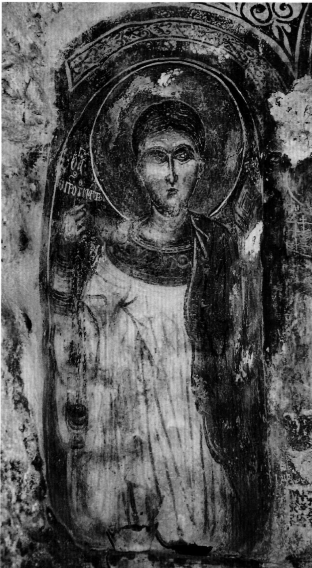
Abb. 5. Trstenik, Erzengelgrotte, Prothesisnische. Heiliger Stephanos.

in denen der halbfigurige Christus vor dem Oberkörper der Gottesmutter erscheint. Ein frühes Beispiel einer Maria