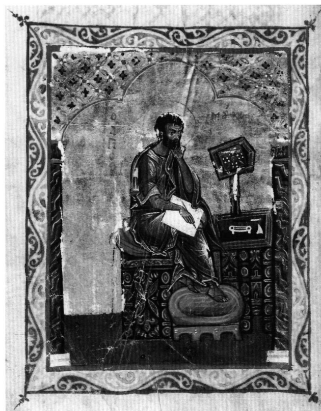
Fig. 3. Évangéliste Marc (fol. 95v).

rent au ministère du Christ et onze évoquent les épisodes de la vie de Jean-Baptiste. En outre, la sélection des passages évangéliques favorise considérablement l'illustration des miracles ; on compte 18 miracles, dont douze seulement ont pu être exécutés comme par exemple la Multiplication des pains au fol. 42v et le Christ marchant sur l'eau au fol. 116r (Fig. 6 et 7). Il est à signaler également la représentation de quatre paraboles, la Parabole du festin nuptial au fol. 66v, celle des dix Vierges au fol. 76v (Fig. 8), la Parabole des vignerons homicides au fol. 136r et celle du figuier stérile au fol. 211v, toutes quatre choisies certainement pour leur message faisant allusion au Jugement Dernier.