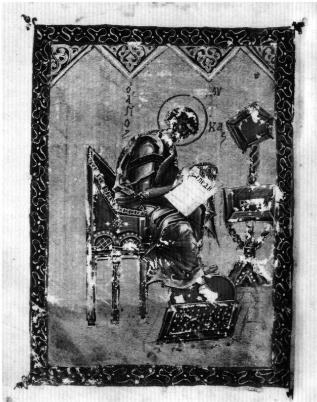
Fig. 15. Par. gr. 51. Évangéliste Luc (fol. 116v).