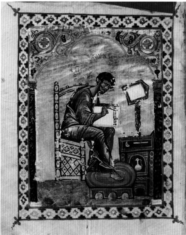
Fig. 4. Évangéliste Luc (fol. 156v).

vangiles à cycle étendu on en compte seulement trois: le Vienne théol. gr. 154 10 , daté du XI e siècle, compte une seule représentation de parabole, celle du Pharisien et du Publicain au fol. 193r, alors que dans le Mont Athos Iviron 5 11 , daté du XIII e siècle, trois paraboles ont été retenues, à savoir, dans l'évangile de Matthieu, la Parabole du festin nuptial au fol. 94v et, dans l'évangile de Luc, Le mauvais riche et le pauvre