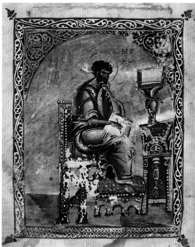
Fig. 14. Par. gr. 51. Évangéliste Marc (fol. 70v).

elles sont rares. Il s'agit surtout des scènes de martyre qui ne donnent pas l'impression d'être tirées d'un cycle mais plutôt utilisées « just because there was extra space at hand. » 32 . Concernant le cycle de Jean-Baptiste dans les ménologes, les scènes illustrées représentent l'Annonce à Zacharie, sa Naissance, son Exécution et l'Invention de sa Tête, célébrée le 24 février, alors que l'iconographie adoptée reprend les modèles existants déjà sur d'autres supports.