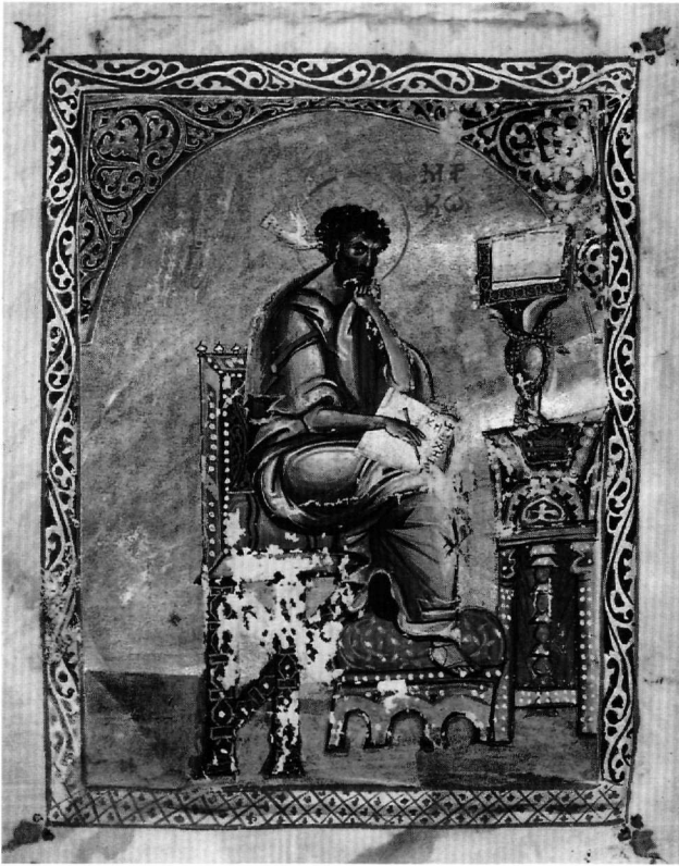
Fig. 14. Par. gr. 51. Évangéliste Marc (fol. 70v).

elles sont rares. Il s'agit surtout des scènes de martyre qui ne donnent pas l'impression d'être tirées d'un cycle mais plutôt utilisées « juste because there was extra space at hand. » 32 . Concernant le cycle de Jean-Baptiste dans les ménologes, les scènes illustrées représentent l'Annonce à Zacharie, sa Naissance, son Exécution et l'Invention de sa Tête, célébrée le 24 février, alors que l'iconographie adoptée reprend les modèles existants déjà sur d'autres supports.