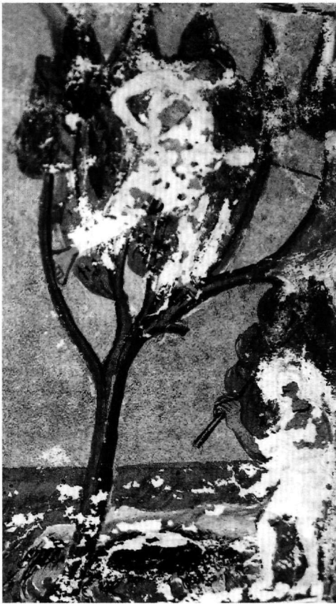
Abb. 4. Tbilisi, Handschriften-Institut, cod. H 1667, fol. 172r (Detail).

Die Darstellung der Arbeit des verlorenen Sohnes als Schweinehirt ist nach den erhaltenen Bildbeispielen in der byzantinischen Malerei selten anzutreffen 25 , anders als in der abendländischen mittelalterlichen Kunst 26 . Ihre Einbindung in den fünf hier besprochenen Handschriften kann dadurch erklärt werden, dass sowohl der Codex Par. gr. 74 wie auch der Theodor-Psalter ungefähr zur gleichen Zeit im Studios-Kloster gefertigt wurden 27 . Das Evangeliar des Za-