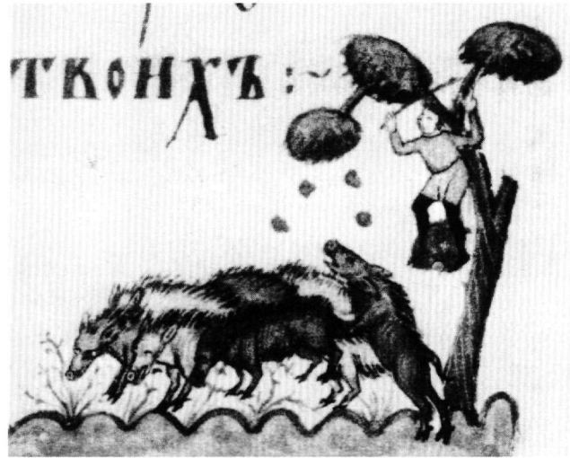
Abb. 5. London, British Library, cod. Add. 39.627, fol. 185r (Detail).

ren Ivan Alexander kopiert den Pariser-Codex oder lehnt sich an denselben Prototyp an, während die Malereien des georgischen Manuskripts auf das griechische Evangeliar zurückgehen 28 . Es ist darüber hinaus höchst wahrscheinlich, dass die Miniaturen im Kiew-Psalter auf einem Prototyp basieren, der ebenfalls im 11. Jh. im Studios-Kloster illuminiert worden sein muss 29 .