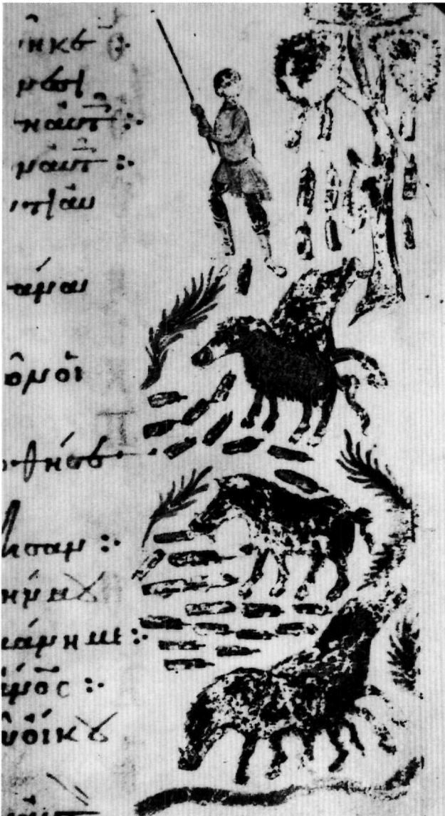
Abb. 1. London, British Museum, cod. Add. 19.352, fol. 61r.