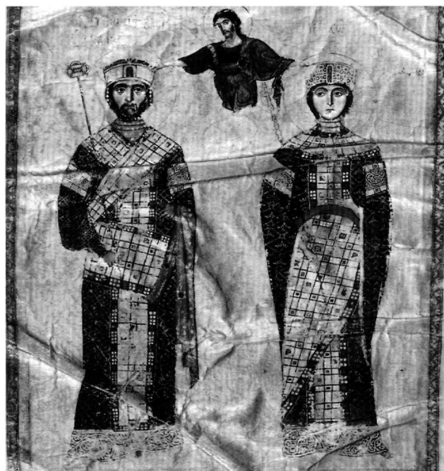
Εικ. 6. Μικρογραφία με την παράσταση της στέψης-ευλογίας του Μιχαήλ Ζ Δούκα και της Μαρίας της Αλανίας. Κώδικας Coislin 79, φ. 1v (1077-1078). Παρίσι, Εθνική Βιβλιοθήκη.

αντίστοιχα επιγράμματα που τις συνοδεύουν. Η στέψη του παραπάνω αυτοκρατορικού ζεύγους εικονίζεται σε ένα πλακίδιο από σμάλτο (διαστ. 7,4×7,2 εκ.), το οποίο έχει συμπεριληφθεί στη διακόσμηση του τριπτύχου του Khakhuli και στη μικρογραφία του φ. 1v του κώδικα Coislin 79, ο οποίος, όπως έχει ήδη αναφερθεί, γράφτηκε και διακοσμήθηκε με αρχικό προορισμό να δοθεί ως δώρο στον Μιχαήλ.