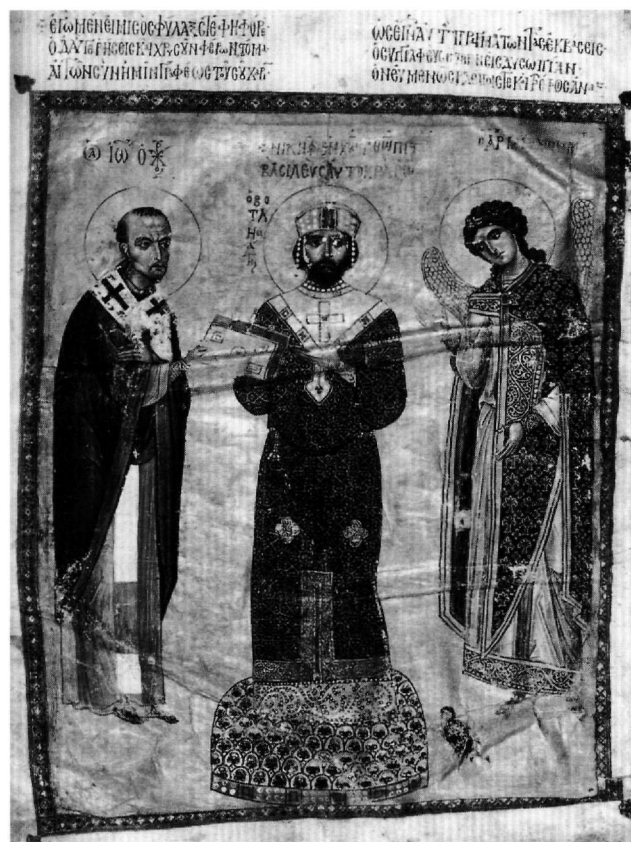
Εικ. 3. Μικρογραφία με τον Μιχαήλ Ζ' Δούκα, τον αρχάγγελο Μιχαήλ και τον Ιωάννη τον Χρυσόστομο. Κώδικας Coislin 79, φ. 2ν (1077-1078). Παρίσι, Εθνική Βιβλιοθήκη.

Στη μικρογραφία στο φ. 2ν του χρυσοστομικού κώδικα