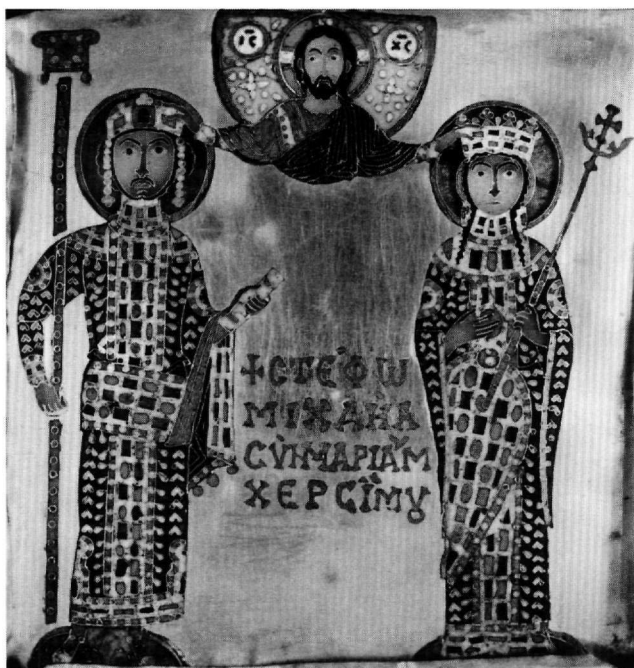
Εικ. 5. Πλακίδιο από σμάλτο με τη στέψη του Μιχαήλ Ζ Δούκα και της Μαρίας της Αλανίας (1071-1078). Τρίπτυχο του Khakhuli, Τιφλίδα, Κρατικό Μουσείο Καλών Τεχνών.

αντίστοιχα επιγράμματα που τις συνοδεύουν. Η στέψη του παραπάνω αυτοκρατορικού ζεύγους εικονίζεται σε ένα πλακίδιο από σμάλτο (διαστ. 7,4×7,2 εκ.), το οποίο έχει συμπεριληφθεί στη διακόσμηση του τριπτύχου του Khakhuli και στη μικρογραφία του φ. 1ν του κώδικα Coislin 79, ο οποίος, όπως έχει ήδη αναφερθεί, γράφτηκε και διακοσμήθηκε με αρχικό προορισμό να δοθεί ως δώρο στον Μιχαήλ.