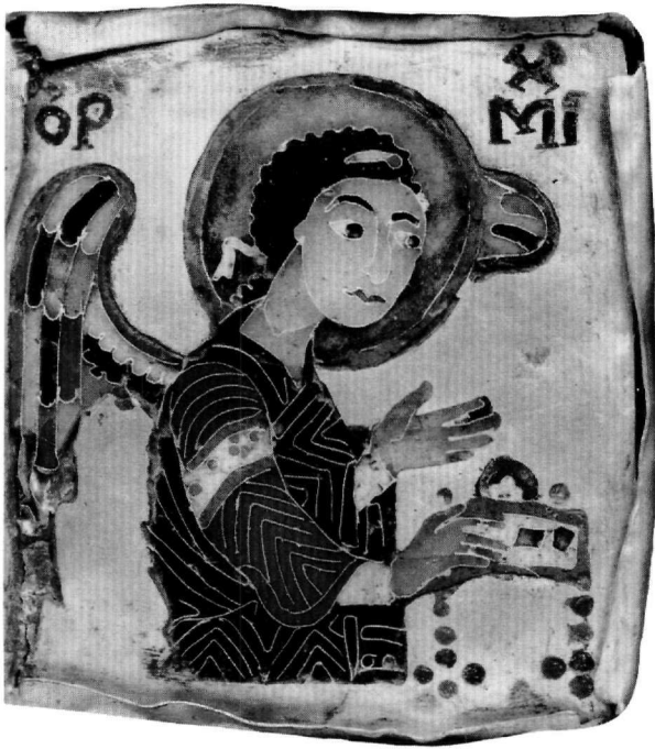
Εικ. 4. Πλακίδιο από σμάλτο με τη μορφή του αρχαγγέλου Μιχαήλ (1071-1078). Τρίπτυχο του Khakhuli, Τιφλίδα, Κρατικό Μουσείο Καλών Τεχνών.

καθαίρεσή του δόθηκε στον επόμενο αυτοκράτορα Νικηφόρο Βοτανειάτη. Οι τέσσερις μικρογραφίες του χειρογράφου με τη μορφή του προηγούμενου αυτοκράτορα δεν αντικαταστάθηκαν. Κρίθηκε αρκετό να αλλάχουν οι επιγραφές και να αλλοιωθούν τα χαρακτηριστικά του προσώπου του Μιχαήλ Δούκα, για να μεταμορφωθεί σε Νικηφόρο Βοτανειάτη 38 , με αποτέλεσμα, εκτός των άλλων, ο αρχάγγελος Μιχαήλ να φέρεται πλέον στη μικρογραφία ως φύλακας και προστάτης του νέου αυτοκράτορα. Αξίζει να σημειωθεί ότι ο σφετεριστής Βοτανειάτης κατά την πορεία του προς την Κωνσταντινούπολη τον Μάρτιο του 1078, με σκοπό την κα-