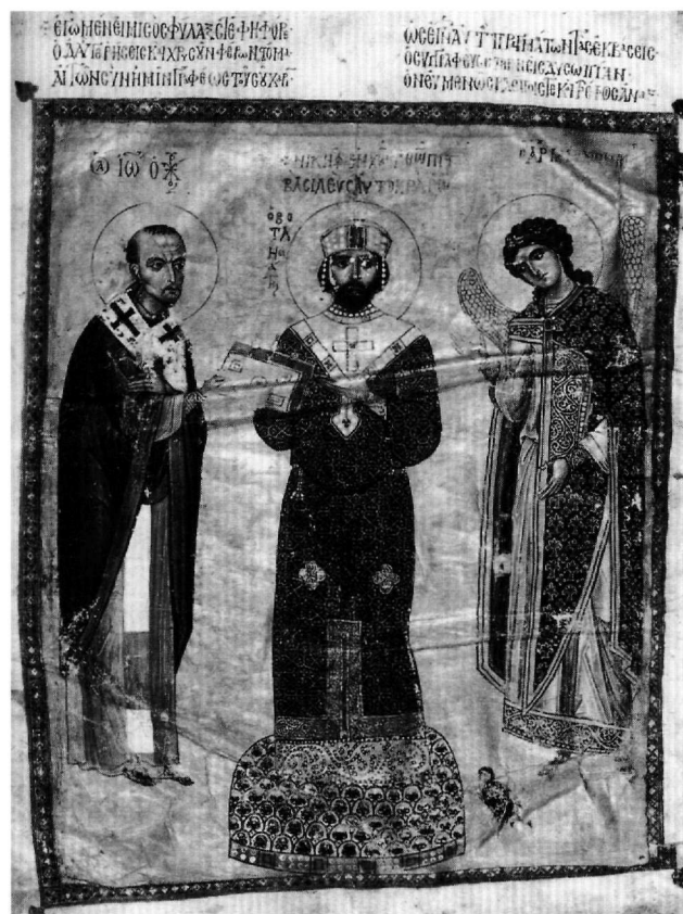
Εικ. 3. Μικρογραφία με τον Μιχαήλ Ζ' Δούκα, τον αρχάγγελο Μιχαήλ και τον Ιωάννη τον Χρυσόστομο. Κώδικας Coislin 79, φ. 2ν (1077-1078). Παρίσι, Εθνική Βιβλιοθήκη.

Στη μικρογραφία στο φ. 2ν του χρυσοστομικού κώδικα