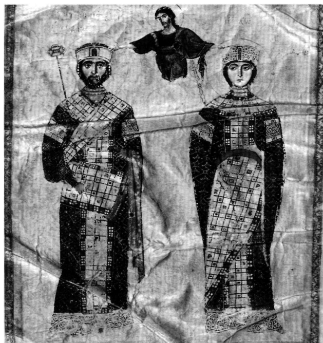
Εικ. 6. Μικρογραφία με την παράσταση της στέψης-ευλογίας του Μιχαήλ Ζ Δούκα και της Μαρίας της Αλανίας. Κώδικας Coislin 79, φ. 1ν (1077-1078). Παρίσι, Εθνική Βιβλιοθήκη.

κίδιο αυτό, μαζί με άλλα τέσσερα σμάλτα που έχουν επίσης τοποθετηθεί στο τρίπτυχο του Khakhuli, προέρχεται από ένα έργο τέχνης, πιθανότατα ένα στέμμα, που φιλοτεχνήθηκε στο διάστημα 1071-1078 και στάλθηκε ως δώρο στη Γεωργία, πατρίδα της Μαρίας 42 .