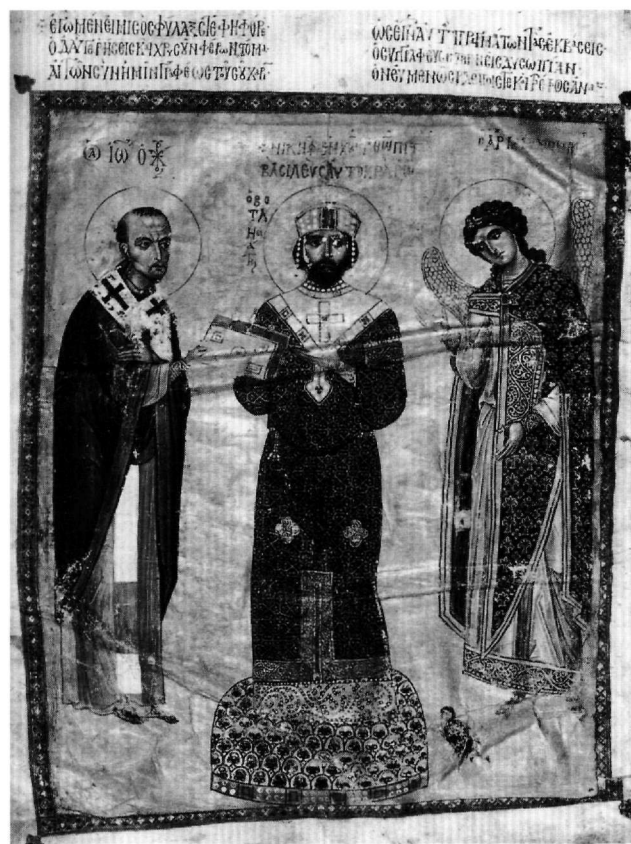
Εικ. 3. Μικρογραφία με τον Μιχαήλ Ζ' Δούκα, τον αρχάγγελο Μιχαήλ και τον Ιωάννη τον Χρυσόστομο. Κώδικας Coislin 79, φ. 2ν (1077-1078). Παρίσι, Εθνική Βιβλιοθήκη.

Στη μικρογραφία στο φ. 2ν του χρυσοστομικού κώδικα