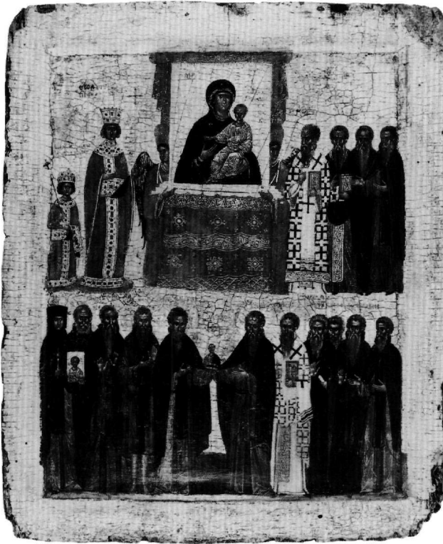
Εικ. 1. Ο Θριάμβος της Ορθοδοξίας. Λονδίνο, Βρετανικό Μουσείο.

Η ιδιαιτερότητα της εικόνας του Βρετανικού Μουσείου έγκειται στο ότι είναι το μοναδικό αμιγώς βυζαντινό έργο, το οποίο έχει ως θέμα την αποκατάσταση των εικόνων και την Κυριακή της Ορθοδοξίας (11 Μαρτίου 843) 4 . Η επιστημονική έρευνα, στην προσπάθειά της να αιτιολογήσει την τόσο όψιμη παρουσία του εικονογραφικού αυτού θέματος, έχει ήδη παρατηρήσει ότι κατά την υστεροβυζαντινή περίοδο είχε κάνει την εμφάνισή