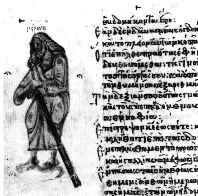
Εικ. 4. Μόσχα, Κρατικό Ιστορικό Μουσείο, έλλην. κώδικς 129Δ (ψαλτήριο Χλουντόφ, 9ος αι.), φ. 91β: ό γέρον των εβδομήντα/όγδόντα έτών (ψαλμός 89, 10).

Άπληξείται έδω ή γεροντική ήλικία τών 70 και 80 έτών πού μνημονεύει ως άκραίο όριο του βίου ό ψαλμός 89, 9-10: οτι πασαι αι ημέραι ημών εξέλιπον, και εν τή όργη σου εξελίπομεν· τά έτη ημών ως άράχνην έμελέτων. αι ημέραι τών έτών ημών, εν αυτοίς εβδομήκοντα έτη, εάν δε εν δυναστείαις, όγδοήκοντα έτη, και τό πλειον αυτών κόπος και πόνος. Άπέναντι σέ αυτό τό βιβλικό χωρίο στάθηκε ό ζωγράφος του 9ου αιώνα, στό φ. 91β του ψαλτηρίου Χλουντόφ. Πρόκειται γιά τή μόνη έκτός τίτλου εικαστική αντίδραση στό κείμενο του ψαλμού (Εικ. 4) 21 . Τόν τίτλο του ψαλμού: «Προσευχή του Μωυση άνθρώπου του θεου», στό φ. 90β, εικονογραφεί ή νεανική μορφή του προσπίπτοντος, γερμένου στό έδαφος Μωυση, ό όποιος στρέφεται, προσευχόμενος, προς τό έγγραφόμενο σέ δίσκο παιδικό πρόσωπο του προεικονιζόμενου, έδω, Θεου (του Ίησου) 22 . Παραπλεμπτικά σημεία συσχετίζουν τά εβδομήκοντα και όγδοήκοντα έτη (φ. 91β, άνω μέρος), μέ τήν παράπλευρη εικόνα ενός όρθιου, μακρομάλλη γέροντα, μέ θλιμμένη τήν όψη· σύννουσ, φορώντας μακρύ χιτώνα και στραμμένος κατά 3/4 προς τά έξω (άριστερά), έχει τοποθετήσει και τά δύο του χέρια επάνω σέ λοξά στηριγμένη στό έδαφος βαριά ράβδο. Η μικρογραφία φέρει τήν επιγραφή: ΓΕΡΩΝ. Άριστερά και δεξιά από τούς βραχιόνες του εικονιζόμενου προσώπου, και άλλο παραπλεμπτικό σημείο συσχετίζει και πάλι τή μορφή μέ τό στίχο