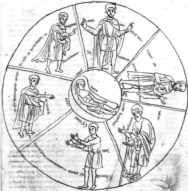
Εἰκ. 5. Παρίσι, Ἐθνική Βιβλιοθήκη τῆς Γαλλίας, λατιν. κώδιξ 3236A (ἀρχ. 13ος αἰ.), φ. 85: ὁ κύκλος τοῦ βίου, συνοδευόμενος ἀπό παράθεση τοῦ ψαλμοῦ 89, 9-10.

12ου αἰ.), φ. 167, συνδυάζονται στήν ἴδια παραστατική ζώνη ὁ προσευχόμενος Μωυσῆς (ἀριστερά) καί ὁ γέροντας τοῦ ψαλμοῦ (δεξιά): μέ κοντό χιτώνα, βαδίζει στηριζόμενος σέ ράβδο· ἡ ἐπιγραφή συσχετίζει τήν εἰκόνα μέ τά κόπος καί πόνος τοῦ στ. 10 24 .