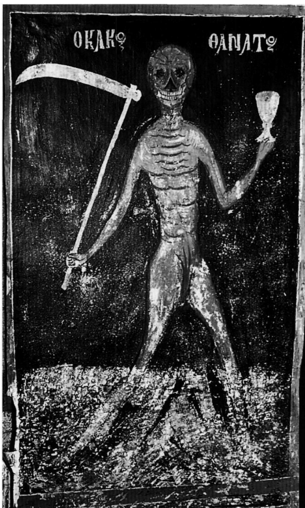
Εἰκ. 6. Λεύκη Καρδίτσας, ναός τοῦ Ἁγίου Γεωργίου: ὁ Θάνατος, μέ τό δρεπάνι καί τό πικρό ποτήριω (μ. 18ου αἰ.).

μονῆς Μουνδῶν τῆς Χίου, Χίος 2001, εἰκ. στή σ. 179 (συνολική ἀναπαράσταση). Π. Χαλκαῖ-Στεφάνου, Τά μοναστήρια τῆς Χίου , Ἀθήνα 2003, 158-159, 154 εἰκ. 51· βλ. καί 157-158, εἰκ. 52 (Δευτέρα Παρουσία). Πρβλ. Ἀντωνόπουλος, Τροχῶν κυλίσματα (ὑπόσημ. 4), σμ. 51.