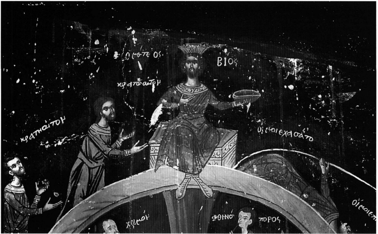
Εἰκ. 3. Λεπτομέρεια τῆς Εἰκ. 2: ἡ ἀκμή τῆς περιστροφῆς.

κιῶν, ἀπό σταθερή θέση (Εἰκ. 2 καί 3), χωρίς νά συμμετέχουν στό δρώμενο τῆς περιστροφῆς (κατοπτρίζουν, σέ αὐτές τίς περιπτώσεις, τόν ἀπώτερο στόχο τῶν ἀνερχομένων· ἀλλά καί τοὺς πικραίνουν –ὅπως «ὁ μάταιος Βίος», μέ τό ἐπιδεικτικά προβαλλόμενο «καυχή» στό ἀριστερό του χέρι (Εἰκ. 3)–, ὅταν ἐκεῖνοι χάσουν τήν ὑπατή θέση καί «πάρουν τόν κατήφορο»), καί ἄλλοτε ὑποδύμενα –προσωρινῶς– τήν πιά μεστή, τή βασιλική ἡλικία: ὅπως, δ.χ., ὁ σαραντάρης στόν Ἅγιο Νικόλαο τῆς Τσαριτσάνης (1753) 11 , τά κορυφαία πρόσωπα χα-