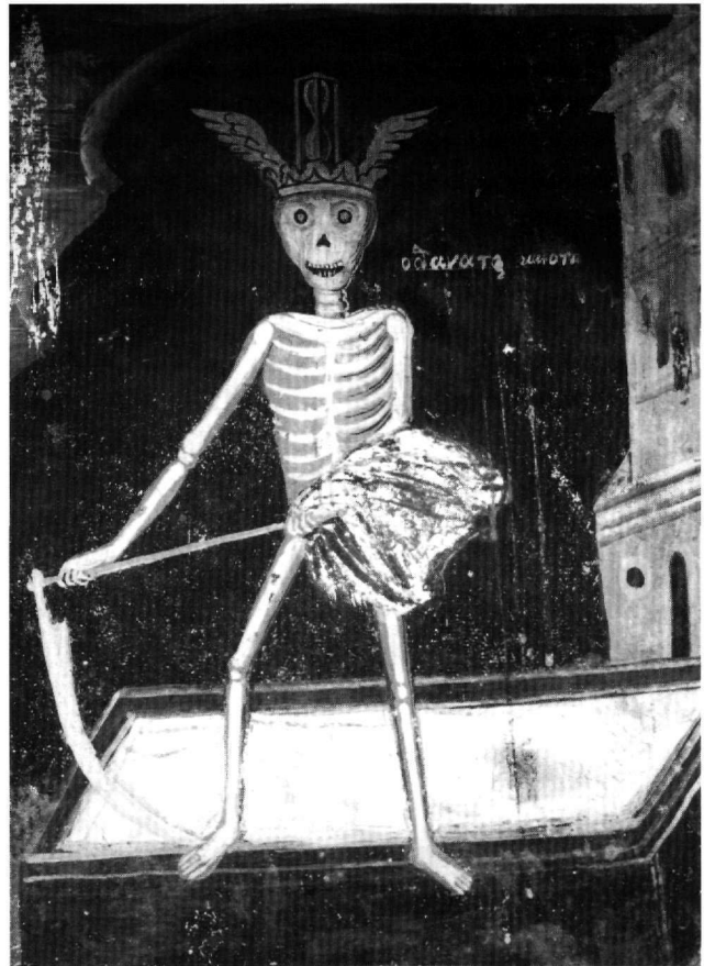
Εικ. 7. Χίος, καθολικό τής μονής Μουνδών: ο Θάνατος, με τό δρεπάνι και τό ήμώριο (1849).

Φαίνεται ότι ο συντάκτης επιχειρεί να «δέσει» στό κείμενό του 37 και έτοιμοπαράδοτα μέλη, τά όποια του είναι ποικιλοτρόπως γνωστά: προκαλώντας ένταση, με αυτή τήν αναδρομή, στην αναγνωστική και αναμνηστική αντίληψη. Τά έν λόγω στερεότυπα άπαντούν σε άρχαιότερες γραμματειακές ή/και εικονογραφικές συνθέσεις. Όπως ένια λεγόμενα τών ήλικιακών έκπροσώ-