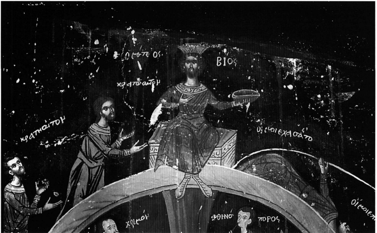
Εικ. 3. Λεπτομέρεια της Εικ. 2: η άκμή της περιστροφής.

κιών, από σταθερή θέση (Εικ. 2 και 3), χωρίς να συμμετέχουν στο δρώμενο της περιστροφής (κατοπτρίζουν, σέ αυτές τίς περιπτώσεις, τόν απώτερο στόχο τῶν ανερχομένων· ἀλλά καί τούς πικραίνουν –ὅπως «ὁ μάταιος Βίος», μέ τό ἐπιδεικτικά προβαλλόμενο «καυχή» στό ἀριστερό του χέρι (Εικ. 3)–, ὅταν ἐκεῖνοι χάσουν τήν ὑπατή θέση καί «πάρουν τόν κατήφορο»), καί ἄλλοτε ὑποδύμενα –προσωρινῶς– τήν πιά μεστή, τή βασιλική ἡλικία: ὅπως, δ.χ., ὁ σαραντάρης στόν Ἅγιο Νικόλαο τῆς Τσαριτσάνης (1753) 11 , τά κορυφαία πρόσωπα χα-