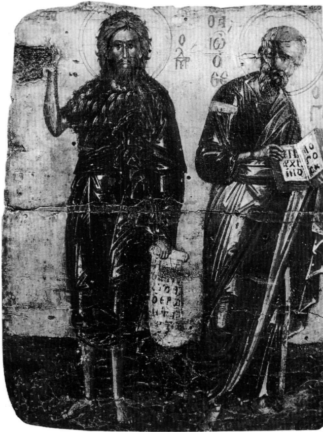
Εικ. 4. Άγιον Όρος, Ιερά Μονή Κουτλουμουσιού. Εικόνα με τον άγιο Ιωάννη τον Πρόδρομο και τον άγιο Ιωάννη τον Θεολόγο.

με στη διάθεσή μας μία τρίτη απεικόνιση, μετά την εικόνα του Τζάνε 24 και την εξεταζόμενη, με τον άγιο Ιωάννη τον Θεολόγο και την Παναγία Οδηγήτρια, στην οποία μπορούμε να ανιχνεύσουμε τα ίδια θεολογικά μηνύματα. Στα παραπάνω παραδείγματα προστίθενται άλλα δύο με παραπλήσιο εικονογραφικό θέμα. Πρόκειται για τις εικόνες της μονής της Αγίας Αικατερίνης στο Σινά, του