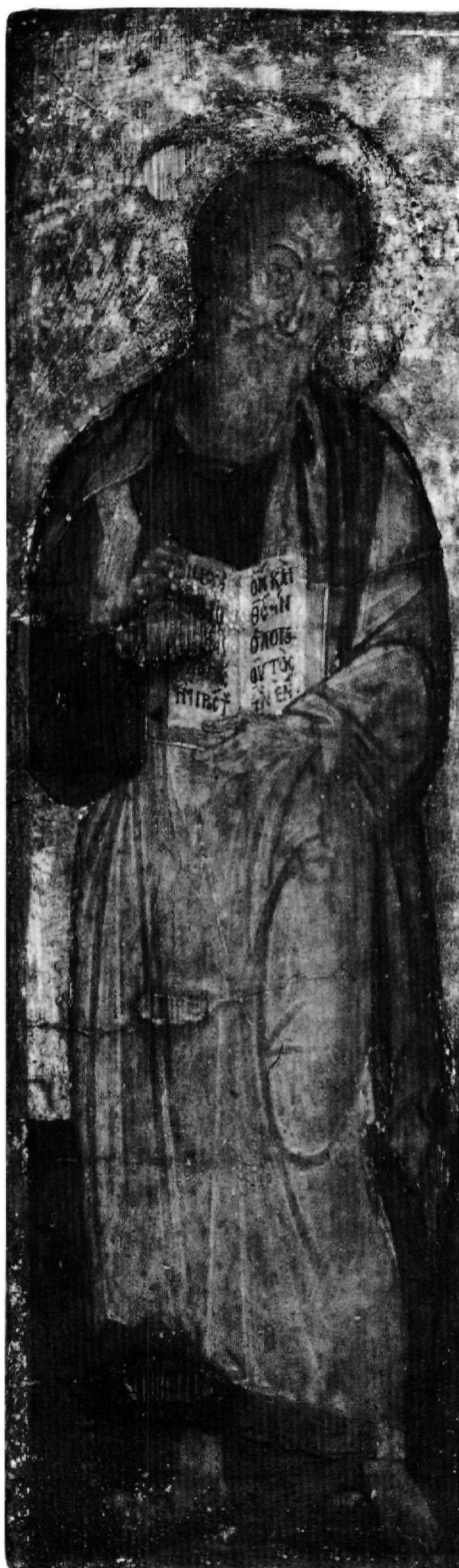
Εικ. 2. Εκκλησιαστικό Μουσείο Σερρών. Ο άγιος Ιωάννης ο Θεολόγος (λεπτομέρεια της Εικ. 1).

περισσότερο την Παναγία που αποτελεί την κυρίαρχη και βαρύνουσα μορφή της σύνθεσης 16 . Τα ιδιαίτερα, μυστικά και θεολογικά μηνύματα που απορρέουν από την εικονογραφία του θέματος τονίζουν και αναδεικνύουν το ύψιστο μήνυμα της Ενσάρκωσης του Λόγου. Η Θεοτόκος και ο άγιος Ιωάννης ο Θεολόγος παραπέμπουν επίσης στο βαθύτερο νόημα τόσο της ανάστασης, όσο και της σωτηρίας του ανθρώπου. Η έντονη περισυλλογή και η βαθιά λύπη που αποτυπώνονται στο πρόσωπο και στη στάση του αγαπημένου μαθητή του Χριστού προσδίδουν δραματική χροιά αλλά και συναισθηματική ένταση στην εικόνα (Εικ. 2 και 3).