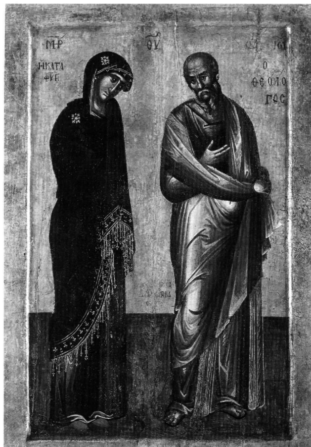
Εικ. 3. Εθνικό Αρχαιολογικό Μουσείο Σόφιας. Εικόνα με την Παναγία Καταφυγή και τον άγιο Ιωάννη τον Θεολόγο.

Στην αγιορειτική μονή Κουτλουμουσίου φυλάσσεται μια εικόνα, χρονολογημένη στο 14ο-15ο αιώνα, όπου παριστάνονται οι άγιοι Ιωάννης ο Πρόδρομος και Ιωάννης ο Θεολόγος, όρθιοι, να κρατούν ανοιχτό ειλητάριο και ανοιχτό ευαγγέλιο αντίστοιχα 23 (Εικ. 4). Ο ευαγγελιστής παριστάνεται σε γεροντική ηλικία, στραμμένος προς τα αριστερά και με ανοιχτό κώδικα στα χέρια, όπου διακρίνεται η αρχή του Ευαγγελίου του (ΕΝ