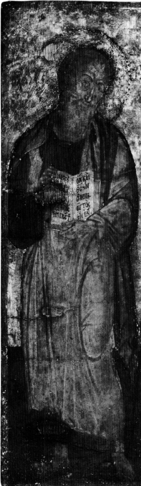
Εικ. 2. Εκκλησιαστικό Μουσείο Σερρών. Ο άγιος Ιωάννης ο Θεολόγος (λεπτομέρεια της Εικ. 1).

περισσότερο την Παναγία που αποτελεί την κυρίαρχη και βαρύνουσα μορφή της σύνθεσης 16 . Τα ιδιαίτερα, μυστικά και θεολογικά μηνύματα που απορρέουν από την εικονογραφία του θέματος τονίζουν και αναδεικνύουν το ύψιστο μήνυμα της Ενσάρκωσης του Λόγου. Η Θεοτόκος και ο άγιος Ιωάννης ο Θεολόγος παραπέμπουν επίσης στο βαθύτερο νόημα τόσο της ανάστασης, όσο και της σωτηρίας του ανθρώπου. Η έντονη περισυλλογή και η βαθιά λύπη που αποτυπώνονται στο πρόσωπο και στη στάση του αγαπημένου μαθητή του Χριστού προσδίδουν δραματική χροιά αλλά και συναισθηματική ένταση στην εικόνα (Εικ. 2 και 3).