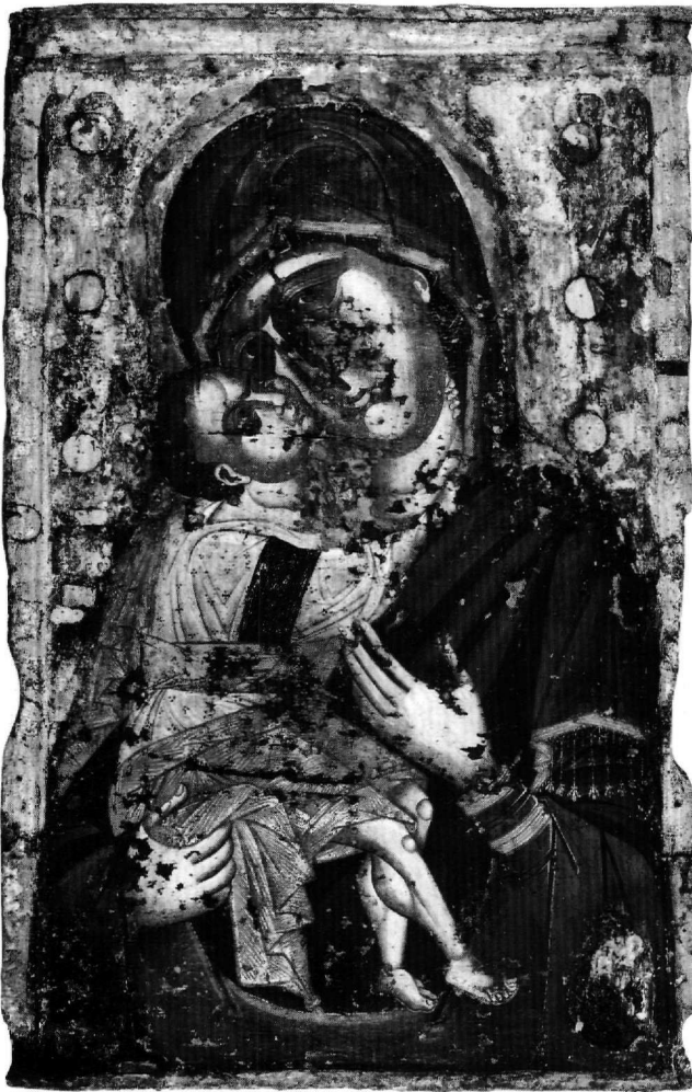
Εικ. 3. Βέροια. Ναός Παναγίας Περιβλέπτου. Εικόνα Παναγίας Γλυκοφιλούσας. Τρίτο τέταρτο του 14ου αιώνα.

χιτώνας της διακρίνεται ελάχιστα μέσα από το τριγωνικό άνοιγμα που σχηματίζει το μάτιο στο ύψος του στήθους και είναι και αυτός διακοσμημένος με τον ίδιο τρόπο στο λαμό και στην άκρη του δεξιού μανικιού.