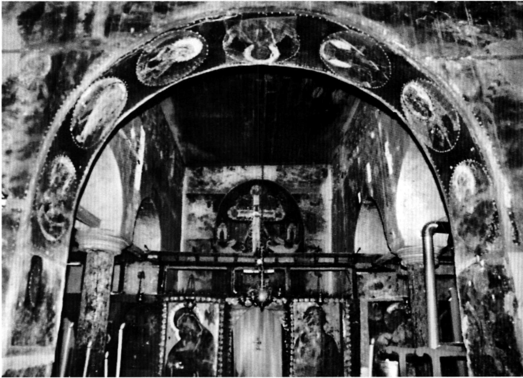
Εικ. 5. Βέροια. Ναός Παναγίας Περιβλέπτου. Το εσωτερικό του ναού με τις εικόνες του 18ου αιώνα.

ναγία στον τύπο της Γλυκοφιλούσας και χρονολογείται στις αρχές του 18ου αιώνα. Πρόκειται για το δεύτερο στρώμα εικόνας με την Παναγία Γλυκοφιλούσα, το οποίο αποκολλήθηκε και αποτέλεσε χωριστή εικόνα. Το πρώτο στρώμα χρονολογείται στο 12ο αιώνα. Στο στρώμα του 12ου αιώνα 22 , όπως και στο δεύτερο του 18ου αιώνα, ο Χριστός κρατεί με το αριστερό χέρι το πηγούνι της Παναγίας, όπως και στην εικόνα της Περιβλέπτου της Βέροιας. Τα στοιχεία των αρχών του 18ου αιώνα είναι στην εικόνα αυτή σαφή, όπως είναι ορατή και η τάση της επιστροφής στα παλαιολόγια πρότυπα που έχει παρατηρηθεί και στις τοιχογραφίες 23 .