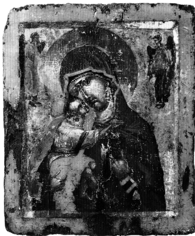
Εικ. 4. Ιερό Ίδρυμα Ευαγγελιστρίας Τήνου. Συλλογή Ρ. Ανδρεάδη. Εικόνα Παναγίας Περιβλέπτου. Πρώτο τέταρτο του 14ου αιώνα.

Τα ερωτήματα που τίθενται είναι η ακριβέστερη χρονολόγηση της εικόνας και ο προσδιορισμός του τόπου κατασκευής της. Στοιχεία για τα ερωτήματα αυτά δίνει η τεχνοτροπική απόδοση της εικόνας. Η σχηματοποίηση στην απόδοση των ρούχων, ο έντονα βαθύχρωμος προπλασμός στις παρυφές των προσώπων, τα μεγάλα μάτια με τα έντονα γραμμένα φρύδια, οι μεγάλες κόρες και τα σκούρα βλέφαρα με τις διπλές λευκές γραμμές πάνω και κάτω, η γραμμικά αποδοσμένη μύτη με τα μεγάλα πτερύγια, το μικρό στόμα με την έντονη και τυποποιημένη σκιά, οι έντονες ψιμμουθιές είναι στοιχεία που