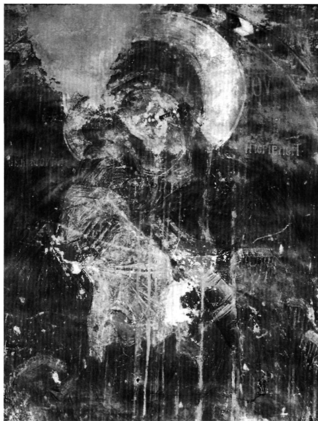
Εικ. 2. Βέροια. Ναός Παναγίας Περιβλέπτου. Τοιχογραφία με παράσταση της Παναγίας Περιβλέπτου.

Η εικόνα της Παναγίας Γλυκοφιλούσας που εξετάζουμε είναι μεγάλων διαστάσεων (1,60×1,04 μ.), στις ίδιες περίπου διαστάσεις με τη βυζαντινή, και έχει υποστεί δύο κάθετα ρήγματα, τα οποία όμως δεν αλλοιώνουν την όψη της. Το σύμπλεγμα Παναγίας - Χριστού εικονίζεται μέσα σε χρυσοκίτρινο φόντο και καταλαμβάνει όλο σχεδόν το ύψος της εικόνας. Η Παναγία εικονίζεται μέχρι τη μέση, στραμμένη κατά τα τρία τέταρτα προς τα αριστερά. Κρατεί τον Χριστό στο δεξιό μέρος του σώματός της και ακουμπά το μάγουλό της στο πρόσωπό του, όπως στη βυζαντινή τοιχογραφία (Εικ. 2) και στην εικόνα του ναού (Εικ. 3). Γέρνει έντονα το κεφάλι προς το δεξιό ώμο, πολύ πιο έντονα από ό,τι στις βυζαντινές