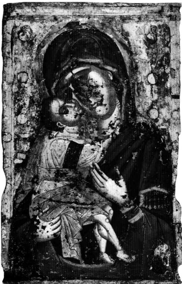
Εικ. 3. Βέροια. Ναός Παναγίας Περιβλέπτου. Εικόνα Παναγίας Γλυκοφιλούσας. Τρίτο τέταρτο του 14ου αιώνα.

χιτώνας της διακρίνεται ελάχιστα μέσα από το τριγωνικό άνοιγμα που σχηματίζει το μάτιο στο ύψος του στήθους και είναι και αυτός διακοσμημένος με τον ίδιο τρόπο στο λαμό και στην άκρη του δεξιού μανικιού.