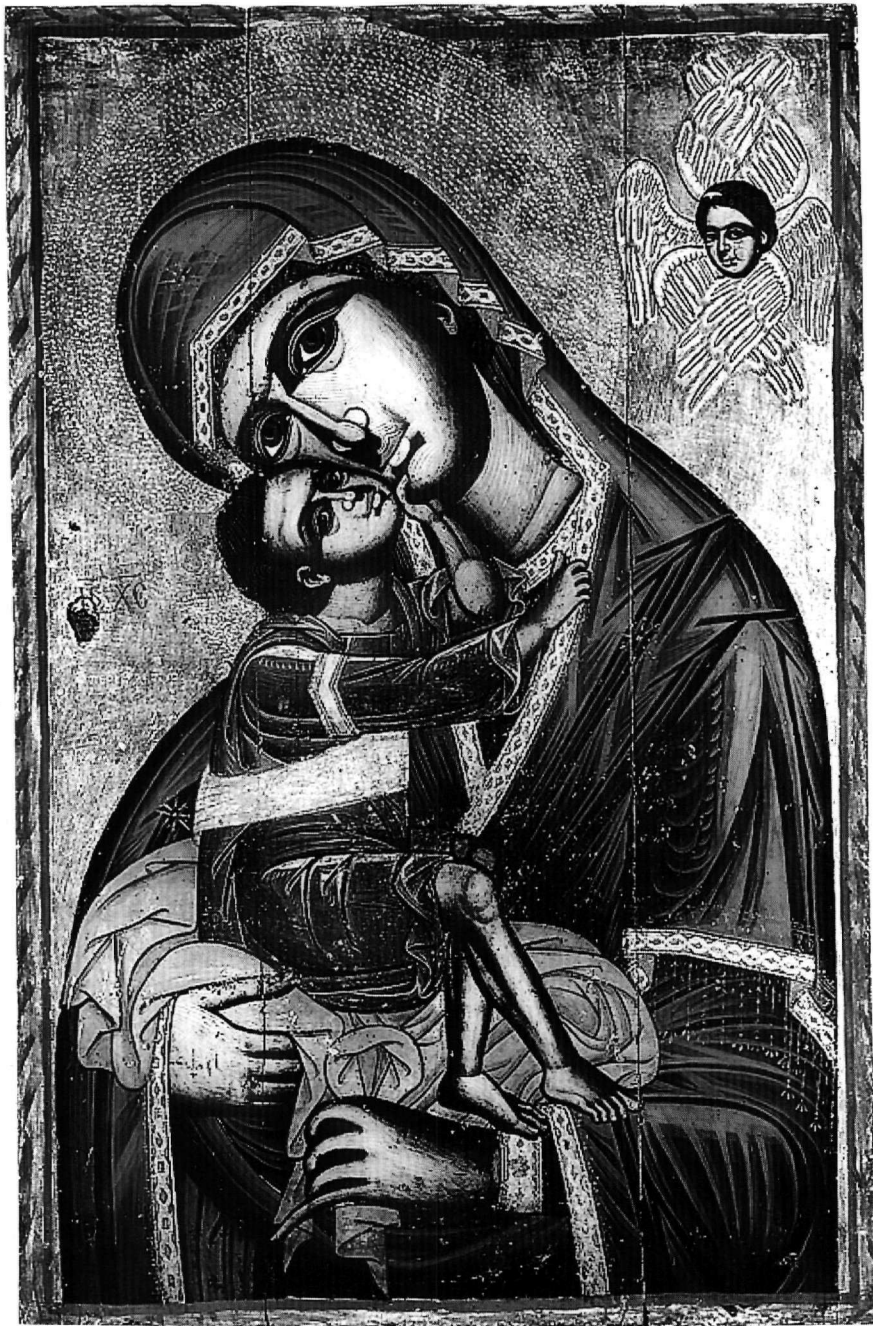
Εικ. 1. Βέροια. Ναός Παναγίας Περιβλέπτου. Εικόνα Παναγίας Γλυκοφιλούσας. Πρώτο τέταρτο του 18ου αιώνα.