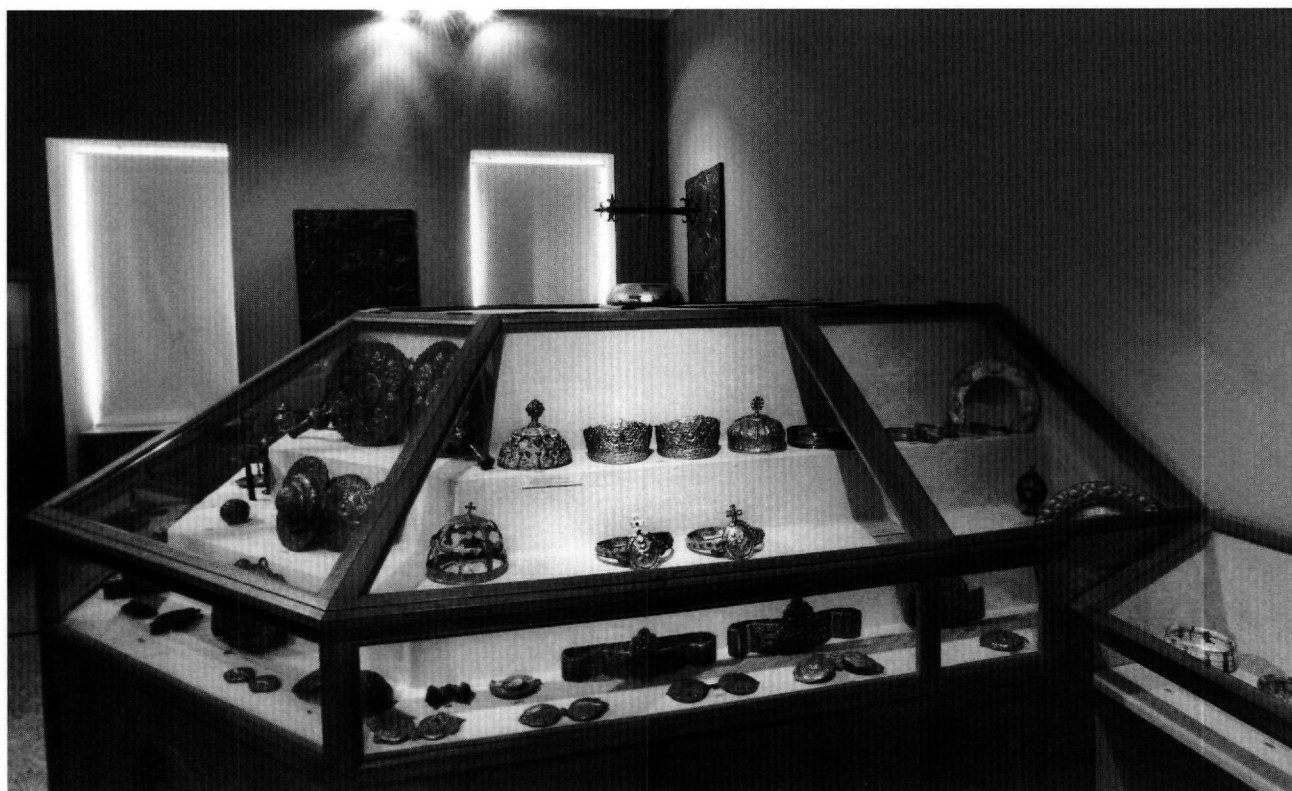
Εικ. 16. Η προθήκη της μεταβυζαντινής μεταλλοτεχνίας (1830-2004) στο Βυζαντινό και Χριστιανικό Μουσείο. Στο επάνω ράφι δεξιά, ανάμεσα σε στέφανα γάμου και φωτοστέφανο από επένδυση εικόνας, οι κρίκοι.

να από το 1887 18 , ακόμη κατά το μεσοπόλεμο, την εποχή δηλαδή της καταγραφής του καταλόγου των κειμηλίων του Ταμείου Ανταλλαξίμων, οι ψυχικά ασθενείς βρίσκονταν σε μια γκριζα ζώνη ανάμεσα στους άρρωστους και τους καταραμένους. Το φρενοκομείο το θεωρούσαν, και σε μεγάλο βαθμό ήταν, άσυλο εφ' όρου ζωής εγκλεισμού. Έτσι, η προεπισημονική θεραπεία με τους κρίκους και την πρόσδεση στην εκκλησία θεωρήθηκε ως αποκλειστικά εφαρμοζόμενη στους απέλπιδες αυτούς ασθενείς.