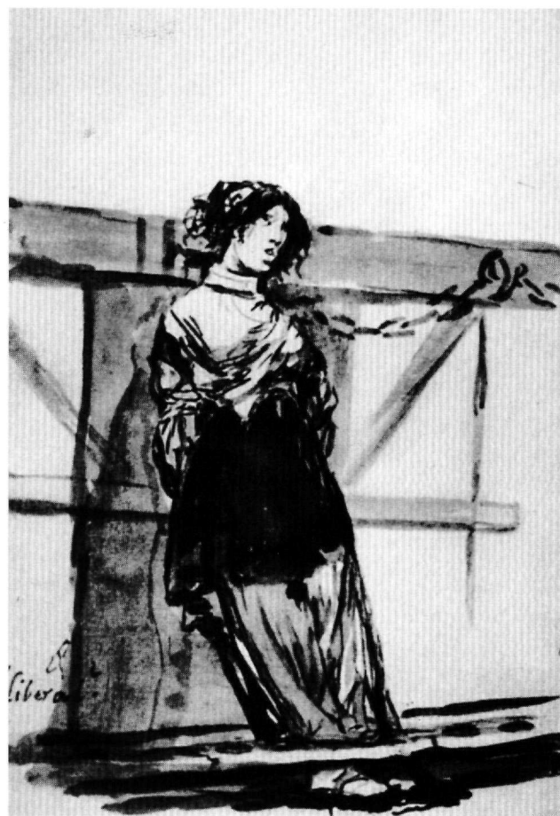
Εικ. 15. Φρ. Γκόγια, «Επειδή ήταν φιλελεύθερη», σχέδιο τονισμένο με σέπια (1814-1820). Μαδρίτη, Μουσείο Prado.

Με την αναγνώριση των κρίκων ως προορισμένων για «φρενοβλαβείς», οι συντάκτες του καταλόγου δεν καταφέρνουν μεν να διατυπώσουν με ακρίβεια τον προορισμό των συγκεκριμένων κρίκων, αποκαλύπτουν όμως τη δική τους στάση απέναντι στην τρέλα. Αν και νομοθεσία για την περίθαλψη ψυχικά ασθενών σε ειδικά νοσοκομεία υπάρχει στην Ελλάδα από το 1862 17 , νοσοκομεία που δέχονται ψυχασθενείς στην Κέρκυρα από το 1838, στην Κωνσταντινούπολη από το 1883, στην Αθή-