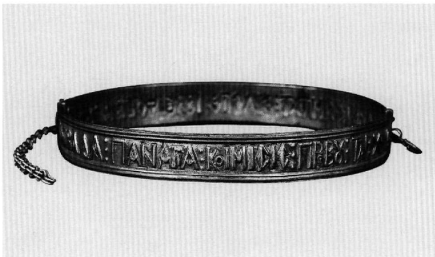
Εικ. 7. Μουσείο Μπενάκη 34306.