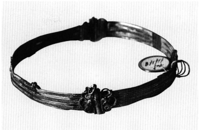
Εικ. 5. Βυζαντινό Μουσείο T 1448.

Τα ελάσματα διακρίνονται στο κύριο σώμα που έχει έκτυπη και χτυπητή διακόσμηση και επιγραφή, και το συμφυές πλαίσιο από διπλή σκοτία. Η διακόσμηση αποτελείται από φυτική έλικα που περιβάλλει στο ένα έλασμα την επιγραφή: ΣΥΜΙΩΝ ΟΓΛΟΥ ΚΟΣΜΑ ΟΓΛΟΥ //