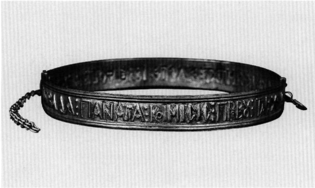
Εικ. 7. Μουσείο Μπενάκη 34306.