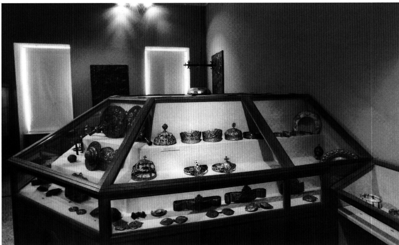
Εικ. 16. Η προθήκη της μεταβυζαντινής μεταλλοτεχνίας (1830-2004) στο Βυζαντινό και Χριστιανικό Μουσείο. Στο επάνω ράφι δεξιά, ανάμεσα σε στέφανα γάμου και φωτοστέφανο από επένδυση εικόνας, οι κρίκοι.

να από το 1887 18 , ακόμη κατά το μεσοπόλεμο, την εποχή δηλαδή της καταγραφής του καταλόγου των κειμήλιων του Ταμείου Ανταλλαξίμων, οι ψυχικά ασθενείς βρίσκονταν σε μια γκριζα ζώνη ανάμεσα στους άρρωστους και τους καταραμένους. Το φρενοκομείο το θεωρούσαν, και σε μεγάλο βαθμό ήταν, άσυλο εφ' όρου ζωής εγκλεισμού. Έτσι, η προεπιστημονική θεραπεία με τους κρίκους και την πρόσδεση στην εκκλησία θεωρήθηκε ως αποκλειστικά εφαρμοζόμενη στους απέλπιδες αυτούς ασθενείς.