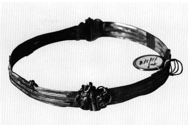
Εικ. 5. Βυζαντινό Μουσείο T 1448.

Τα ελάσματα διακρίνονται στο κύριο σώμα που έχει έκτυπη και χτυπητή διακόσμηση και επιγραφή, και το συμφυές πλαίσιο από διπλή σκοτία. Η διακόσμηση αποτελείται από φυτική έλικα που περιβάλλει στο ένα έλασμα την επιγραφή: ΣΥΜΙΩΝ ΟΓΛΟΥ ΚΟΣΜΑ ΟΓΛΟΥ //