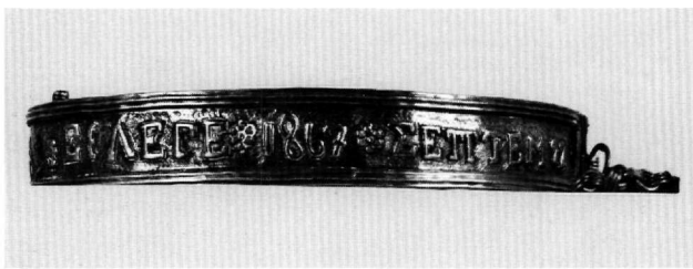
Εικ. 1. Βυζαντινό Μουσείο T 1445.

μέσο επισκέπτη του μουσείου την πραγματική χρήση των αντικειμένων αυτών. Με δυσκολία μπορούσε να μαντέψει κανείς ότι επρόκειτο για λαϊμοδέτες. Ελάνθανε έτσι η ιστορική μαρτυρία που παραδίδουν για την προεπιστημονική ιατρική.