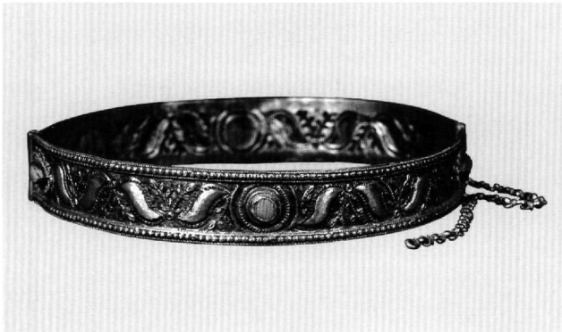
Εικ. 9. Μουσείο Μπενάκη 34308.