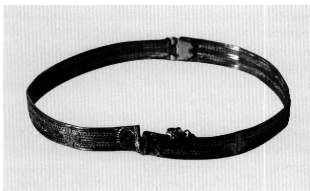
Εικ. 3. Βυζαντινό Μουσείο T 1449.

Το έλασμα είναι χυτό, επάργυρο και αποτελείται από τρεις ζώνες, την κεντρική που μένει κενή και το πλαίσιο που είναι επικολημένο και έχει κόσμημα με ρόμβους και κουκκίδες.