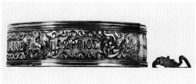
Εικ. 6. Βυζαντινό Μουσείο T 1444.

ΠΑΥΛΟΣ ΕΙΣ ΒΟΗΘΕΙΑΝ ΚΑΡΑΤΖΟΡΕΝ 1907 και στο άλλο παράσταση έφιππου δρακοντοκτόνου αγίου Γεωργίου με την επιγραφή: Ο ΑΓΙΟΣ ΓΕΩΡΓΙΟΣ.