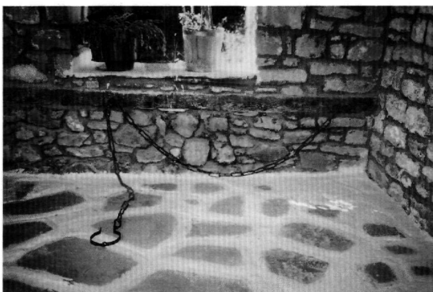
Εικ. 14. Μέτσοβο, Άγιος Νικόλαος. Σιδερένιοι κρίκοι με αλυσίδες στον εξωνάρθηκα της εκκλησίας.

οργάνωση παρόμοιων θεραπευτικών πρακτικών από την εκκλησία και η διεξαγωγή τους μέσα στο χώρο του εκκλησιαστικού οικοδομήματος προέκυψε ασφαλώς από την προσπάθεια της εκκλησίας να κρατήσει υπό τον έλεγχο της τη λαϊκή λατρεία. Ο κληρός επιβλέπει και νομιμοποιεί τη διαδικασία, προσφέρει επιπλέον την αναγκαία ψυχολογική στήριξη και βεβαίως εξασφαλίζει τα δοσίματα προς το ιερό.