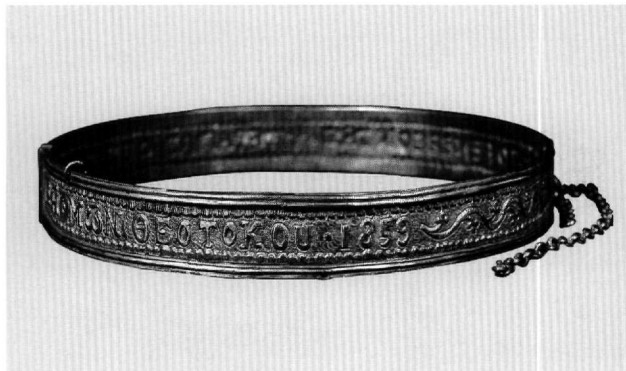
Εικ. 8. Μουσείο Μπενάκη 34310.

Η Άννα Μπαλλιάν ταύτισε την εκκλησία της επίκλησης με εκείνη των Αγίων Πρόβου, Ταράχου και Ανδρονίκου στο Ανδρονίκιο κοντά στην Καισάρεια. Η εκκλησία το 1835 ανακαινίστηκε και μετονομάστηκε σε Αγία Τριάδα.