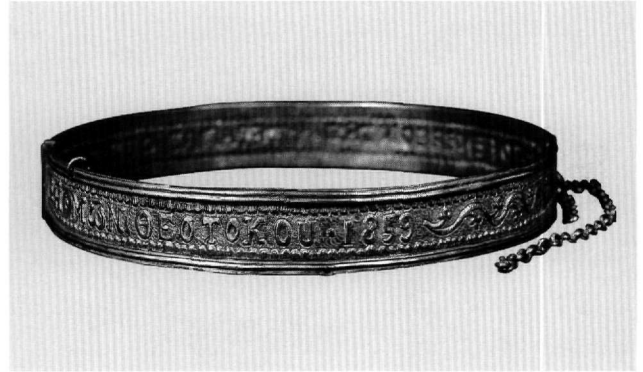
Εικ. 8. Μουσείο Μπενάκη 34310.

Η Άννα Μπαλλιάν ταύτισε την εκκλησία της επίκλησης με εκείνη των Αγίων Πρόβου, Ταράχου και Ανδρονίκου στο Ανδρονίκιο κοντά στην Καισάρεια. Η εκκλησία το 1835 ανακαινίστηκε και μετονομάστηκε σε Αγία Τριάδα.