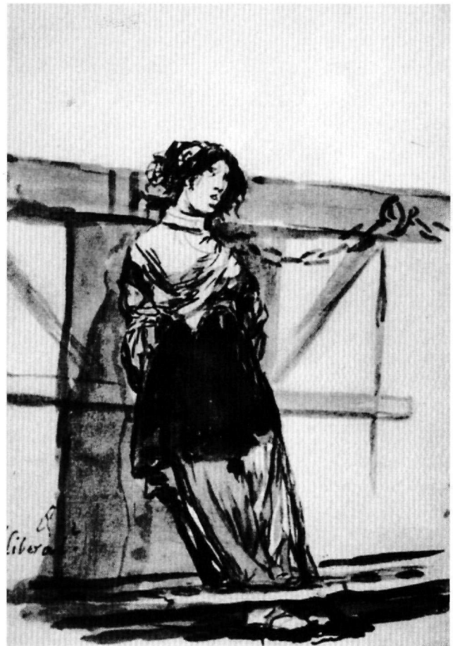
Εικ. 15. Φρ. Γκόγια, «Επειδή ήταν φιλελεύθερη», σχέδιο τονισμένο με σέπια (1814-1820). Μαδρίτη, Μουσείο Prado.

Με την αναγνώριση των κρίκων ως προορισμένων για «φρενοβλαβείς», οι συντάκτες του καταλόγου δεν καταφέρνουν μεν να διατυπώσουν με ακρίβεια τον προορισμό των συγκεκριμένων κρίκων, αποκαλύπτουν όμως τη δική τους στάση απέναντι στην τρέλα. Αν και νομοθεσία για την περίθαλψη ψυχικά ασθενών σε ειδικά νοσοκομεία υπάρχει στην Ελλάδα από το 1862 17 , νοσοκομεία που δέχονται ψυχασθενείς στην Κέρκυρα από το 1838, στην Κωνσταντινούπολη από το 1883, στην Αθή-