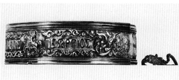
Εικ. 6. Βυζαντινό Μουσείο T 1444.

ΠΑΥΛΟΣ ΕΙΣ ΒΟΗΘΕΙΑΝ ΚΑΡΑΤΖΟΡΕΝ 1907 και στο άλλο παράσταση έφιππου δρακοντοκτόνου αγίου Γεωργίου με την επιγραφή: Ο ΑΓΙΟΣ ΓΕΩΡΓΙΟΣ.