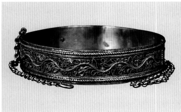
Εικ. 13. Μουσείο Μπενάκη 34307.

Η ταύτιση της χρήσης των αντικειμένων γίνεται καταρχήν στο ευρετήριο του Ταμείου Ανταλλαξίμων, όπου χαρακτηρίζονται ως «κρίκοι φρενοβλαβών». Η επίκληση στον άγιο για βοήθεια, που διαβάζουμε στις επιγραφές, δεν είναι αταίριαστη σε ιαματική χρήση. Αυτό σημαίνει ότι ο ασθενής με τον κρίκο στο λαϊμό θα προσδενόταν σε ιερή θέση στο χώρο συνήθως εκκλησίας και θα θεραπευόταν με τη μεσολάβηση του θείου. Πράγματι, δεν χωρεί αμφιβολία ότι πρόκειται για λαϊμοδέτες.