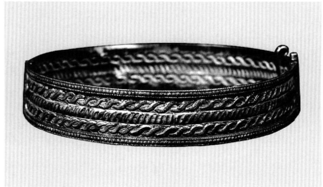
Εικ. 10. Μουσείο Μπενάκη 34309.

ως προς την τεχνική, σε εκείνους που έχουν ανάγλυφη εμπέστη διακόσμηση, στους οποίους η πίσω όψη επομένως είναι το αρνητικό της κύριας (αριθ. 1, 6, 7, 8, 9, 10 και 11) και σε εκείνους που αποτελούνται από λείο έλασμα με επικολλημένη διακόσμηση, απλή (αριθ. 2) ή συρματερή (αριθ. 4, 12 και 13). Παραλλαγή της τελευταίας ομάδας αποτελούν οι κρίκοι στους οποίους η συρματερή ταινία «δένεται» με μικρές πλάκες και ρόδακες και δεν συνδέεται με ενιαία ταινία (αριθ. 3 και 5), όπου επομένως γίνεται οικονομία στα υλικά. Η περιεκτικότητα σε ασήμι ποικίλλει, όπως φαίνεται από τη μακροσκοπική εξέταση. Παρά τις διαφορές τους αυτές, όλοι οι κρίκοι είναι λεπτοδουλεμένοι και δείχνουν προηγμένη χειροτεχνία.