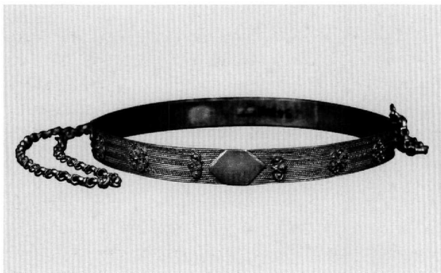
Εικ. 12. Μουσείο Μπενάκη 34305.

νόταν εκμετάλλευση κοιτασμάτων αργύρου και ότι κατά το 18ο και τις αρχές του 19ου αιώνα ήταν κέντρο αργυροχοΐας 3 . Αυτό τεκμηριώνεται, μεταξύ άλλων, και από αρκετά αντικείμενα, εκκλησιαστικής κυρίως χρήσης, που, όπως και οι κρίκοι που παρουσιάζονται εδώ, έφτασαν στην Αθήνα με τα κειμήλια των προσφύγων. Στις ίδιες συλλογές περιλαμβάνονται και ασημικά από την περιοχή της Καισάρειας με παρόμοιες κατεργασίες. Η διακόσμηση των κρίκων αριθ. 6 και 8 συγγενεύει με εκείνη δίσκων του Μουσείου Μπενάκη που, όπως σημειώνει η Άννα Μπαλλιάν, παρουσιάζουν τη στροφή στη διακοσμητική του 19ου αιώνα που προήλθε από την οικειοποίηση διακοσμητικών μοτίβων δυτικοευρωπαϊκής προέλευσης 4 .