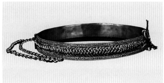
Εικ. 11. Μουσείο Μπενάκη 34304.

Ένας από τους κρίκους, ο χρονικά νεότερος, του 1907 (αριθ. 6, T 1444 του Βυζαντινού Μουσείου), δίνει στην επιγραφή την τοπογραφική ένδειξη Καράτζορεν. Στον αντίστοιχο φάκελο του Κέντρου Μικρασιατικών Σπουδών το Karacaören (= Μαύρα Ερείπια) καταγράφεται ως οικισμός που υπαγόταν στο βασιλείο της Σεβαστείας του Πόντου. Ο πληροφορητής του Κέντρου, από τη Μακεδονία, λέει στο τέλος της δεκαετίας του 1960 για το χωριό αυτό: «Έγινε χωριό περίπου 60 χρόνια προτού να φύγουμε οριστικά απ' την Τουρκία το 1922 με 1923». Και για τη γλώσσα που μιλούσαν παρατηρεί: «Η γλώσσα των γέρων του χωριού, παππούδες, πατεράδες, ήταν τα λαζικά, εμείς οι νέοι τότε μιλούσαμε τούρκικα. Φαίνονταν, δηλαδή, πως αν μέναμε λίγα χρόνια ακόμη στο χωριό μας όλοι πια θα μιλούσανε τούρκικα» (ΚΜΣ Φάκελος Καράτζορεν, 13). Τουρκόφωνος ήταν και ο πληθυσμός στους κοντινούς οικισμούς. Το Καράτζορεν είχε μία εκκλησία, του Αγίου Παντελεήμονα, όμως στο γειτονικό Αγτζακογιούν είχαν εκκλησία του Αγίου Γεωργίου, που λειτουργούσε κανονικά κάθε Κυριακή, σύμφωνα με όσα δήλωσε άλλος πληροφορητής (στο