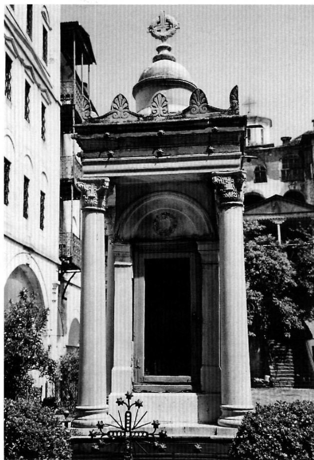
Εικ. 3. Μονή Ζωγράφου. Το ταφικό μνημείο των είκοσι έξι ζωγραφιτών μαρτύρων από τα δυτικά.

Το δεύτερο μνημείο βρίσκεται στη μονή Ζωγράφου 11 (Εικ. 3). Πρόκειται ουσιαστικά για κενοτάφιο που κατασκευάστηκε το 1873 σε ανάμνηση του μαρτυρίου των είκοσι έξι μοναχών που, σύμφωνα με την παράδοση, θανατώθηκαν μέσα στον πύργο της μονής το 1276, λόγω της σθεναρής τους αντίδρασης κατά της ένωσης των εκκλησιών που υποστήριζε ένθερμα ο τότε αυτοκράτορας Μιχαήλ Η' Παλαιολόγος (1259-1282) και ο πατριάρχης Ιωάννης ΙΑ' Βέκκος (1275-1282) 12 . Σύμφωνα με την παράδοση η εικόνα της Παναγίας Ακαθίστου, που βρισκόταν στο ζωγραφίτικο κελλί του Χέροβο, ειδοποίησε με θαυματουργό τρόπο τους μοναχούς της μονής Ζωγράφου για την έλευση των ενωτικών του Μιχαήλ Παλαιολόγου, ώστε να οχυρωθούν στον πύργο