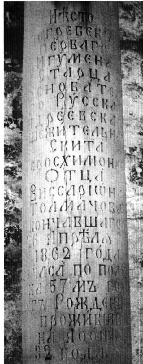
Εικ. 2. Τάφος ιερομονάχου Βησσαρίωνα. Επιγραφή στον κίονα του τάφου.

γωνική πλίνθο. Το κιονόκρανο που επιστέφει τον κίονα αποτελείται από κυμάτια που εναλλάσσονται με οδοντωτές ταινίες, ενώ στην κύρια όψη του τα στοιχεία αυτά διακόπτονται από ορθογωνικό πλαίσιο. Στην πάνω επιφάνεια του κιονοκράνου, που διαμορφώνεται σχεδόν ημισφαιρική, στηρίζεται λατινικός σταυρός με ακτινωτό κόσμημα στο σημείο ένωσης των κεραιών του. Στην κύρια όψη του κορμού του κίονα (Εικ. 2) αναγράφεται εγχάρακτη κεφαλαιογράμματη ρωσική επιγραφή σε είκοσι τρεις στίχους 7 , που στα ελληνικά αποδίδεται ως εξής: Ἐνθάδε / κείται / ὁ πρῶτος / Γέρων / Ἠγούμενος / καὶ δομῆτωρ / ταύτης τῆς ρωσικῆς / κοινοβιακῆς / σκήτης /