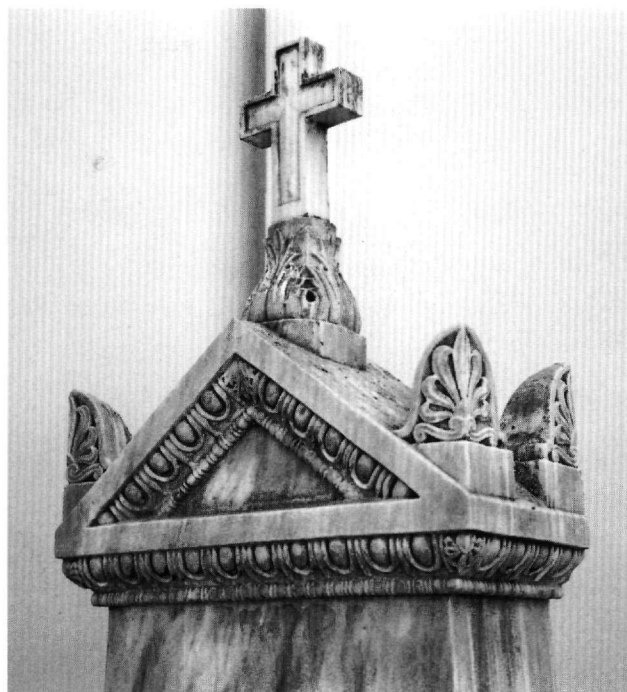
Εικ. 6. Μονή Αγίου Παντελεήμονος. Η επίστεψη του τάφου του ρώσου προξένου Νικολάου Θεοδώροβιτς Γιακουμόβσκι.

Η επιτάφια στήλη στον τάφο του ρώσου προξένου στη μονή Αγίου Παντελεήμονος αποτελεί επίσης συνηθι-