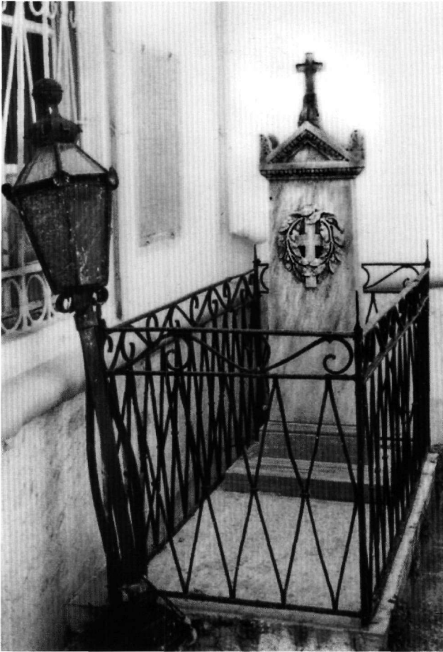
Εικ. 5. Μονή Αγίου Παντελεήμονος. Ο τάφος του ρώσου προξένου Νικολάου Θεοδώροβιτς Γιακουμπόβσκι.

την εσωτερική πλευρά των καταέτιων γείσων, καθώς και το κάτω τμήμα του οριζώντιου γείσου του αετώμα-