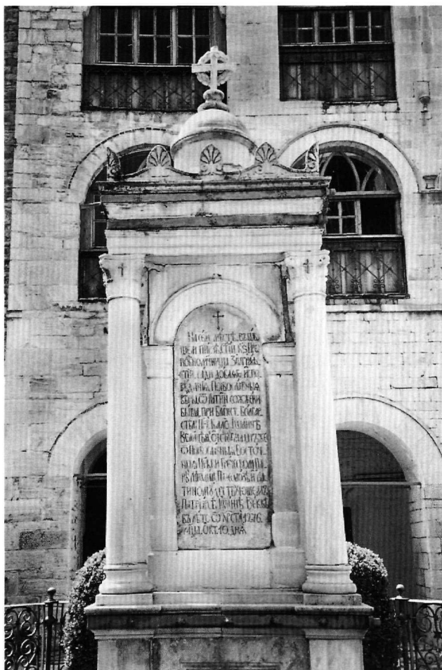
Εικ. 4. Μονή Ζωγράφου. Μνημείο ζωγραφιτών μαρτύρων. Ενεπίγραφη μαρμάρινη πλάκα στην ανατολική πλευρά.

Το τρίτο μνημείο βρίσκεται στη ρωσική μονή του Αγίου Παντελεήμονος, βόρεια του παρεκκλησιού του Αγίου Μητροφάνη (Εικ. 5). Πρόκειται για τον τάφο του ρώσου προξένου της Θεσσαλονίκης Νικολάου Θεοδώροβιτς Πακουμπόβσκι, που απεβίωσε το 1874 25 . Αποτελείται από μαρμάρινη ορθογωνική μονολιθική στήλη πάνω σε βαθμιδωτό βάθος που εδράζεται στη μαρμάρινη καλυπτήρια πλάκα του τάφου. Την κύρια όψη της στή-