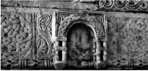
Εικ. 4. Ναός της Κομήσεως στο Καστανοχώρι. Το κεντρικό τμήμα του επιστυλίου.