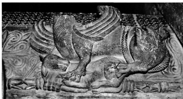
Εικ. 2. Ναός της Σαμαρίνας. Το σύμπλεγμα των ζώων στο αριστερό άκρο του επιστύλιου.

που εντάσσεται στην παραγωγή του εργαστηρίου της Σαμαρίνας 8 . Σώζεται ελλιπές κατά το αριστερό άκρο, σε σχεδόν άριστη κατά τα άλλα κατάσταση διατήρησης. Η αρχική θέση του δεν είναι γνωστή, αλλά θα πρέπει να αναζητηθεί μέσα στα όρια της μικρής κοιλάδας του Μποβέρκου, που φαίνεται πως γνώρισε ανάπτυξη κατά τους μεσοβυζαντινούς χρόνους.