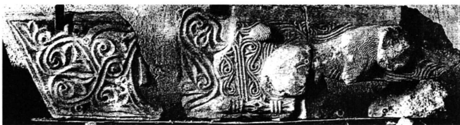
Εικ. 8. Αγία Σοφία του Μυστρά. Το δεξιό τμήμα του επιστυλίου (σήμερα στο Μουσείο του Μυστρά).

τεχνικό ιδίωμά του, αναλαμβάνοντας το διάκοσμο ενός μνημείου υψηλών προθέσεων, όπως είναι το καθολικό του μεσσηνιακού μοναστηριού. Το ίδιο πιθανώς υποδεικνύει και το άγνωστης αρχικής προέλευσης σύνολο του Μυστρά. Η σύγκριση κυρίως ανάμεσα στα δύο ζεύγη των προσκυνηταρίων δείχνει πως το τέμπλο του Μυστρά χρονικά δεν πρέπει να απέχει πολύ από τη Σαμαρίνα.