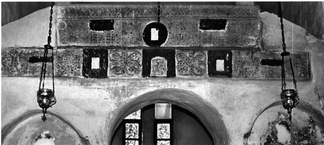
Εικ. 9. Ανδρομονάστηρο Μεσσηνίας. Τμήματα επιστυλίων εντοιχισμένα στο μεταγενέστερο κτιστό τέμπλο του καθολικού.

κάτω ακμές ορισμένων αποτημάτων. Τα ίδια θέματα, με όμοια χαρακτηριστικά, βρίσκονται και σε τμήματα επιστυλίων που έχουν επαναχρησιμοποιηθεί στο τέμπλο του Αγίου Δημητρίου στον Μυστρά 27 . Είναι πολύ πιθανό τα τελευταία να είναι δημιουργίες του ίδιου συνεργείου που εργάστηκε για το Ανδρομονάστηρο, με τα γλυπτά του οποίου συναποτελούν μία ξεχωριστή, αναγνωρίσιμη ομάδα στη γλυπτική του 12ου αιώνα στην Πελοπόννησο.