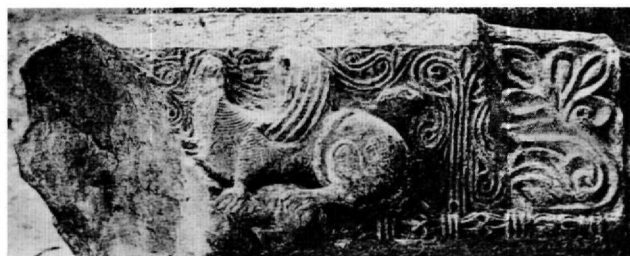
Εικ. 7. Αγία Σοφία του Μυστρά. Τμήμα από επιστύλιο σε δεύτερη χρήση, όπως σώθηκε κατά χώραν.

Για να παρακολουθήσουμε την εξέλιξη της τέχνης του εργαστηρίου θα είχε ενδιαφέρον η ανίχνευση της χρονολογικής σειράς με την οποία εκτελέστηκαν τα σωζόμενα γλυπτά. Τα δύο ζεύγη των προσκυνηταρίων, που είναι σχεδόν πανομοιότυπα, δεν προσφέρονται για σχετικές παρατηρήσεις. Αντιθέτως, τα τέσσερα επιστύλια παρουσιάζουν κάποιες μικρές διαφορές, οι οποίες δεν