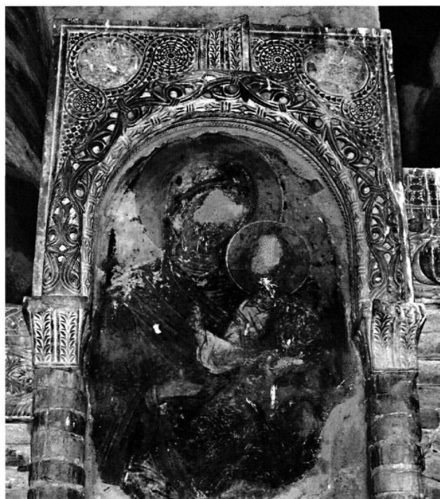
Εικ. 3. Ναός της Σαμαρίνας. Το ανάγλυφο πλαίσιο του βόρειου προσκνηταρίου.

Σε δύο ναούς της υστεροβυζαντινής πολιτείας του Μυστρά επαναχρησιμοποιήθηκαν γλυπτά που ανήκουν σε