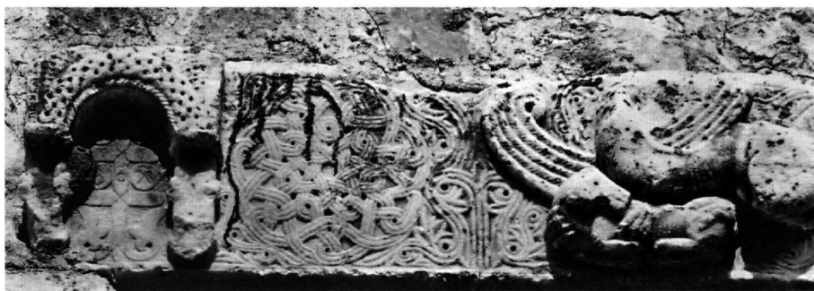
Εικ. 6. Νόμα της Μάνης. Το επιστύλιο.

νης με την τεχνική της ενθετικής με κηρομαστίχη, σχετίζεται μάλλον με το μέγεθος του μνημείου.