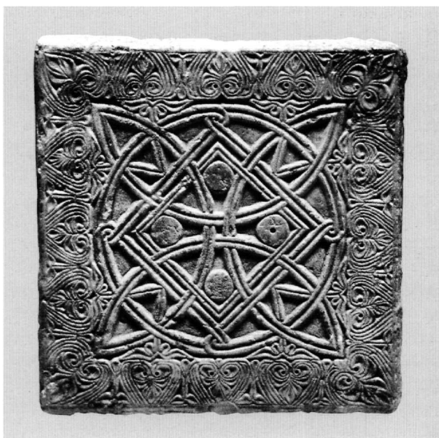
Εικ. 1. Μυστράς, συλλογή γλυπτών Μουσείου. Ανάγλυφη πλάκα (αριθ. ενρ. 1154).

των τριών θραυσμάτων συνολικά 33×22,5 εκ.). Κρίνοντας από το σωζόμενο τμήμα της, φαίνεται ότι η δεύτερη πλάκα θα ήταν μικρότερη από την ακέραιη. Σε αυτή επαναλαμβάνεται ο διάκοσμος της ακέραιης πλάκας, σε αμελέστερη όμως εκτέλεση και με μικρές διαφορές στην απόδοση των επιμέρους θεμάτων (Εικ. 2). Συγκεκριμένα, οι δίσκοι στις γωνίες του εσωτερικού ρόμβου καλύπτονται με πλέγμα, ενώ τα ανθήματα του πλαισίου, όπως επίσης και τα φερωτά ανθήματα, παρουσιάζονται πιο απλοποιημένα και συνοπτικά. Η πίσω πλευρά των τριών θραυσμάτων της πλάκας είναι αδρά λαξευμένη.