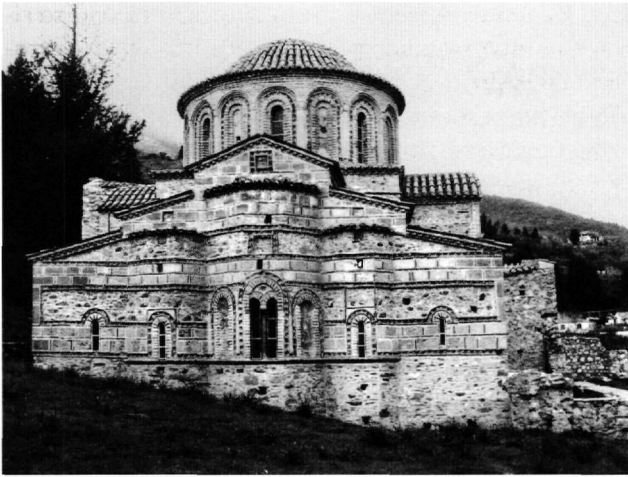
Εικ. 6. Μυστράς, ναός Αγίων Θεοδώρων. Ανατολική όψη.