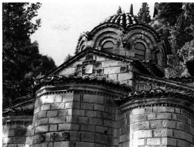
Εικ. 9. Μυστράς, ναός Περιβλέπτο. Ανατολική όψη, λεπτομέρεια.

Η συγκεκριμένη ωστόσο μορφή των «μετοπών» που κοσμούν τους ναούς του Μυστρά δεν εντοπίζεται σε άλλες περιοχές και, σύμφωνα με τον Γ. Βελή, παρουσιάζουν άμεση σχέση με τα πλαισιωμένα διακοσμητικά θέματα στις βάσεις των τεταρτοκυκλίων εκατέρωθεν των παραθύρων 44 . Αξιοσημείωτη είναι η εικονογραφική τους εξέλιξη, από ένα σαφώς διακοσμητικό θέμα, από υλικό μάλιστα σε δεύτερη χρήση, στον Άγιο Δημήτριο 45 , σε μία κατά πάσα πιθανότητα συμβολική-εραλδική παράσταση στην Περιβλεπτο με ενδιάμεσο στάδιο τις πλάκες των Αγίων Θεοδώρων. Σε αυτές ο διακοσμητικός χαρακτήρας παραμένει, βέβαια, κυρίαρχος, η επιλογή όμως του πλέγματος που τις κοσμεί δεν πρέπει να είναι συμπτωματική, καθώς το συγκεκριμένο κόσμημα δεν είναι συνηθι-