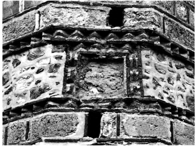
Εικ. 7. Μυστράς, ναός Αγίων Θεοδώρων. Τετράγωνο διάχωρο επάνω από το παράθυρο της κεντρικής αψίδας.

Η αρχική θέση των πλακών δεν είναι γνωστή. Η απόδοσή τους στον εσωτερικό γλυπτό διάκοσμο των Αγίων Θεοδώρων δεν φαίνεται πιθανή, καθώς οι διαστάσεις τους αποκλείουν το ενδεχόμενο να αποτελούν μέρος του τέμπλου του ναού.