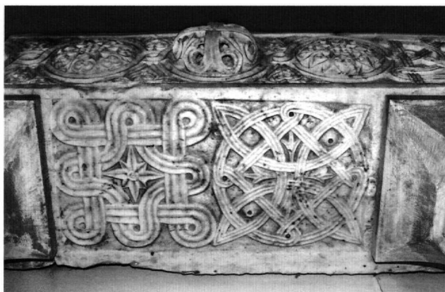
Εικ. 3. Μονή Οσίου Λουκά, συλλογή γλυπτών τράπεζας. Τμήμα επιστυλίου τέμπλου από το μετόχι της μονής του Οσίου Λουκά στην Αντίκυρα.

στο επιστύλιο του τέμπλου από το μετόχι της μονής του Οσίου Λουκά στην Αντίκυρα (τελευταίο τέταρτο 11ου αι.) 14 (Εικ. 3).