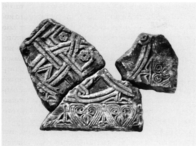
Εικ. 2. Μυστράς, συλλογή γλυπτών Μουσείου. Ανάγλυφη πλάκα σε τρία θραύσματα.

πλατιά, κοίλη επιφάνεια των ακραίων λοβών των ανθεμίων, που στρέφονται γύρω από το ίχνος του τρυπανιού, θυμίζει ανάλογη επεξεργασία των φυτικών θεμάτων σε μέλη από το Arap Camii στην Κωνσταντινούπολη (α' μισό 14ου αι.) 8 στον ελλαδικό χώρο παρατηρείται, μεταξύ άλλων, σε θωράκιο του παλιού τέμπλου του Αγίου Δημητρίου Κατσούρη (β' μισό 13ου αι.), στην πλάκα με το δίλοβο άνοιγμα και την αετωματική απόληξη στην ανατολική όψη του ταφικού μνημείου της Αγίας Θεοδώρας (13ος αι.) και σε κιονόκρανο από τον