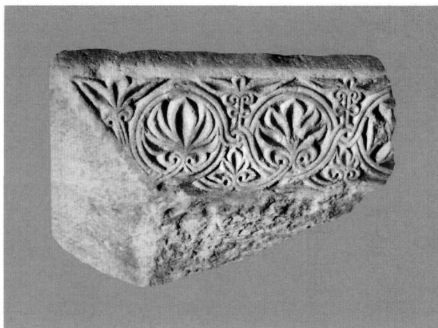
Εικ. 5. Μυστράς, συλλογή γλυπτών Μουσείου. Τμήμα επιθήματος.

κρός πρόβολος σε αφίδωμα του νότιου τοίχου και τμήμα γείσου στο παράθυρο της νότιας όψης 25 . Η σαφής προτίμηση στα πολύπλοκα γεωμετρικά και φυτικά θέματα και η πυκνότητα του σχεδίου αποτελούν κοινά γνωρίσματα των έργων αυτών (Εικ. 5). Στην εκτέλεση του διακόσμου συνδυάζεται το χαμηλό με το αβαθές, σχεδόν εγγάρακτο, ανάγλυφο, ενώ δεν λείπουν και τα έξοργα στοιχεία. Η διμερής ταινία τραπεζιοειδούς διατομής, που χρησιμοποιείται σχεδόν αποκλειστικά στην απόδοση των θεμάτων, συνιστά έναν ακόμη συνδυασμό κρίκο μεταξύ των γλυπτών της ομάδας, καθώς και ασφαλές κριτήριο για την ένταξη και νέων γλυπτών σε