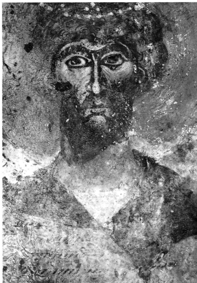
Εικ. 10. Κάτω Καστανιά, Άγιος Ανδρέας. Στρατιωτικός άγιος (λεπτομέρεια).

(1374-1375) και των Αγίων Αποστόλων, έργο, όπως φαίνεται, του ίδιου ζωγράφου, όπως πιθανότατα και τα δύο διαδοχικά στρώματα της γραπτής διακόσμησης στο ναό της Κοίμησης της Θεοτόκου, που έχουν τοποθετηθεί χρονικά στο 15ο αιώνα 55 . Ιδιαίτερα η ομάδα έχει συνδεθεί άμεσα με τις τοιχογραφίες στο παρεκκλήσι του Κυπριανού (1366), στη νότια στοά της Οδηγήτριας (μετά το 1366) και στον Άι-Παννάκη του Μυστρά (περ. 1375) 56 . Οι τοιχογραφίες τριών ακόμη εκκλησιών σε κοντινές περιο-