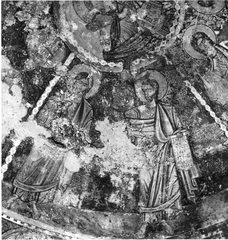
Εικ. 15. Μαλέας, Άγιος Γεώργιος. Τρούλος: διάχωρο με το Μωσή και αδιάγνωστο προφήτη.

δικαιολογείται από την αφιέρωση ή έστω τις διαστάσεις του ναού.