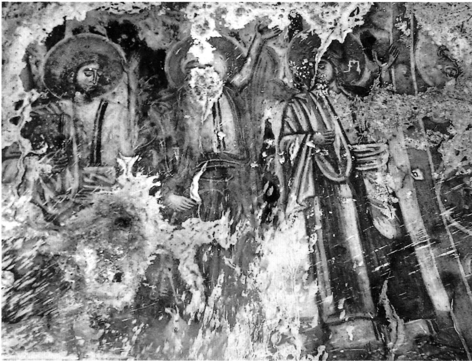
Εικ. 5. Φούτια, Άγιος Γεώργιος. Η Ανάληψη (λεπτομέρεια).

κό του προορισμό, έχουν σωθεί δύο παραστάσεις από το μαριολογικό κύκλο 39 .