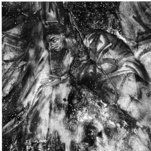
Εικ. 3. Φλόκα, μονή Χειμάτισσας. Η Μετάδοση: ο Ιούδας (λεπτομέρεια).

Αι-Παννάκης (περ. 1375) 19 — αλλά και άλλων ναών στη Λακωνία 20 .