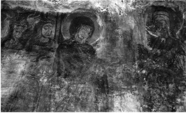
Εικ. 4. Φλόκα, μονή Χεμιάτισσας. Η Παράδοση της Πορφύρας (λεπτομέρεια).

παρουσία του άγιου Ιωάννη του Χρυσοστόμου (Χεμιάτισσα, Άγιος Γεώργιος στα Φούτια, Άγιος Ανδρέας και Ταξιάρχης στην Κάτω Καστανιά, Άγιος Γεώργιος στους Μολάους) και του Μεγάλου Βασιλείου (Χεμιάτισσα, Άγιος Γεώργιος στα Φούτια, Άγιος Ανδρέας και Ταξιάρχης στην Κάτω Καστανιά, Άγιος Γεώργιος στους Μολάους). Ακολουθούν ο άγιος Γρηγόριος ο Θεολόγος (Άγιος Γεώργιος στα Φούτια, Ταξιάρχης στην Κάτω Καστανιά, Άγιος Γεώργιος στους Μολάους), ο άγιος Αθανάσιος Αλεξανδρείας (Ταξιάρχης στην Κάτω Καστανιά, Άγιος Γεώργιος στους Μολάους), ενώ στο παρεκκλήσι του Αγίου Γεωργίου στον Μαλέα έχουν πάρει θέση οι άγιοι Κύριλλος Αλεξανδρείας και Νικηφόρος Κωνσταντινουπόλεως 27 .