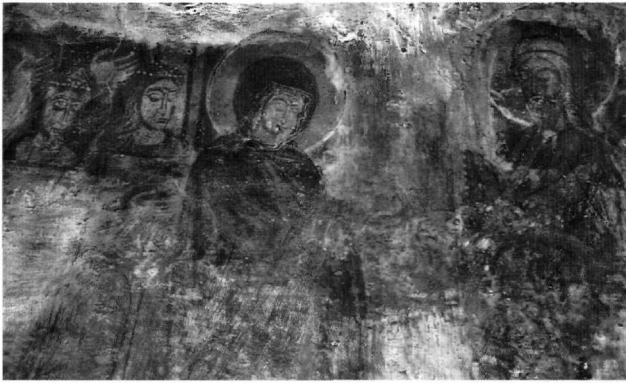
Εικ. 4. Φλόκα, μονή Χειμάτισσας. Η Παράδοση της Πορφύρας (λεπτομέρεια).

παρουσία του άγιου Ιωάννη του Χρυσοστόμου (Χειμάτισσα, Άγιος Γεώργιος στα Φούτια, Άγιος Ανδρέας και Ταξιάρχης στην Κάτω Καστανιά, Άγιος Γεώργιος στους Μολάους) και του Μεγάλου Βασιλείου (Χειμάτισσα, Άγιος Γεώργιος στα Φούτια, Άγιος Ανδρέας και Ταξιάρχης στην Κάτω Καστανιά, Άγιος Γεώργιος στους Μολάους). Ακολουθούν ο άγιος Γρηγόριος ο Θεολόγος (Άγιος Γεώργιος στα Φούτια, Ταξιάρχης στην Κάτω Καστανιά, Άγιος Γεώργιος στους Μολάους), ο άγιος Αθανάσιος Αλεξανδρείας (Ταξιάρχης στην Κάτω Καστανιά, Άγιος Γεώργιος στους Μολάους), ενώ στο παρεκκλήσι του Αγίου Γεωργίου στον Μαλέα έχουν πάρει θέση οι άγιοι Κύριλλος Αλεξανδρείας και Νικηφόρος Κωνσταντινουπόλεως 27 .