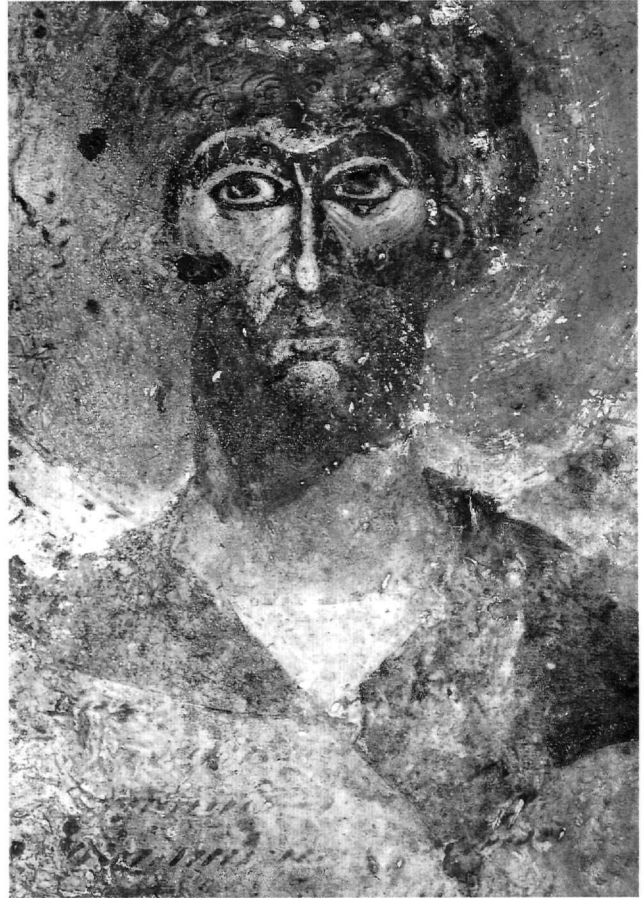
Εικ. 10. Κάτω Καστανιά, Άγιος Ανδρέας. Στρατιωτικός άγιος (λεπτομέρεια).

(1374-1375) και των Αγίων Αποστόλων, έργο, όπως φαίνεται, του ίδιου ζωγράφου, όπως πιθανότατα και τα δύο διαδοχικά στρώματα της γραπτής διακόσμησης στο ναό της Κοίμησης της Θεοτόκου, που έχουν τοποθετηθεί χρονικά στο 15ο αιώνα 55 . Ιδιαίτερα η ομάδα έχει συνδεθεί άμεσα με τις τοιχογραφίες στο παρεκκλήσι του Κυπριανού (1366), στη νότια στοά της Οδηγήτριας (μετά το 1366) και στον Άι-Παννάκη του Μυστρά (περ. 1375) 56 . Οι τοιχογραφίες τριών ακόμη εκκλησιών σε κοντινές περιο-