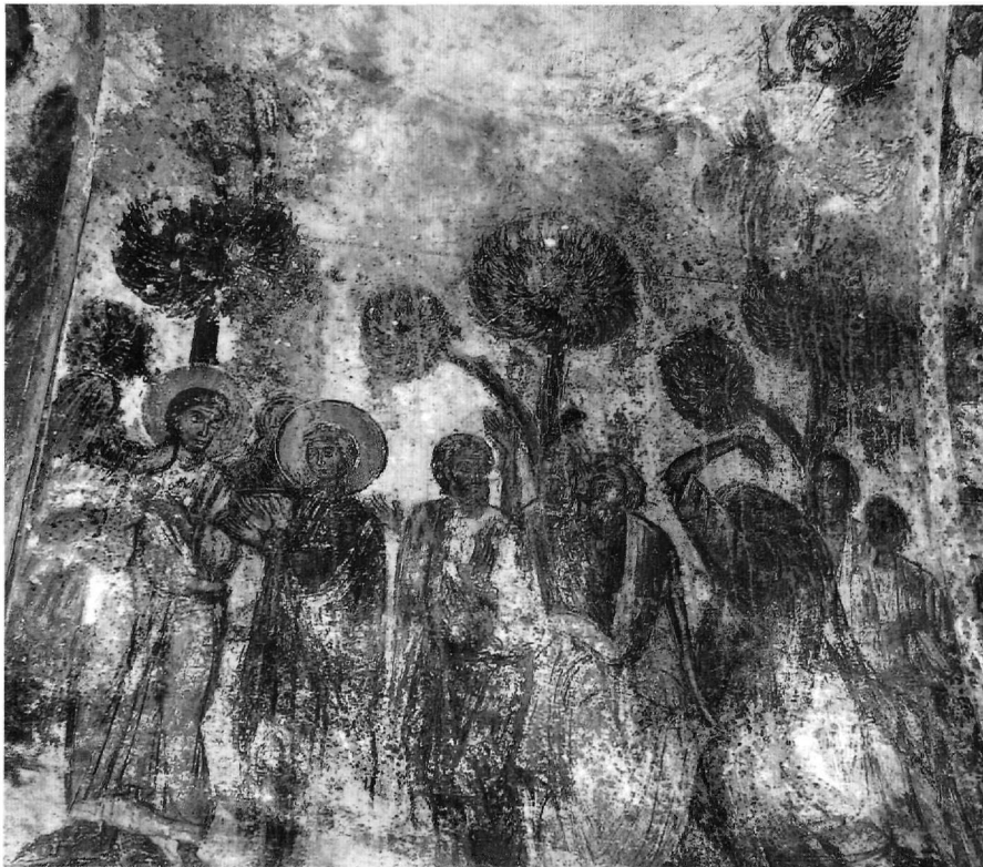
Εικ. 8. Κάτω Καστανιά, Ταξιάρχης. Η Ανάληψη, νότιο ημιχόριο.

πει να οφείλονται και οι τοιχογραφίες του Αγίου Γεωργίου στα Φούτια (Εικ. 5 και 6). Από έναν τρίτο ζωγράφο, τον Γ, θα πρέπει να προέρχονται οι τοιχογραφίες του Ταξιάρχη και του Αγίου Ανδρέα στην περιοχή της Κάτω Καστανιάς (Εικ. 7-11), ενώ ένας άλλος ζωγράφος από το ίδιο εργαστήριο, ο Δ, λίγο αργότερα όπως φαίνεται, θα συνέχισε την τέχνη που διδάχθηκε στις τοιχογραφίες του Αγίου Γεωργίου στον Μαλέα (Εικ. 14 και 15).