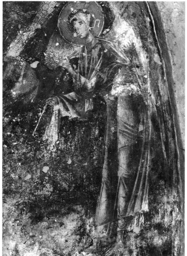
Εικ. 12. Μολάοι, Άγιος Γεώργιος. Παναγία ένθρονη βρεφοκρατούσα: άγγελος σεβίζων.

ντρο του Μυστρά 58 . Όπως είναι γνωστό και όπως φαίνεται από τα θρησκευτικά μνημεία της περιοχής, εφόσον δεν έχουν εντοπιστεί πολλά κατάλοιπα από τον 11ο έως το 13ο αιώνα 59 , ανάλογη ανάπτυξη δεν υπήρχε πριν από τη δημιουργία του Δεσποτάτου το 1348 60 . Αντίθε-