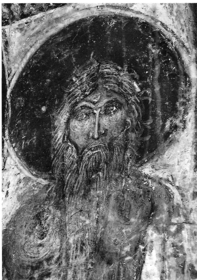
Εικ. 9. Κάτω Καστανιά, Ταξίαρχης. Ο όσιος Ονούφριος (λεπτομέρεια).