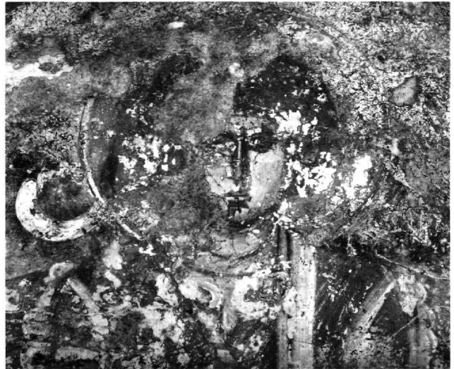
Εικ. 13. Μολάοι, Άγιος Γεώργιος. Ο επώνυμος άγιος Γεώργιος (λεπτομέρεια).

Παρά το γεγονός ότι τα θέματα που χρησιμοποιούνται είναι σε γενικές γραμμές παρόμοια, ωστόσο φαίνεται ότι οι ζωγράφοι-συνεργάτες ή μαθητές του εργαστηρίου διαθέτουν ένα ευρύτερο θεματολόγιο, από το οποίο δείχνουν να επιλέγουν τα πρότυπά τους, όπως π.χ. για την παράσταση της Παναγίας στο τεταρτοσφαιρίο της