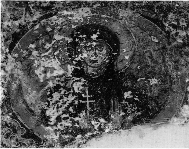
Εικ. 6. Φούτια, Άγιος Γεώργιος. Αγία σε προτομή.

προπλασμό από ώχρα, πάνω στον οποίο σχεδιάζονται τα χαρακτηριστικά του προσώπου με θερμότερους τόνους. Τα σαρκώματα πλάθονται με το ρόδινο χρώμα που τοποθετείται σε δύο επάλληλες στρώσεις και με μερική επίστρωση πράσινης σκίασης, η οποία, καθώς ενσωματώνεται, άλλοτε προκαλεί διαβαθμίσεις (Χειμάτισσα-ζωγράφος Α, Άγιος Γεώργιος στους Μολάους, Άγιος Γεώργιος στο Μαλέα, Εικ. 1-2, 13-15), άλλοτε παραμένει λίγο πιο σχηματική (Ταξιάρχης, Άγιος Ανδρέας, Εικ. 7, 9-11) και άλλοτε γίνεται έντονα σχηματική (Χειμάτισσα-ζωγράφος Β, Άγιος Γεώργιος στα Φούτια, Εικ. 4-6). Στη συνέχεια, παράλληλες λευκές ψιμιθίες απλώνονται κατά τη φορά των όγκων του προσώπου και σκοτεινόχρωμα, κόκκινα και μαύρα γραψίματα τονίζουν το σχέδιο (Εικ. 2, 6, 7, 9, 10, 12, 14). Η ίδια τεχνική διαφαίνεται και στην πτυχολογία, καθώς σκοιυρότεροι από τον αρχικό προπλασμό τόνοι δηλώνουν το βάθος των πτυχώσεων με έντονους φωτισμούς ανάμεσά τους, που αποδίδουν στρογγυλεμένες τις ακμές, άλλοτε μαλακές (Χειμάτισσα-ζωγράφος Α, Άγιος Γεώργιος στους Μολάους, Άγιος Γεώργιος στο Μαλέα, Εικ. 3, 12, 15), άλλοτε περισσότερο σχηματοποιημένες (Ταξιάρχης, Εικ. 8), (Άγιος Ανδρέας, Εικ. 9) (Χειμάτισσα-ζωγράφος Β, Εικ. 4) (Άγιος Γεώργιος στα Φούτια, Εικ. 6). Ωστόσο, παράλληλα υπάρχουν και τα φωτισμένα σπασμένα επι-