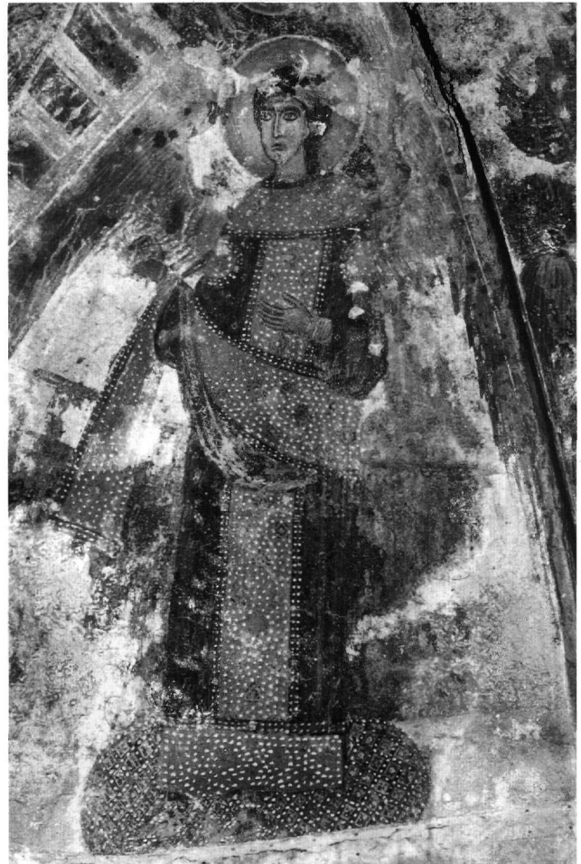
Εικ. 7. Κάτω Καστανιά, Ταξιάρχης. Παναγία ένθρονη βορειοκρατούσα: άγγελος.

Ο κύριος ζωγράφος στο καθολικό του ναού της Χειμάτισσας (ζωγράφος Α, Εικ. 1-3) είναι άλλος από αυτόν