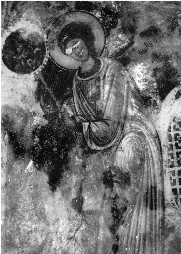
Εικ. 11. Κάτω Καστανιά, Άγιος Ανδρέας. Ο Μελισμός: άγγελος (λεπτομέρεια).