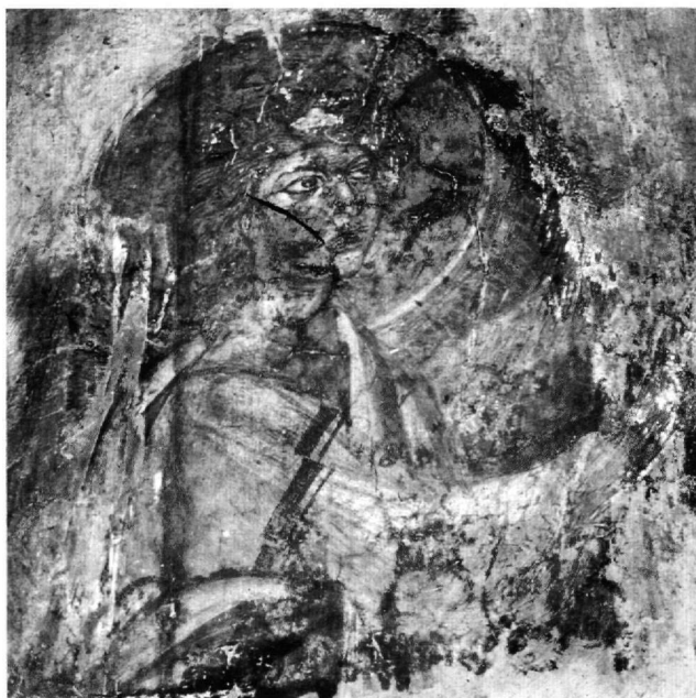
Εικ. 2. Φλόκα, μονή Χειμάτισσας. Ο Ευαγγελισμός: ο Γαβριήλ (λεπτομέρεια).