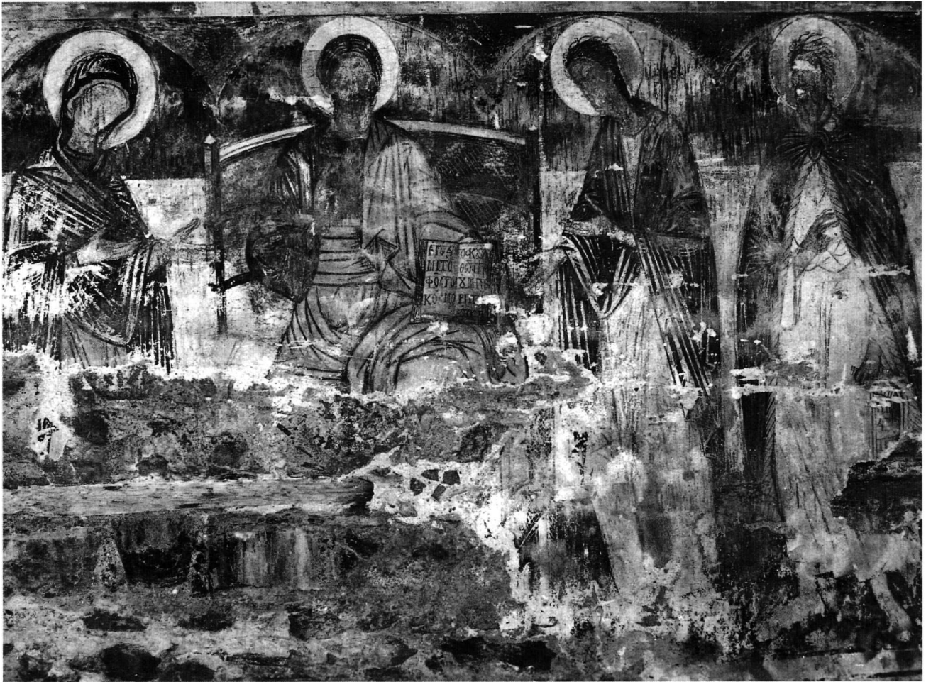
Εικ. 2. Η Δέηση.

σχετισθεί και η Μεταμόρφωση, η οποία εικονίζεται έξω από τη συνηθισμένη της θέση, ανάμεσα στη Βαΐοφόρο και το Μυστικό Δείπνο. Με τον τρόπο αυτό ο ζωγράφος αφενός τονίζει το δοξαστικό, αποκαλυπτικό περιεχόμενο της σκηνής 17 ξεφεύγοντας από την ιστορική διαδοχή των γεγονότων και αφετέρου την εξαιρεί τοποθετώντας την στο κέντρο της ενότητας των Παθών.