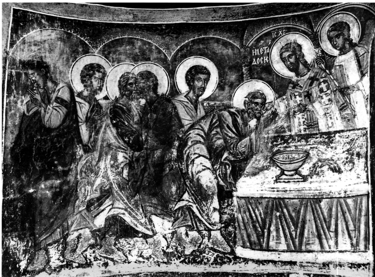
Εικ. 3. Η Κοινωνία των Αποστόλων.

πλευρά και κυρίαρχη την παράσταση της Σταύρωσης, καθώς και τα εωθινά στην ανατολική, με τη σκηνή της Καθόδου στον Άδη να εξαιρείται στο κέντρο.