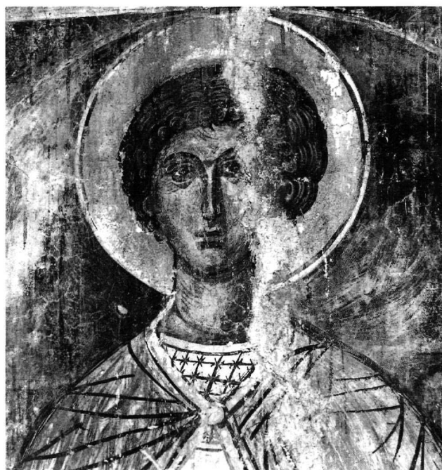
Εικ. 8. Ο άγιος Γεώργιος.

Τα εικονογραφικά στοιχεία που ήδη αναφέραμε, εάν συνυπολογισθούν με τις ιδιαιτερότητες του προγράμματος, τη θέση της Δέησης και ορισμένα τεχνοτροπικά