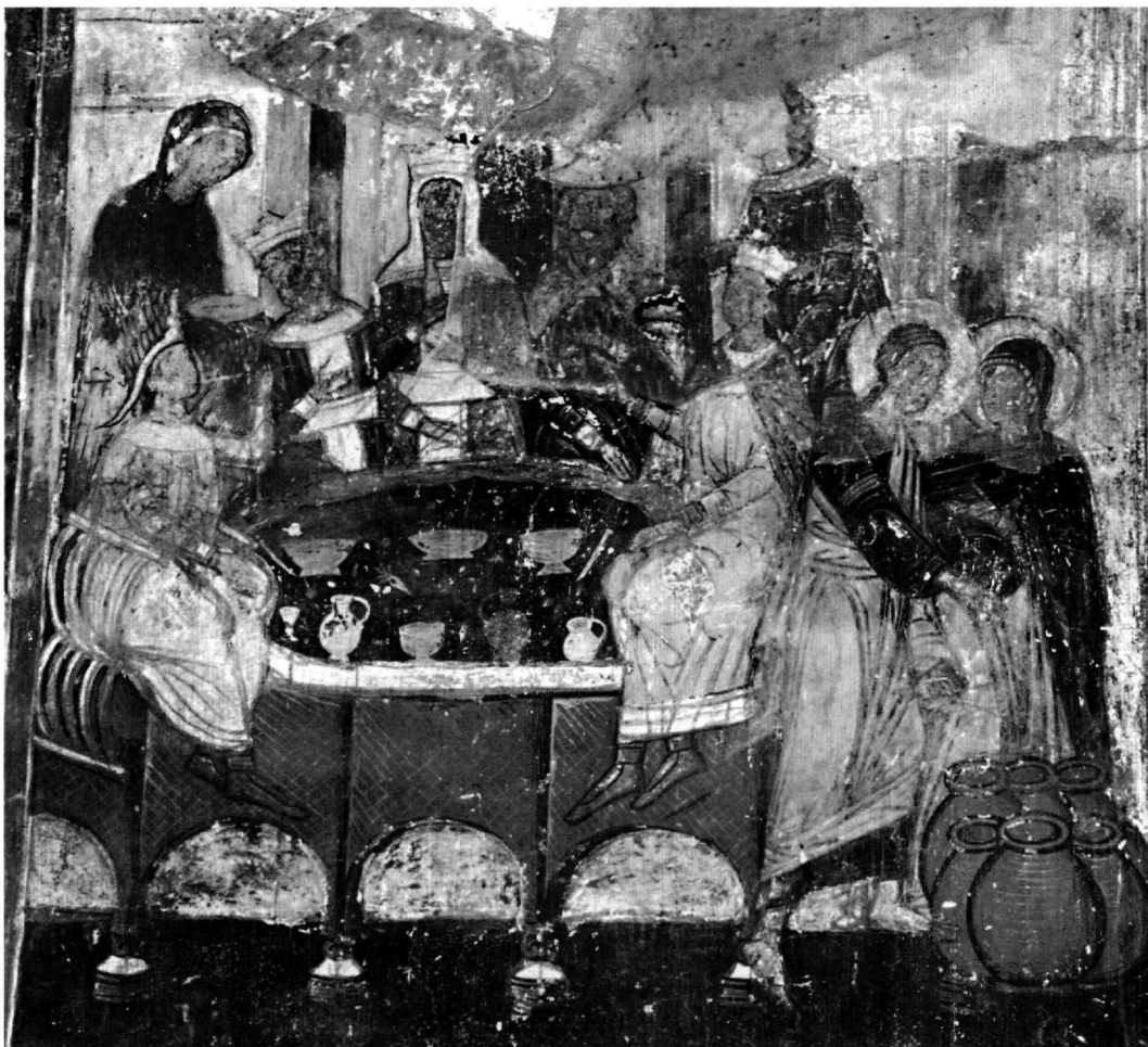
Εικ. 5. Ο εν Κανά Γάμος.

στάσεις όπου εκτυλίσσονται χωριστά τα δύο επεισόδια του δείπνου και του θαύματος, σύμφωνα με τα παλαιολόγια πρότυπα αλλά στη μεταβυζαντινή παραλλαγή τους, με απεικόνιση του Χριστού και της Θεοτόκου μόνο στο θαύμα και όχι στο δείπνο 27 . Η παραλλαγή αυτή, που θεωρήθηκε ότι πρωτοσυναντάται στη Δολίχη, σημαντικό θεσσαλικό μνημείο των αρχών του 16ου αιώνα (1512), συνηθίζεται στα μνημεία της σχολής της βορειοδυτικής