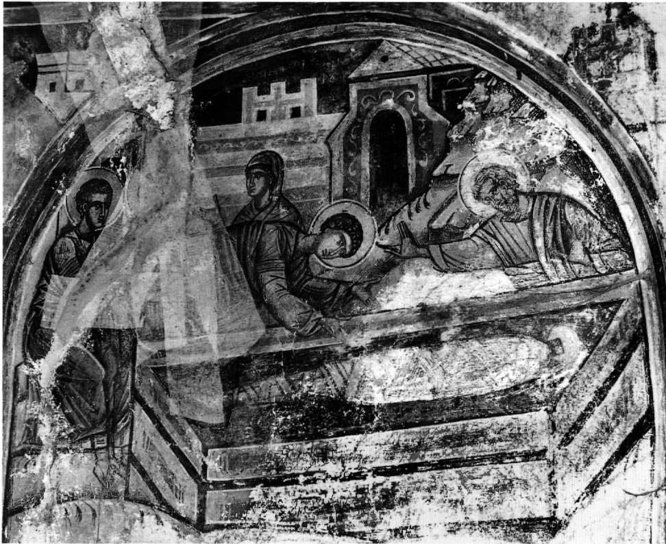
Εικ. 7. Εωθινό Ζ'.

ενώ αναφέρεται και στην Ερμηνεία του Διονυσίου του εκ Φουρνά 31 .