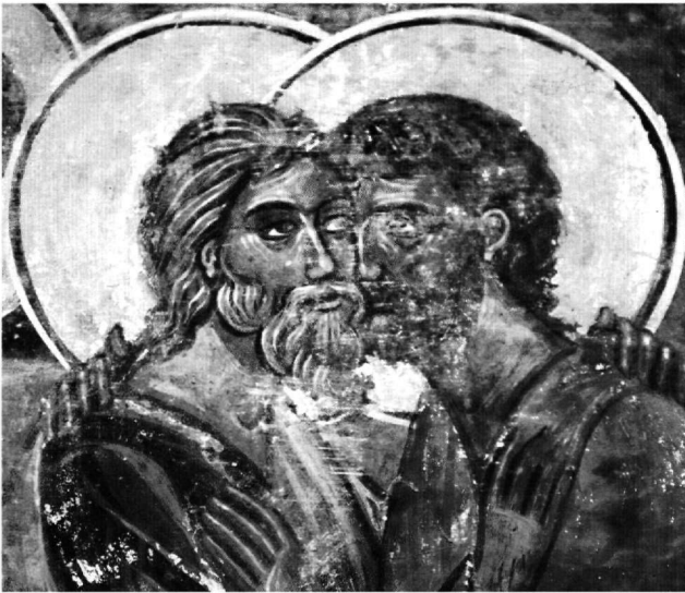
Εικ. 4. Ο Ασπασμός των αποστόλων Ανδρέα και Λουκά. Λεπτομέρεια της Εικ. 3.

ου δεν ακολουθεί την τάση αυτή και αναπτύσσει το χριστολογικό κύκλο με άνεση αποδίδοντας ορισμένες σκηνές, όπως η Γέννηση και η Υπαπαντή, σε ιδιαίτερα μεγάλο μέγεθος και με λεπτομερειακή διήγηση. Η τάση αυτή μαρτυρεί πρότυπα παλαιότερα από την εποχή του 21 και το ίδιο παρατηρείται και στην ανάγνωση των δύο ζωνών του Δωδεκαόρτου που είναι σπειροειδής, με κίνηση από την επάνω ζώνη στην κάτω και το αντίστροφο. Η τάση αυτή έχει παρατηρηθεί σε παλαιότερα μνημεία της Μακεδονίας, όπως στους Αγίους Αναργύρους της Καστοριάς και στην Παναγία Ελεούσα της Πρέσπας 22 , και είναι πιθανό να επηρέασε έως ένα σημείο το ζωγράφο μας, ο οποίος όμως δεν την ακολουθεί πιστά αλλά έλκεται παράλληλα και από το σύγχρονό του δια-