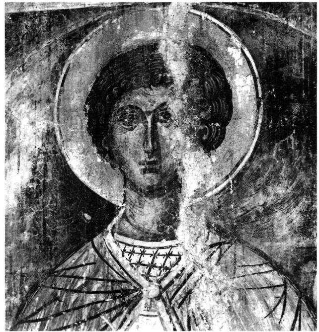
Εικ. 8. Ο άγιος Γεώργιος.

Τα εικονογραφικά στοιχεία που ήδη αναφέραμε, εάν συνυπολογισθούν με τις ιδιαιτερότητες του προγράμματος, τη θέση της Δέησης και ορισμένα τεχνοτροπικά