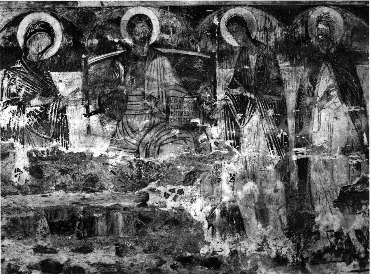
Εικ. 2. Η Δέηση.

σχετισθεί και η Μεταμόρφωση, η οποία εικονίζεται έξω από τη συνηθισμένη της θέση, ανάμεσα στη Βαΐοφόρο και το Μυστικό Δείπνο. Με τον τρόπο αυτό ο ζωγράφος αφενός τονίζει το δοξαστικό, αποκαλυπτικό περιεχόμενο της σκηνής 17 ξεφεύγοντας από την ιστορική διαδοχή των γεγονότων και αφετέρου την εξαίρει τοποθετώντας την στο κέντρο της ενότητας των Παθών.