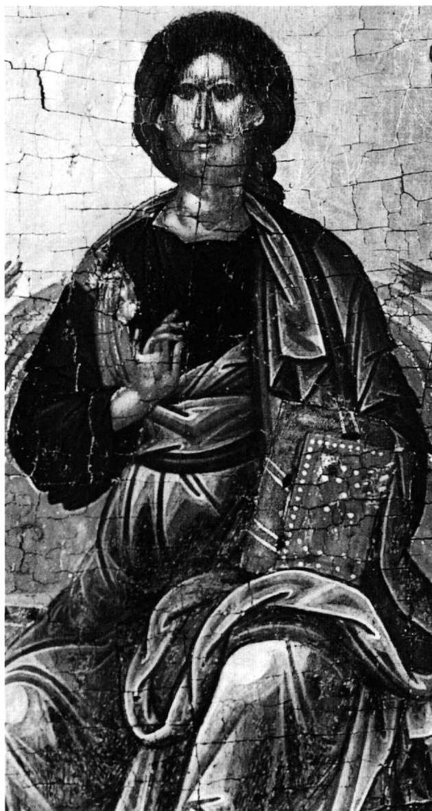
Εἰκ. 2. Ὁ Χριστός. Λεπτομέρεια τῆς Εἰκ. 1.

Ἔτσι, ἡ εἰκόνα τῆς Δεήσεως σέ εἰκονογραφικό καί καλλιτεχνικό ἐπίπεδο ἀποτελεῖ πρῶμο ἔργο τῆς κρητικῆς σχολῆς τοῦ 15ου αἰώνα, τοῦ ὁποῦ ἡ παραγωγή, ἔχου-