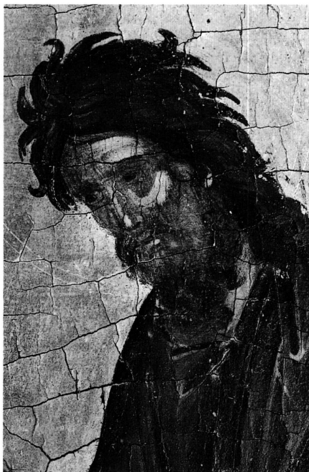
Εἰκ. 4. Ὁ Προδόρομος. Λεπτομέρεια τῆς Εἰκ. 1.

Στήν εἰκόνα τοῦ ἁγίου Ἰωάννου τοῦ Θεολόγου ὁ ἅγιος εἰκονίζεται σέ προτομή (Εἰκ. 5 καί 6), μέ ἑλαφρά στροφή πρὸς τὰ ἀριστερά καί μέ ἔκφραση αὐτοσυγκέντρωσης. Μέ τήν ἀριστερή παλάμη, πού καλύπτει ἐν μέρει τήν λιθοκόσμητη στάχωση, κρατάει μισάνοιχτο κώδικα, ἐνῶ μέ τό δεξιό κρατάει κονδυλοφόρο. Στήν ἀριστερή μασχάλη στηρίζει τό μελανοδοχεῖο μέ τήν θήκη γιά τούς κονδυλοφόρους. Στό μισάνοιχτο κώδικα ἀναγράφεται μέ κεφαλαῖα ἡ ἀρχή τοῦ Εὐαγγελίου του: ἘΝ ἈΡΧῩ, ἮΝ Ὁ / ΛΟΓΟΣ / ΚΑΙ Ὁ ΛΟΓΟΣ / ἮΝ ΠΡΟΣ / Τ(ΟΝ) Θ(ΕΟ)Ν (Ἰω. α', 1). Πίσω ἀπό τήν πλάτη τοῦ Θεολόγου, στό ὕψος τῆς κεφαλῆς του, ἀπεικονίζεται μικρογραφικά νεανική γυναικεία μορφή, ἡ προσωποποίηση τῆς θείας Σοφίας, νά τοῦ ὑπαγορεύει τό εὐαγγε-