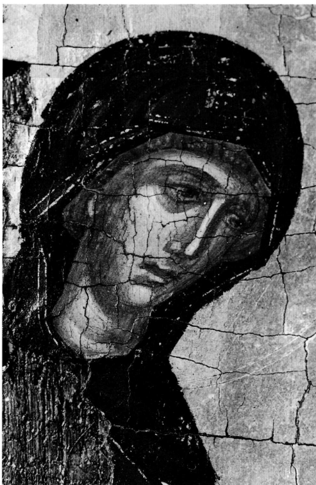
Εικ. 3. Ἡ Παναγία. Λεπτομέρεια τῆς Εἰκ. 1.

με τή γνώμη, ἐντάσσεται στόν κύκλο ἔργων τοῦ ἐργαστηρίου τοῦ Ἀγγέλου.