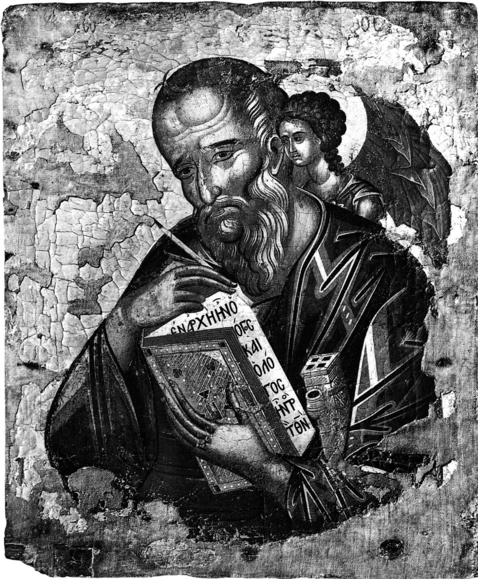
Εἰκ. 5. Μονή Βατοπαιδίου. Ὁ ἅγιος Ἰωάννης ὁ Θεολόγος.

στήν μνημειακή ζωγραφική καί στήν τέχνη τῶν εἰκονογραφημένων χειρογράφων 7 .