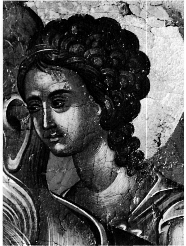
Εἰκ. 7. Ἡ προσωποποίηση τῆς θείας Σοφίας. Λεπτομέρεια τῆς Εἰκ. 5.

Συνηθέστερη, ὥστόσο, εἶναι ἡ ἀπεικόνιση τοῦ Θεολόγου χωρὶς τὴν προσωποποίηση τῆς θείας Σοφίας, μὲ τὰ ἴδια μάλιστα τυπολογικὰ καὶ προσωπογραφικὰ χαρακτηριστικὰ τοῦ εὐρωστου ἡλικιωμένου ἁγίου, μὲ ἑλαφρὰ στροφή τοῦ σώματος καὶ σκυμμένο κεφάλι, ὁ ὁποῖος κρατᾷ ἐν τῇ χερσὶ τοῦ μισοανοιγμένου κώδικα καὶ μελανοδοχεῖο πού τὸ στηρίζει ἐπὶ τῆς μασχάλης καὶ κονδυλοφό-