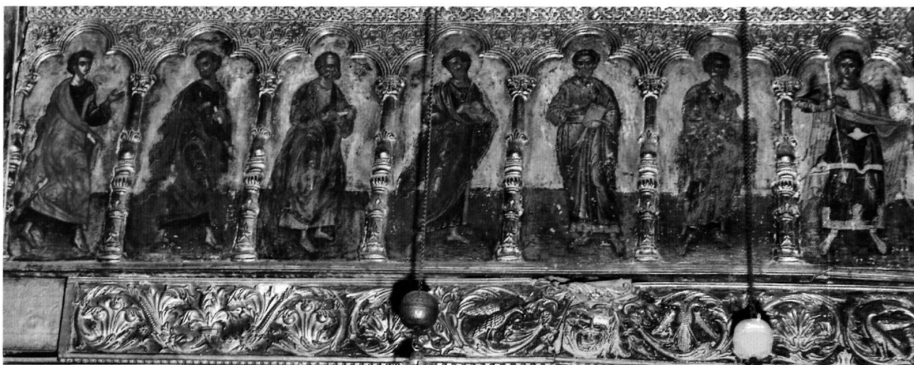
Εικ. 4. Μονή Βαρλαάμ στα Μετέωρα. Το επιστύλιο τέμπλου στο καθολικό, αριστερό τμήμα.

σχήμα και στους χαρακτήρες του προσώπου, μορφές σαν του Χριστού της Μεγάλης Βουλής Αγγέλου στη λιτή της μονής των Φιλανθρωπινών (1542) 30 και, λιγότερο, σαν του αγίου Δημητρίου στις τοιχογραφίες του Φράγγου Κατελάνου στο παρεκκλήσιο του Αγίου Νικολάου στη μονή της Μεγίστης Λαύρας (1560) 31 . Διαφέρουν ιδίως τα φώτα, που στην εικόνα της μονής Βαρλαάμ δίνουν ζωντάνια στην όψη των δύο αγίων, απλωμένα σε δέσμες με πολλές παράλληλες γραμμές, στο κάτω μέρος του προσώπου πυκνές και με ιδιότροπη διάταξη (Εικ. 2 και 3), ενώ στις αποδιδόμενες στον Φράγγο Κατελάνο εικόνες δηλώνονται με φειδώ 32 .