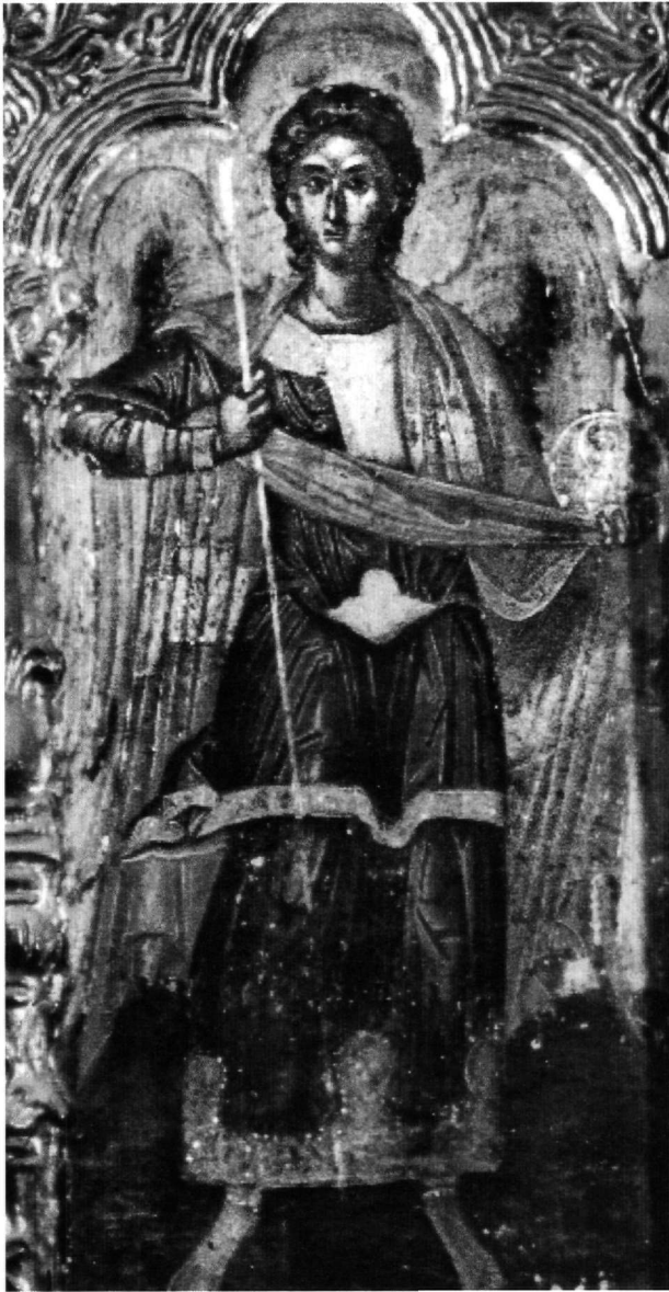
Εικ. 6. Μονή Βαρολαάμ στα Μετέωρα. Ο αρχάγγελος Μιχαήλ στο επιστύλιο του τέμπλου.