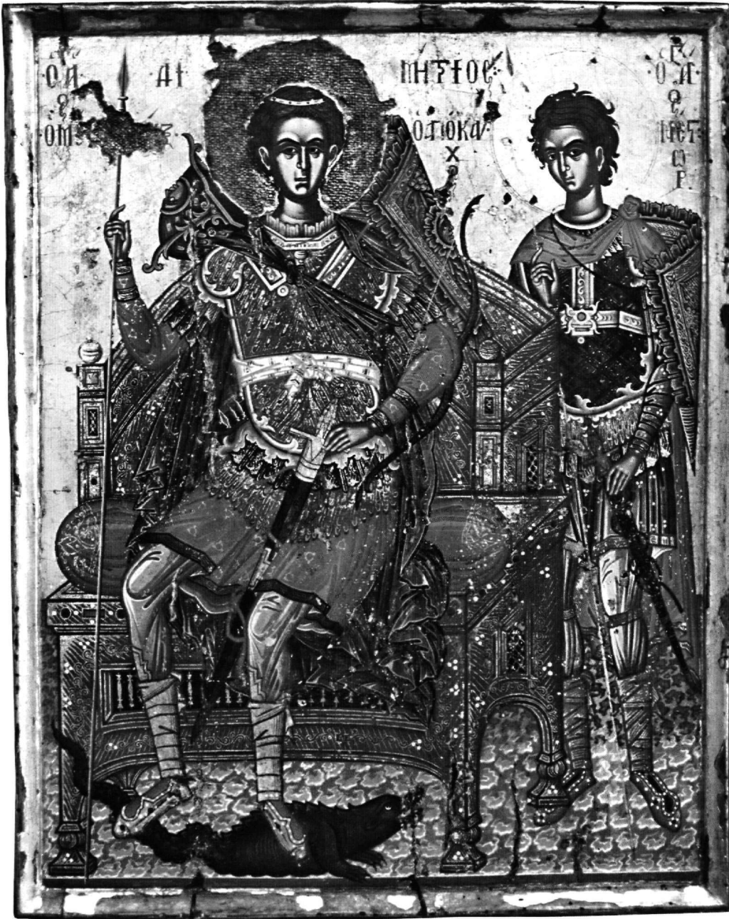
Εικ. 1. Μονή Βαρλαάμ στα Μετέωρα. Εικόνα του αγίου Δημητρίου.

Φράγγο Κονταρή έχουν επίσης αποδοθεί με ασφάλεια ένδεκα εικόνες μνηολογίου στη μονή του Μεγάλου Με-