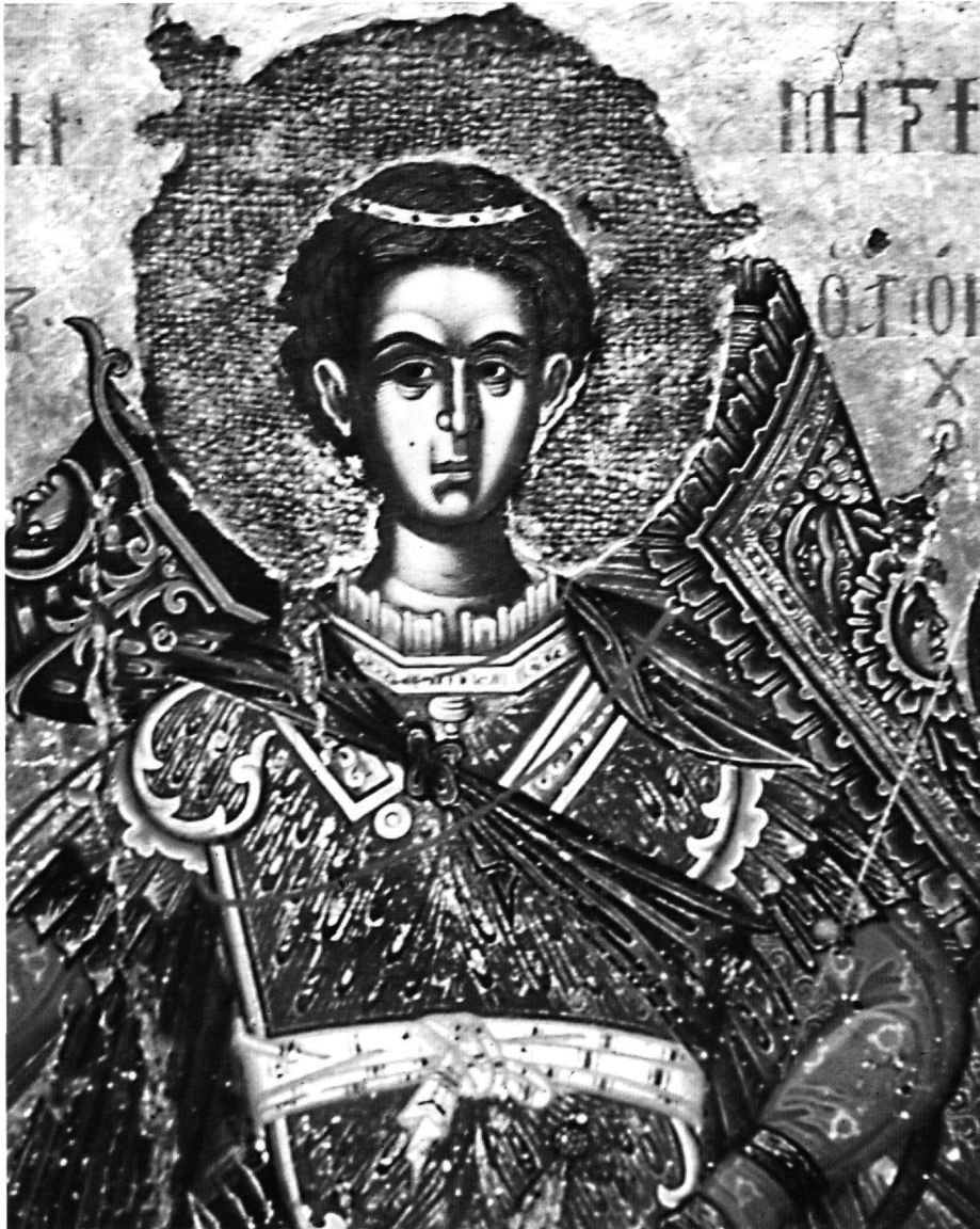
Εικ. 2. Ο άγιος Δημήτριος, λεπτομέρεια της Εικ. 1.

του προς τα αριστερά. Μοναδική είναι, τέλος, η διπλή, σε σύζευξη δύο γνωστών από το 14ο αιώνα επωνυμιών του αγίου Δημητρίου, προσφώνηση στην επιγραφή «Ο