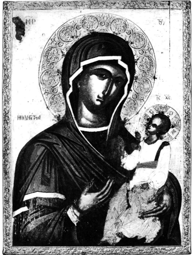
Εικ. 10. Ναός του Αγίου Αθανασίου στη Θεσσαλονίκη. Εικόνα της Παναγίας.

Ως προς τον εικονογραφικό τύπο της Οδηγήτριας του Πατριαρχείου, σημειώνεται κυρίως η ζωηρή και ιδιόρρυθμη στάση του μικρού Χριστού, με πλούσιες και