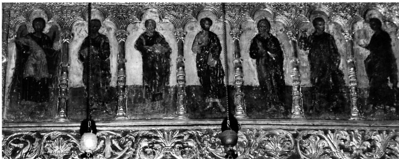
Εικ. 5. Μονή Βαρλαάμ στα Μετέωρα. Το επιστύλιο του τέμπλου στο καθολικό, δεξιό τμήμα.

Στη μονή Βαρλαάμ, το ξυλόγλυπτο και χρυσομένο τέμπλο του καθολικού των Αγίων Πάντων θα πρέπει να είναι σύγχρονο με τις τοιχογραφίες του Κατελάνου. Σηριγμένο στους ανατολικούς πεσσούς του ναού και στα πλευρικά τοιχώματα, φαίνεται ότι τοποθετήθηκε με τις εικόνες του όταν τελείωσε η τοιχογράφηση, γιατί καλύπτει κατά μικρό μέρος το γραπτό κοσμητικό σχέδιο στο μέτωπο των χορών. Ο χρόνος της τοποθέτησης δεν πρέπει να απείχε πολύ από το πέρας των τοιχογραφιών. Εκτός από τους λειτουργικούς λόγους που επέβαλλαν την ύπαρξη τότε του τέμπλου, συντρέχει σε τούτο η ομοιογένεια ύφους που παρατηρείται στα λεπτοτεγμένα στοιχεία του και, από το άλλο μέρος, στις γύψινες διακοσμήσεις των τοίχων, σε φωτοστεφάνους αγίων από το ίδιο υλικό και όμοια στο πλαίσιο των τοιχογραφημένων εικόνων του Χριστού και της Παναγίας στους τέσσερις πεσσούς· αντίστοιχα δε των εικόνων του σε σχέση με τις τοιχογραφίες. Με το ίδιο πνεύμα διακόσμησης, οι δεσποτικές του Χριστού και της Παναγίας φέρουν παρόμοια με των τοιχογραφιών ανάγλυφα σχέδια στο πλαίσιο. Με αυτά τα δεδομένα, οι σημαντικές και ενιαίες, όπως δείχνουν, κατασκευής εικόνες του τέμπλου μπορούν να χρονολογηθούν γύρω στο 1548 και ίσως πριν από την κοίμηση του Νεκταρίου Αψαρά (1550).