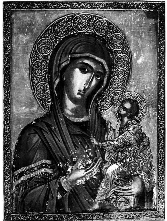
Εικ. 8. Οικουμενικό Πατριαρχείο Κωνσταντινουπόλεως. Εικόνα της Παναγίας.

Οι διαστάσεις της εικόνας του Πατριαρχείου συμπίπτουν με της δεσποτικής του Χριστού στο τέμπλο της Υπαπαντής (Εικ. 9) και του αγίου Δημητρίου, από τον ίδιο ναό, στο Βυζαντινό Μουσείο Αθηνών, με ασήμαντες διαφορές 55 . Προφανής και η τεχνοτροπική συνταύτιση της Παναγίας με τον Χριστό της Υπαπαντής, επίσης στη ζωηρή έκφραση και το ήθος των παριστανόμενων προσώπων, επιτρέπει την αβίαστη σύνδεση της εικόνας του Πατριαρχείου με το σύνολο των δύο δεσποτικών της Υπαπαντής, από όπου μάλιστα λείπει η εικόνα της Παναγίας. Με αυτά τα στοιχεία φαίνεται μάλλον απίθανο ότι η Παναγία του Πατριαρχείου ανήκε σε άλλη «ζυγιά» εικόνων του τέμπλου. Οι τρεις εικόνες πιθανώς κοσμούσαν αρχικά το τέμπλο ναού ή παρεκκλησίου του Αγίου Δημητρίου, όπως δείχνει η εικόνα του Βυζαντινού Μουσείου, που θα ήταν του επώνυμου αγίου