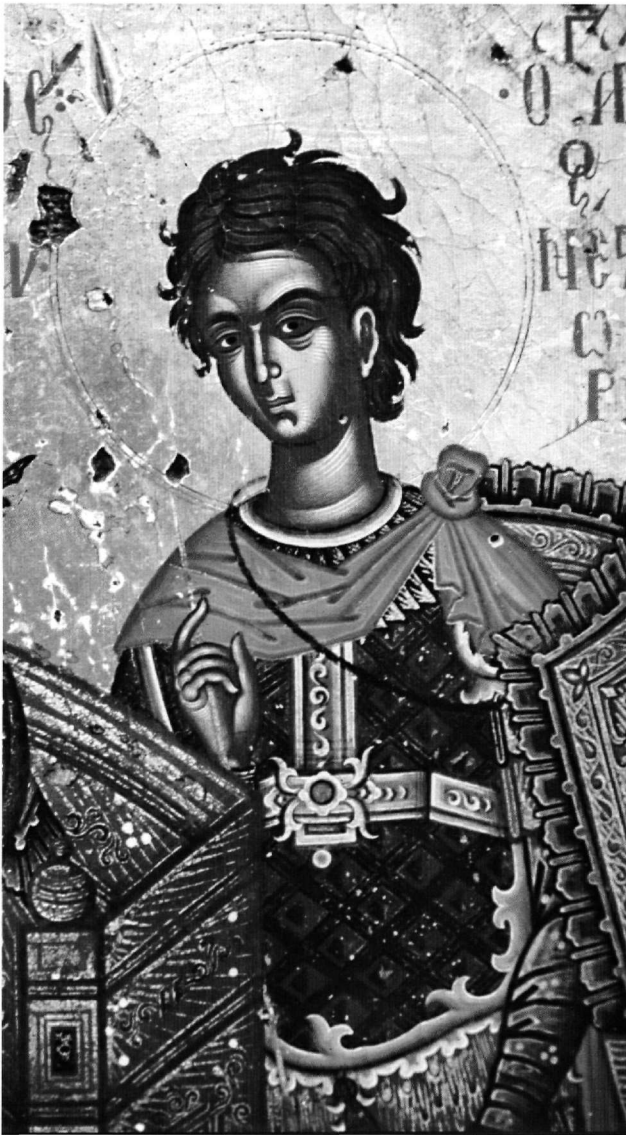
Εικ. 3. Ο άγιος Νέστορας, λεπτομέρεια της Εικ. 1.

με κυμάτια πλάισιο, το έδαφος σε απόχρωση του κυκλάμινου και λευκό, με μικρά ακανόνιστα σχέδια που δείχνουν μαρμάρινο δάπεδο. Σε σημεία όπου η ζωγρα-