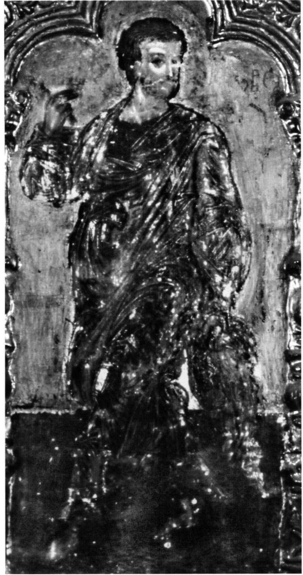
Εικ. 7. Μονή Βαρολαάμ στα Μετέωρα. Ο απόστολος Ιάκωβος στο επιστύλιο του τέμπλου.

από προηγούμενα γραπτά και ανάγλυφα σχέδια στη διακόσμηση της μονής Βαρολαάμ. Μάλιστα, το έκτυπο σχέδιο ελικοειδούς βλαστού, από ίδια των εικόνων μήτρα, υπάρχει εκεί στο πλαίσιο των τοιχογραφημένων ει-