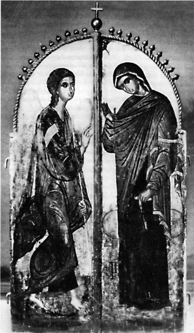
Εικ. 5. Θεσσαλονίκη, ναός Υπαπαντής. Βημόθυρο.