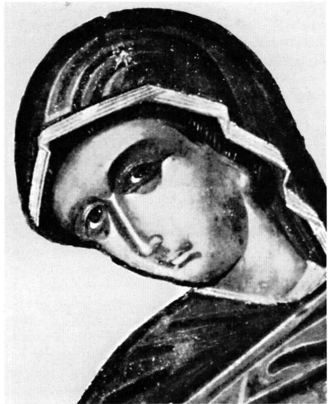
Εικ. 6. Η Παναγία του Ευαγγελισμού. Λεπτομέρεια της Εικ. 5.

Ωστόσο, τα διακριτικά γνωρίσματα της τεχνικής και της τεχνοτροπίας του έργου του Φράγγου Κατελάνου, όπως τα αναγνωρίζουμε από τα ασφαλή έργα του, παρουσιάζουν μερικές διαφοροποιήσεις. Πιο συγκεκριμένα, οι μορφές του Κατελάνου διακρίνονται από την