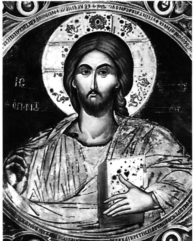
Εικ. 3. Μονή Φιλανθρωπινών, καμάρα κυριώς ναού. Ο Χριστός Παντοκράτορας.

Ο Χριστός της Υπαπαντής και ο άγιος Δημήτριος του Βυζαντινού Μουσείου Αθηνών 53 παρουσιάζουν πληθώρα κοινών εξωτερικών γνωρισμάτων και τεχνοτροπικών χαρακτηριστικών, που δηλώνουν τη μεταξύ τους σχέση και ενισχύουν την υπόθεση να αποτελούσαν τις δεσποτικές εικόνες που κοσμούσαν το αρχικό τέμπλο του ναού της Θεσσαλονίκης. Ανάμεσα στα κοινά εξωτερικά γνωρίσματα, στα οποία οφείλουμε να σταθούμε περισσότερο, συγκαταλέγονται, μεταξύ άλλων, το πανομοιότυπο φυτικό κόσμημα στους ανάγλυφους φωτοστεφάνους και στο πλαίσιο, καθώς και οι παρόμοιες διαστάσεις των έργων που αρμόζουν σε δεσποτικές εικόνες ενός τέμπλου 54 . Οι ανάγλυφοι φωτοστεφάνοι, που λειτουργούν κατά μίμηση των πολύτιμων μεταλλικών της βυζαντινής περιόδου, αποτελούν χαρακτηριστική τάση στα τοιχογραφικά σύνολα της σχολής που αναφέρεται στην έρευνα ως σχολή της βορειοδυτικής Ελλάδος, ηπειρωτική σχολή ή και σχολή των Θηβών. Πανομοιότυπα στεφάνια που κοσμούν τις κεραιές του