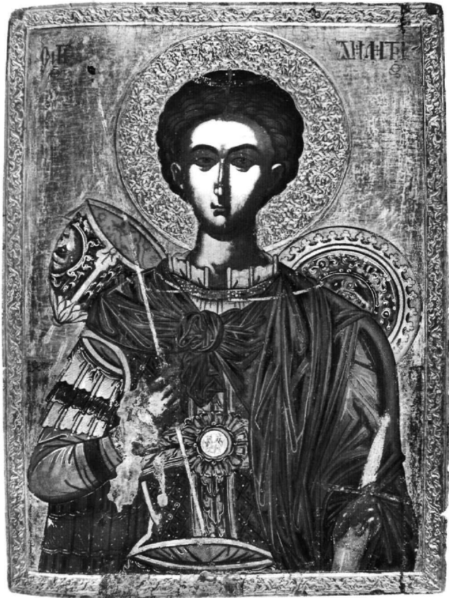
Εικ. 2. Αθήνα, Βυζαντινό και Χριστιανικό Μουσείο. Ο άγιος Δημήτριος.

Μεταξύ των αρχαιότερων και πλέον γνωστών στην έρευνα παραδειγμάτων, όπου συνδυάζεται ο παραπάνω τύπος της ευλογίας με την αναδίπλωση του ματιού πάνω από τον ανοιχτό κώδικα και την ελαφρά στροφή του σώματος του Χριστού στα δεξιά και με τα μαλλιά να βρίσκονται στην αριστερή πλέον πλευρά, είναι η δεσποτική εικόνα στο ναό του Αγίου Γεωργίου των Ελλήνων στη Βενετία (αρχές 14ου αι.) 19 . Τα συγκεκριμένα χαρακτηριστικά, τα οποία κατά τα παλαιολόγια ακόμα χρόνια βρίσκονται στις μορφές του Χριστού στην Gračanica (1318/21) 20 , στο Maligrad της Μεγάλης Πρέσπας (1369) 21 , σε επιστύλιο τέμπλου με θέμα τη Μεγάλη Δέηση (γ' τέταρτο 14ου αι.) 22 και σε εικόνα (τέλη 14ου αι.) από τη Βέροια 23 , στην κεντρική εικόνα Μεγάλης Δέησης της μονής Βισότσκι στην Πινακοθήκη Τρετιακόφ (1387-1395) 24 , καθώς και σε εικόνα της μονής Χελανδαρίου (14ος-15ος αι.) 25 , αποτελούν κοινό τόπο αρκετών μεταβυζαντινών εικόνων 26 . Μεταξύ αυτών συγκαταλέγεται