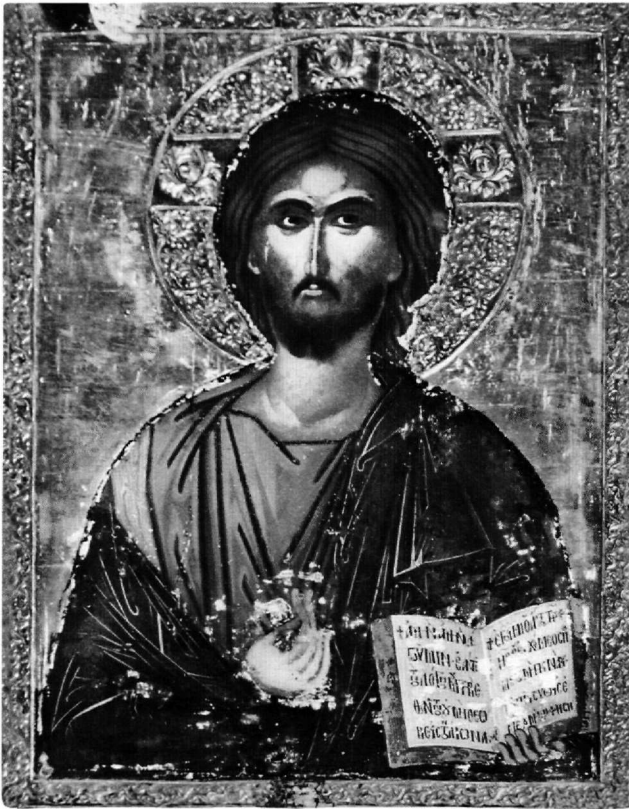
Εικ. 1. Θεσσαλονίκη, ναός Υπαπαντής. Χριστός Παντοκράτορας.

ώμους της μορφής. Οι κεραίες του σταυρού του φωτοστεφάνου κοσμούνται με την επιγραφή Ο ΩΝ , τα γράμ-