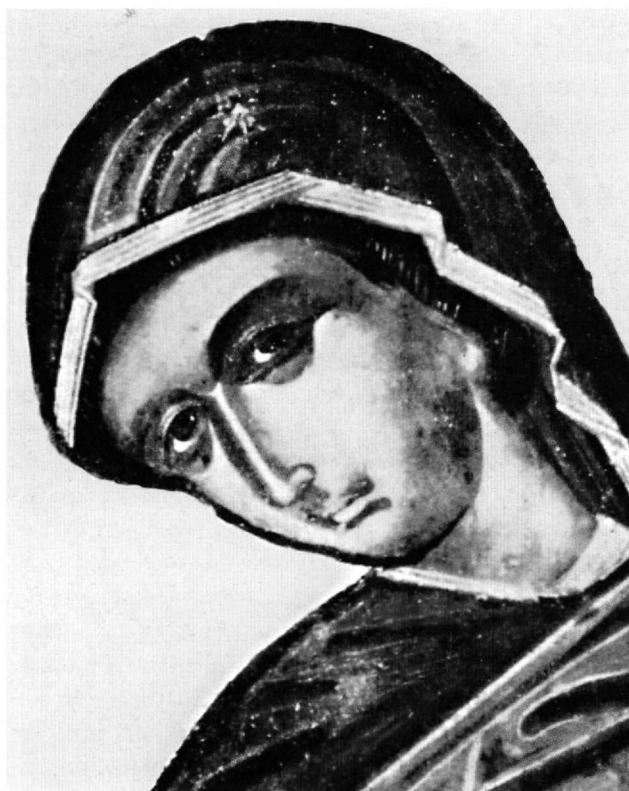
Εικ. 6. Η Παναγία του Ευαγγελισμού. Λεπτομέρεια της Εικ. 5.

Ωστόσο, τα διακριτικά γνωρίσματα της τεχνικής και της τεχνοτροπίας του έργου του Φράγγου Κατελάνου, όπως τα αναγνωρίζουμε από τα ασφαλή έργα του, παρουσιάζουν μερικές διαφοροποιήσεις. Πιο συγκεκριμένα, οι μορφές του Κατελάνου διακρίνονται από την