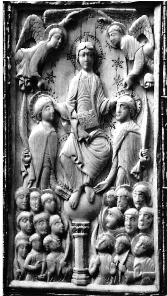
Εικ. 4. Ελεφαντοστένιο πλακίδιο των «Θηβαίων μαρτύρων». Περί το 1000. Κολωνία, Schnütgen-Museum, αριθ. B 98.

Το τελείως ακατανόητο για μία Maiestas Domini εικονογραφικό μοτίβο του κίονα που στηρίζει την σφαίρα του σύμπαντος, βρίσκει ένα και μοναδικό, αλλά ιδιαίτερα ουσιαστικό παράλληλο στην Ιστορία της Τέχνης, σε έναν πολύ σημαίνοντα τόπο: στην Curia της Ρώμης, δηλαδή στο οικοδόμημα που προοριζόταν για την ρωμαϊκή σύγκλητο. Απέναντι από την είσοδό της υψωνόταν, δεσπόζοντας στο κέντρο της αίθουσας επάνω σε πόδιο, ένας όχι πολύ ψηλός κίων, που έφερε επάνω από το κιονόκρανο μία σφαίρα. Επάνω της αιωρείτο σχεδόν στον αέρα μία χρυσή Νίκη, που άγγιζε μόνο με τις άκρες των δακτύλων της την σφαίρα. Στα χέρια της