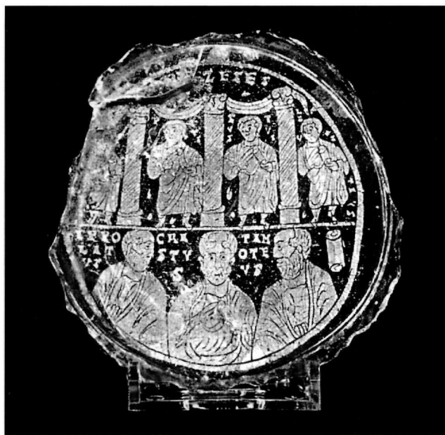
Εικ. 8. Ο Χριστός και έξι μάρτυρες. Πυθμένας αμφύαλου χρυσογραφημένου αγγείου. 4ος αι. Βρετανικό Μουσείο, αριθ. BM MLA 1863.7-27.9.

Μία χρυσογραφημένη φιάλη με απεικονίσεις θαυμάτων από την Παλαιά Διαθήκη, επίσης του 4ου αιώνα από την Κολωνία, σήμερα στο Βρετανικό Μουσείο, ήταν αφιερωμένη, όπως μαρτυρεί η αποσπασματικά σωζόμενη επιγραφή που φέρει, στην αγία Ούρσουλα, πράγμα που σημαίνει ότι προοριζόταν ως δώρο για την εορτή της 75 . Το γεγονός αυτό μας οδηγεί στην υπόθεση ότι και το αγγείο του Μουσείου Κανελλοπούλου θα πρέπει να κατασκευάστηκε για την ίδια χρήση, δηλαδή ως δώρο για την εορτή του αγίου Γερεώνας, όπως αυτό της αγίας Ούρσουλας. Ένα ακόμη μετάλλιο αμφύαλου χρυσογραφημένου αγγείου στο Βρετανικό Μουσείο (Εικ. 8) 76 ,