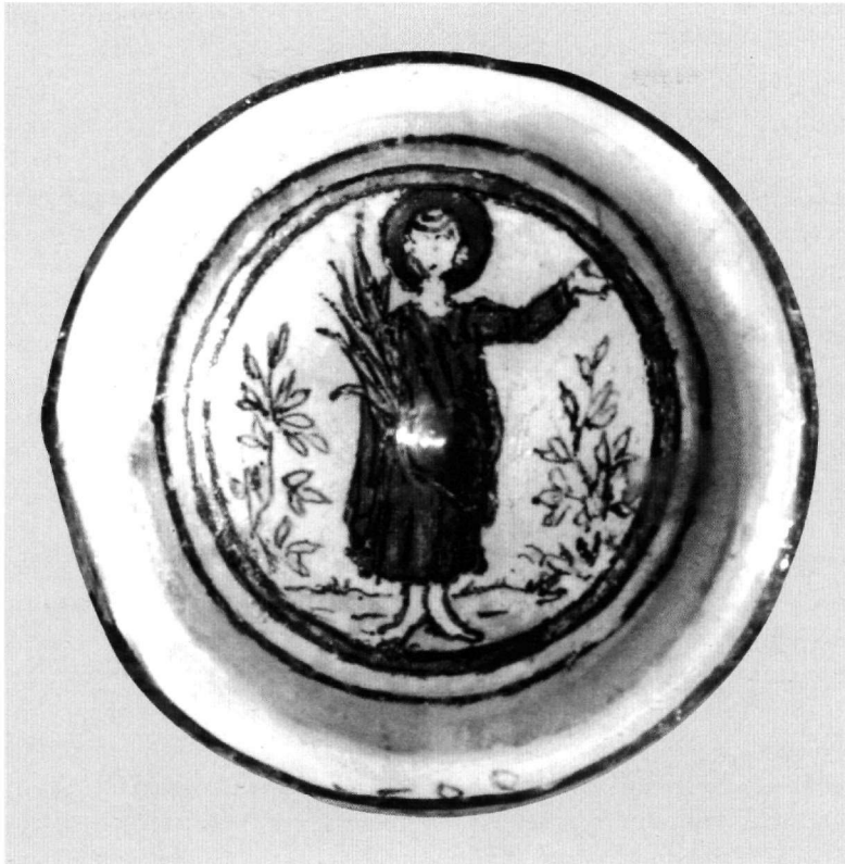
Εικ. 1. Πυθμένας αμφύαλον χρυσογραφημένον και ζωγραφισμένον αγγείον. Μουσείο Κανελλοπούλου, αριθ. Δ 2271.

προσωπούμενη από 120 περίπου παραδείγματα, συχνά αριστουργηματικής τέχνης 20 . Τα πορτραίτα, που στην απόδοση των λεπτομερειών τους γινόταν χρήση της ζωγραφικής 21 , απεικόνιζαν είτε νεονύμφους στεφόμενους από τον Έρωτα –και αργότερα από τον Χριστό– είτε τον παραγγελιοδότη 22 , συνοδευόμενα από επιγραφές με τα ονόματά τους και με ευχές για ευτυχία και μακροζωία. Συνηθέστατη ήταν η ευχή ΖΗΧΑΙC, που απειδίετο στην λατινική ως ΖΕSΕS 23 . Παράλληλα, απει-