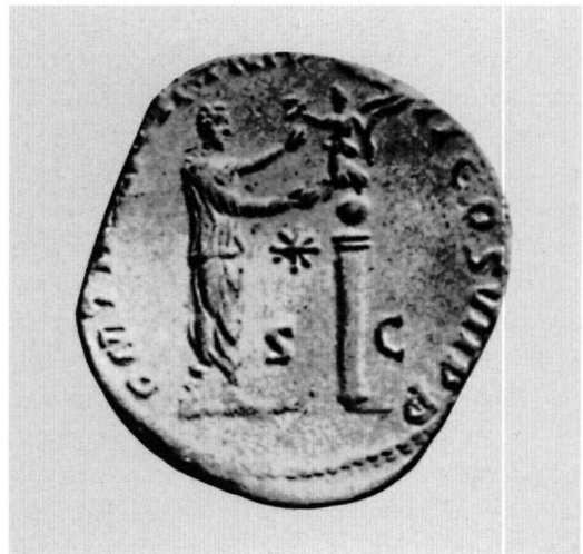
Εικ. 6. Σηστέριος του Κομμόδου (β' όψη) με απεικόνιση του αγάλματος της Victoria Romana επάνω στον κίονα της Curia.

Ως σύμβολο νίκης ο κλάδος φοίνικος απαντά εξάλλου συχνότατα, συνήθως παράλληλα με το στεφάνι, και σε πολυάριθμες κατηγορίες μνημείων της ύστερης αρχαι-