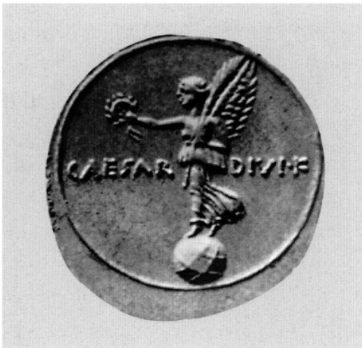
Εικ. 5. Δηνάριο του Οκταβιανού (β' όψη) με απεικόνιση της Victoria Romana επάνω στην σφαιράρα.

στου μέσω της νίκης του, απέβη στην συνέχεια το έμβλημα της απόλυτης εξουσίας του ρωμαίου αυτοκράτορα. Απεικονίσεις της, με συχνά παραλλαγμένο τον πρωταρχικό τύπο, σώζονται κυρίως σε νομίσματα (Εικ. 5 και 6) 57 ή σε έργα της σφραγιδογλυφίας και της τορευτικής, όπως για παράδειγμα στον σκύφο του Boscoreale 58 . Το αργότερο δε από την εποχή των Σεβήρων και εξής εμφανίζεται στα νομίσματα ο ίδιος ο ρωμαίος αυτοκράτωρ να κρατεί την Victoria Romana στο χέρι, ως έμβλημα της εξουσίας του, πράγμα που επεβίωσε στην μεν Δύση μέχρι και τις αρχές του βου αιώνα με τον Θεοδώριχο, στην δε Ανατολή μέχρι και την εποχή του Ηρακλείου 59 .