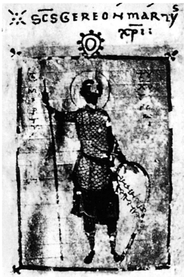
Εικ. 9. Μικρογραφία του αγίου Γερεώνος σε βυζαντινό ψαλτήριο εκ Κωνσταντινουπόλεως. Περί το 1077. Βιέννη, Εθνική Βιβλιοθήκη, Cod. theol. gr. 336.

Τον παλαιοχριστιανικό εικονογραφικό τύπο του μάρ-