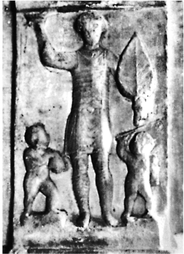
Εικ. 7. Ο Πορφύριος θριαμβευτής. Ανάγλυφο από την βάση του Πορφυρίου. Περί το 500. Αρχαιολογικό Μουσείο Κωνσταντινουπόλεως, αριθ. 2995.

Ο πυρήνας του μαρτυρίου του αγίου ανάγεται στην Passio Agaunensium martyrum , που συνέγραψε ο Ευχάριος περί τα 450. Εδώ γίνεται αναφορά στους λεγεωνάριους