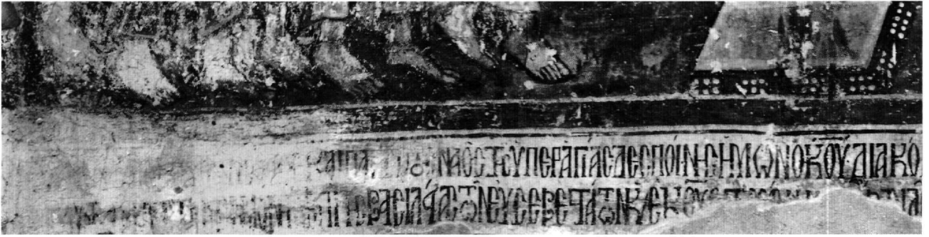
Εικ. 3-4. Η κτητορική επιγραφή σε τμηματική φωτογράφιση.

τεύγεος 18 και η σύζυγός του Ειρήνη Μεντόνη 19 . Το επώνυμο Παντεύγεος συναντάται το 16ο αιώνα σε κώδικες χωριών της Χίου και το 1739 μαρτυρείται η παρουσία ενός Ιωάννη Παντεύγεου στην Κωνσταντινούπολη 20 . Ο Νικόλαος ήταν αναγνώστης και νομικός, ανήκε δηλαδή στην κατώτερη ιεραρχική βαθμίδα του επαρχιακού κλήρου 21 . Στα καθήκοντά του περιλαμβάνονταν η ανάγνωση των Επιστολών κατά τη θεία Λειτουργία και η σύναψη συμβολαιογραφικών πράξεων (αγοραπωλησίες ακινήτων, προικοσύμφωνα), καθώς επίσης και ο έλεγχος για θέματα που αφορούσαν το γάμο (τυχόν αιμομειξίες, κατάλληλο της ηλικίας κτλ.) 22 . Είναι γνωστό από επιγραφές πως και άλλοι αναγνώστες και νομικοί υπήρξαν κτήτορες εκκλησιών στους παλαιολόγειους χρόνους, όπως ο «Ἡλίας ἀναγνώστης καὶ νομικός» που δαπάνησε για την ανέγερση του ναού των Αγίων Αναργύρων στην Κηπούλα της Μάνης το 1265 οκτώ χρυσά νομίσματα έναντι των πολύ λιγότερων που διέθεσαν οι υπόλοιποι κτήτορες 23 . Το επώνυμο Μεντόνη (ή Μεντώνη, όπως είναι αργότερα γνωστό), που έφερε η σύζυγος του Νικολάου, είναι γνωστό στη Χίο από το 14ο αιώνα και συναντάται σε νοταριακό έγγραφο του 15ου αιώνα ως επώνυμο έλλη-