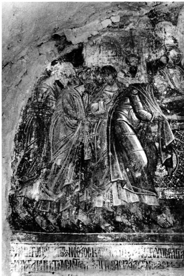
Εικ. 5. Τμήμα της κτητορικής επιγραφής το 1958.

Terminus ante quem για την ίδρυση της Παναγίας «Αγρελωπούσαινας» είναι το έτος 1317, το έτος δηλαδή που πέθανε η Ειρήνη η Μομφερρατική, η οποία μνημονεύεται στην κτητορική επιγραφή. Σε σωζόμενα δείγματα κτητορικών επιγραφών, που εμπίπτουν στο διάστημα της συμβασιλείας του Ανδρονίκου Β' με τον Μιχαήλ Θ', εμφανίζονται δύο διαφορετικοί τύποι: στον ένα μνημονεύονται παρατακτικά τα ονόματα των βασιλέων και των συμβασιλέων και στον άλλο αναφέρονται επιμεριστικά τα αξιώματα του Ανδρονίκου Β' ως μεγάλου βασιλέως και του Μιχαήλ ως απλού βασιλέως. Στον πρώτο τύπο ανήκει η επιγραφή στη μονή των Αγίων Σαράντα στη Λακωνία, που χρονολογείται στο 1304/5. Η διατύπωση είναι απλή και παρατίθενται με τη σειρά τα ονόματα του αυτοκρατορικού ζεύγους πρώτα και των εστεμμένων συμβασιλέων τους στη συνέχεια: δηλώνεται ότι η ίδρυση έγινε ἐπὶ τῆς βασιλεί(ας) τῶν εὐσεβεστάτων βασιλέ(ων) Ανδρονίκου κ(αὶ) Εἰρήνης κ(αὶ)