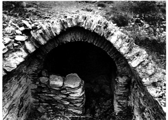
Εικ. 4. Άνδρος, Επάνω Κάστρο. Η δυτική κινστέρα (Α) πριν από τον καθαρισμό.

Ένα κτίριο που σώζεται με πολλές μετασκευές και ενδεχομένως προσκτίσματα και χρησιμοποιείται ακόμη