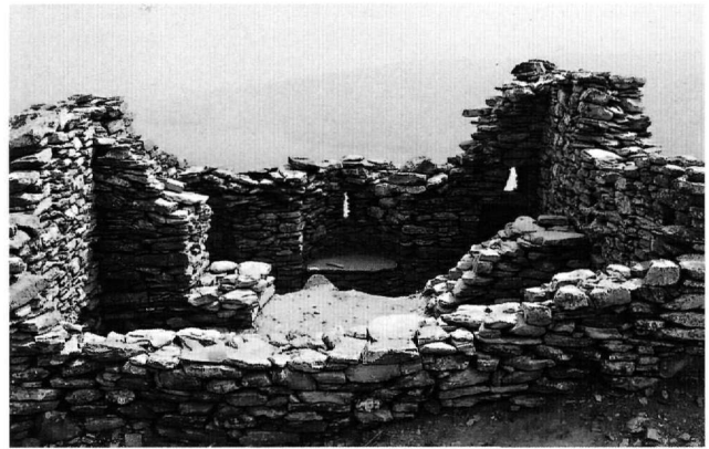
Εικ. 5. Άνδρος, Επάνω Κάστρο. Ο ναΐσκος μετά τον καθαρισμό.

Το Σεπτέμβριο του 2004 έγινε επιφανειακός καθαρισμός