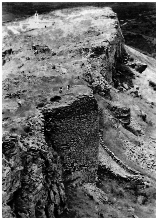
Εικ. 1. Άνδρος, Επάνω Κάστρο. Το τείχος του περιβόλου, νότια πλευρά.

Ο οχυρωματικός περίβολος του Κάστρου δεν σώζεται ικανοποιητικά σε όλο του το μήκος, είναι όμως απόλυτα διαπιστωμένη η χάραξή του στο φρύδι του βράχου. Οι βράχοι υψώνονται κατακόρυφα και ζώνουν τις πλευρές του εδαφικού εξάρματος που αποτελεί πράγματι ένα πανίσχυρο φυσικό οχυρό. Το τείχος εδράζεται κατά το πλείστον πάνω στο φυσικό βράχο που απολήγει στη στάθμη του πλατώματος. Σε αρκετά σημεία όμως είναι κτισμένο από τα ριζά του βράχου, πλέκεται με το βράχο και γεμίζει τα κενά μεταξύ των βράχων (Εικ. 1)· οι βράχοι δηλαδή συμπεριλαμβάνονται στον οχυρωματικό περίβολο, όπως ακριβώς συμβαίνει και στο Κάτω Κάστρο, στο οποίο σε κτίσματα και τείχη ο βράχος χρησιμοποιείται και συμπληρώνεται 14 . Κατά μήκος του τείχους σώζονται δύο μεγάλοι πύργοι, από τους οποίους ο ένας, στο βόρειο περιτείχιμα, έχει σχήμα κυκλικό (Εικ. 2). Τα καλύτερα σωζόμενα τμήματα του οχυρωματικού περιβόλου παρατηρούνται κατά μήκος της βόρειας πλευράς, όπου σώζεται σε αρκετά καλή κατάσταση ο ογκώδης κυκλικός οχυρωματικός πύργος. Στη διαδρομή του τείχους του Επάνω Κάστρου παρατηρούνται τμήματα στα οποία έχει χρησιμοποιηθεί ισχυρό συνδετικό κονίαμα, ενώ σε άλλα η τοιχοποιία είναι ευτελής και το συνδετικό κονίαμα μεταξύ των σχιστολίθων είναι απλώς λάσπη. Η πύλη του Κάστρου δεν έχει επισημανθεί. Εικάζεται ότι μπορεί να βρίσκεται στο βόρειο τείχος του περιβόλου, κοντά στον ογκώδη κυκλικό πύργο.