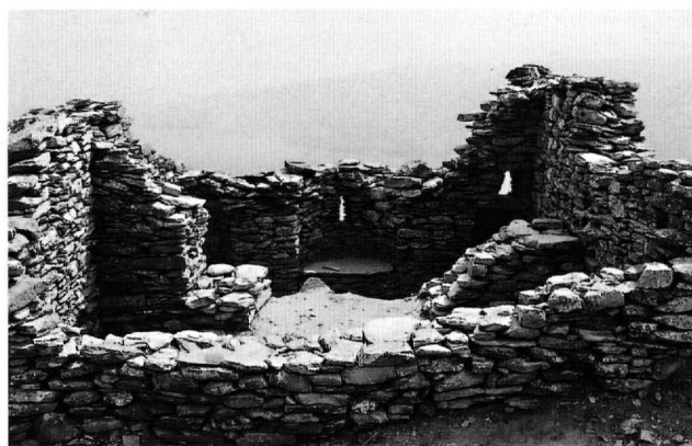
Εικ. 5. Άνδρος, Επάνω Κάστρο. Ο ναΐσκος μετά τον καθαρισμό.

Το Σεπτέμβριο του 2004 έγινε επιφανειακός καθαρισμός