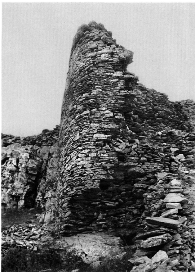
Εικ. 2. Άνδρος, Επάνω Κάστρο. Περιβόλος, Β τείχος, ο κυκλικός οχυρωματικός πύργος.

όπως είναι ευνόητο, ακόμη. Επισημαίνουμε τρία είδη τοιχοποιίας στο Επάνω Κάστρο: