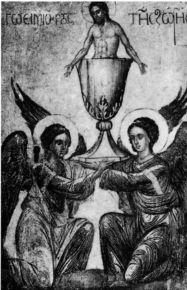
Εικ. 2. (Μιχαήλ Δαμασκηνού): Άγγελοι κρατούν άγιο ποτήριο με τον Χριστό. Θύρα αρτοφοριίου. Βενετία, ναός Αγίου Γεωργίου των Ελλήνων, ιερό βήμα.

ράρχης της κεντρικής αφίδας, και μέχρι το 1582/83, τελευταίο καιρό της παραμονής του Κρητικού ζωγράφου στη Βενετία 19 .