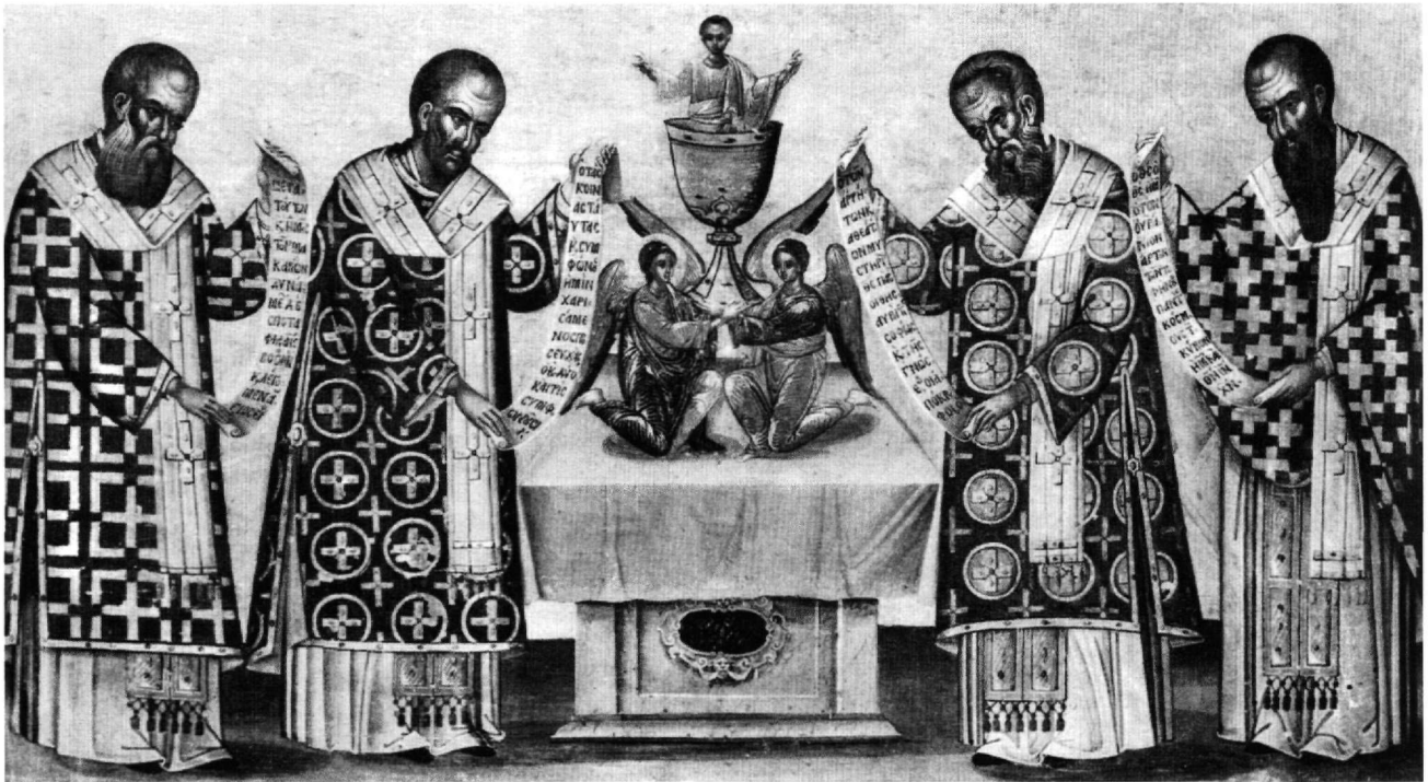
Εικ. 1. Συλλειτουργούντες ιεράρχες με παράσταση του ευχαριστιακού Χριστού. Φορητή εικόνα. Τέχνη Εμμ. Τζάνε, 17ος αι. Βενετία, Συλλογή Μουσείου Ελληνικού Ινστιτούτου.

σκηνού πιθανώς αντανακλάται σε σωζόμενη φορητή εικόνα 14 (Εικ. 1). Την εργασία του Santi δηλώνει επιγραφή 15 , που διασφαλίζει την πατρότητα της αρχικής ζωγραφικής του Δαμασκηνού και αφήνει να διαφανεί ο σεβασμός του επιδιορθωτή. Εκτός από τους τέσσερις αγίους που αναφέρονται στα παραπάνω έγγραφα, στην αψίδα του ιερού είναι ζωγραφισμένοι και οι άγιοι Νικόλαος (αριστερά) και Σπυρίδων (δεξιά) 16 . Προφανώς οι δύο αυτές μορφές αποτελούν μεταγενέστερη προσθήκη στο σύνολο των ιεραρχών του ημικυλίνδρου της αψίδας και ασφαλώς εκτελέστηκαν κατά τον χρόνο της επαναζωγράφησης από τον Sebastiano Santi.