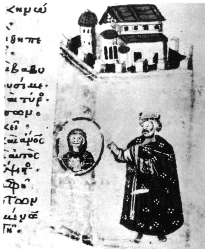
Fig. 7. Le Pantocrator n° 61, fol. 121r, Ps LXXXVI, 5 (87, 5) (d'après Dufrennes).

série d'études 57 , on assiste à un intérêt particulier, commun à l'art byzantin et à l'art occidental, pour expliquer la réalisation du mystère de l'Incarnation. Dans les manuscrits, on commence à observer la transformation des éléments narratifs en symboles. Les métaphores vives dans l'esprit byzantin, bien qu'exprimées avec discrétion dans la scène évangélique, affleurent sans hésitation, lorsqu'elles illustrent des psaumes, qui en fait prédisent l'Incarnation. Par exemple, dans le Psautier du Mont Athos du IXe siècle (Fig. 7), le Pantocrator n° 61, fol. 121r, Ps. LXXXVI, 5 (87, 5), un mé-