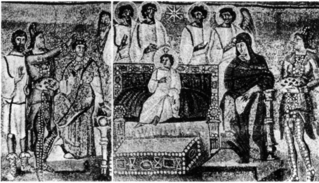
Fig. 2. L'Adoration des Mages, arc triomphal de l'église de Sainte-Marie-Majeure, Rome (d'après Lasarev).

suite, l'arcade renvoie au Christ, pierre angulaire (= la colonne) 28 de l'édifice de l'Église. En troisième lieu, la poule et son poussin symbolisent le foyer. Enfin, de l'autre côté, le coq éloigné de l'abri de l'Église, se fait attraper par les pièges du démon.