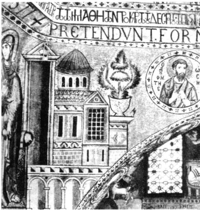
Fig. 9. L'Annonciation, détail, Chappelle Palatine, Palerme (d'après Demus).

que cette dernière est significative, ici, car elle représente un des premiers cas dans l'art monumental post-iconoclaste, où, dans la forme d'une préfiguration biblique, la colombe accentue la manière dont se réalise l'Incarnation. Enfin, un dernier facteur qui montre éventuellement que l'édifice dans l'Annonciation a une valeur symbolique, constitue le vis-à-vis de l'Annonciation avec la Présentation au temple. Cette dernière fête qui aussi bien pour les orthodoxes que pour les latins est une fête mariale 68 , met en relief l'importance de la Mère de Dieu dans la fondation de l'Église et