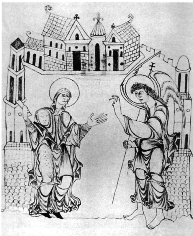
Fig. 6. L'Annonciation, cod. Guelf 16.1. aug. 2°, fol. 8r (d'après Jantzen).

série d'études 57 , on assiste à un intérêt particulier, commun à l'art byzantin et à l'art occidental, pour expliquer la réalisation du mystère de l'Incarnation. Dans les manuscrits, on commence à observer la transformation des éléments narratifs en symboles. Les métaphores vives dans l'esprit byzantin, bien qu'exprimées avec discrétion dans la scène évangélique, affleurent sans hésitation, lorsqu'elles illustrent des psaumes, qui en fait prédisent l'Incarnation. Par exemple, dans le Psautier du Mont Athos du IXe siècle (Fig. 7), le Pantocrator n° 61, fol. 121r, Ps. LXXXVI, 5 (87, 5), un mé-