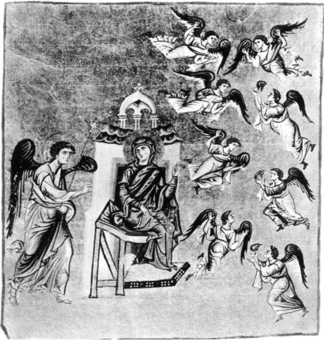
Fig. 8. Le Fiat , Homélies du moine Jacques de Kokkinobaphos, vat. gr. 1162, fol. 127v (d'après Fournée).

ciation. En effet, dans la composition pré-citée, représentée dans plusieurs scènes successives, pour la plupart semblables, la Vierge est assise devant un édifice à deux étages avec une coupole centrale. Mais, dans la scène du Fiat la coupole disparaît et un ciboire la remplace (Fig. 8). Marie est véritablement devenue le sanctuaire, l'autel du Dieu vi-