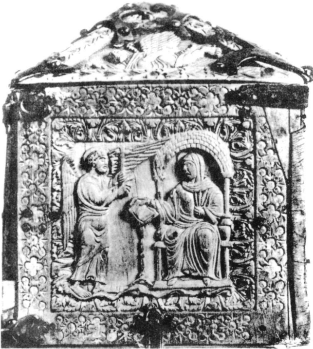
Fig. 11. L'Annonciation, coffret, Herzogliches Museum, Braunschweig (d'après Goldschmidt).