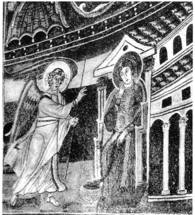
Fig. 4. L'Annonciation, église de Sainte-Euphrasienne, Parenzo (d'après Schiller).

Dans l'art paléochrétien, l'édifice qui figure dans la scène de l'Annonciation est plutôt un indice narratif justifié aussi bien par le Protévangile de Jacques (ch. IX) 39 que par l'évangile de Luc (I, 26) 40 . Quelquefois, il rappelle la topographie des lieux saints, lorsqu'il a la forme d'une basilique, l'église sans doute qui avait été errigée sur l'emplacement de la maison de Marie à Nazareth, selon la relation d'Éthérie 41 . C'est le cas à Parenzo 42 (540), où Marie est assise à l'entrée d'une basilique majestueuse à trois nefs (Fig. 4). Dans l'Annonciation du codex de Rabula 43 (586), dont on connaît les références iconographiques aux loca sancta 44 , on voit également Marie debout sur un podium , devant une basilique. Ces images mentionnées ci-dessus, font allusion à la fondation de l'Église à travers la vie terrestre du Christ. Il en est de même, lorsque le plan architectural devient plus complexe et qu'apparaît un deuxième édifice relié ou non au premier, qui rappelle sans doute la demeure de saint Joseph ou la deuxième basilique de Nazareth construite sur son emplacement et attestée aussi bien par Éthérie (380) que par Arculfe (670) 45 .