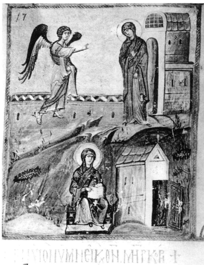
Fig. 12. L'Annonciation, le Magnificat. Psautier, Dumbarton Oaks, MS 3, fol. 80v (d'après Weitzmann).

meuse icône sinaïte 106 du thème Par-dessus-les prophètes (XII e siècle), la Mère et le Fils tiennent le même rouleau fermé, ce qui renvoie aux symbolismes de l'image évoquée précédemment.