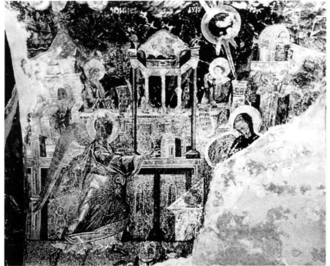
Fig. 3. L'Annonciation, église de la Vierge Pantanassa, Mistra (d'après Mouriki).

Par opposition, une image plus répandue est la tour qui