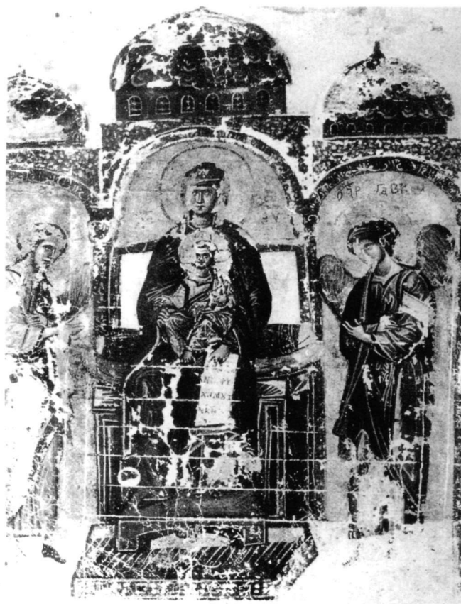
Fig. 13. Psautier, cod. 269, fol. 4r, Bibliothèque Publique, Saint Petersburg (d'après Weitzmann).

l'Occident représente dans la scène même de l'Annonciation, régulièrement, à partir du IX e siècle. Bien que dans la littérature théologique byzantine, la métaphore du « livre animé » soit accordée à la Vierge, dans l'iconographie, cet élément n'a pas connu le succès qui lui était réservé en Occident, que dans des cas isolés. C'est une preuve que, comme l'avait suggestivement observé Gabriel Millet, bien que ces représentations allégoriques soient issues de ses fonds, Byzance pour des raisons dogmatiques bien connues évitait cette sorte de représentations dans les scènes évangéliques.