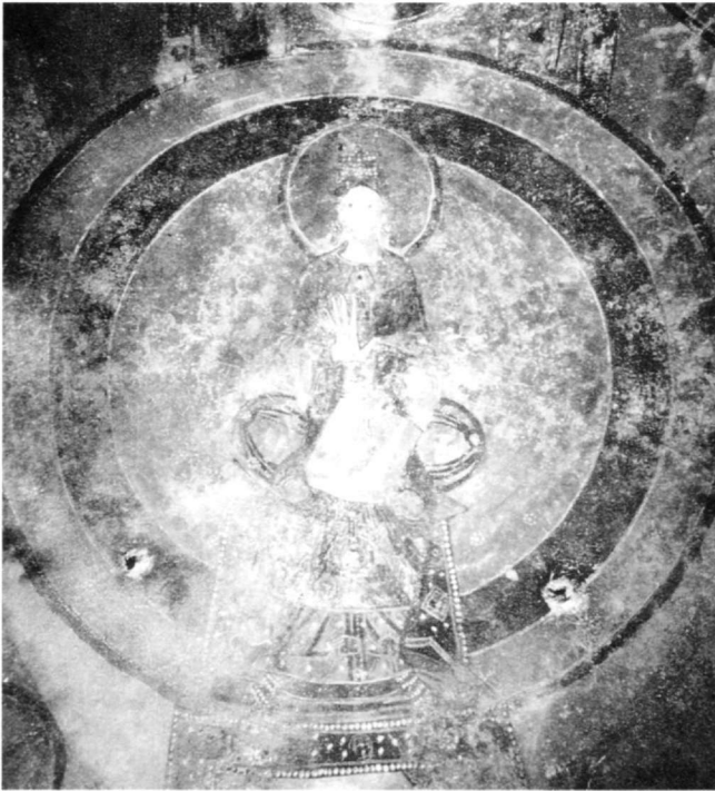
Fig. 10. La Vierge dans la voûte, crypte de San Vincenzo, Volturmo (d'après Belting).

assise sur un trône gemmé, sans dossier. Le piedestal est orné de gemmes, également. Marie est en tenue royale. Sa couronne et ses grandes boucles d'oreilles sont décorées de perles. Deux éléments retiennent plus particulièrement l'attention dans cette image de la Vierge en majesté : le livre ouvert sur son giron et le geste du refus. Marie porte la main droite devant la poitrine, la paume ouverte vers le spectateur et de la main gauche elle désigne dans le livre le passage du Magnificat (Luc 1, 47-56). Il s'agit de la prière qui exalte