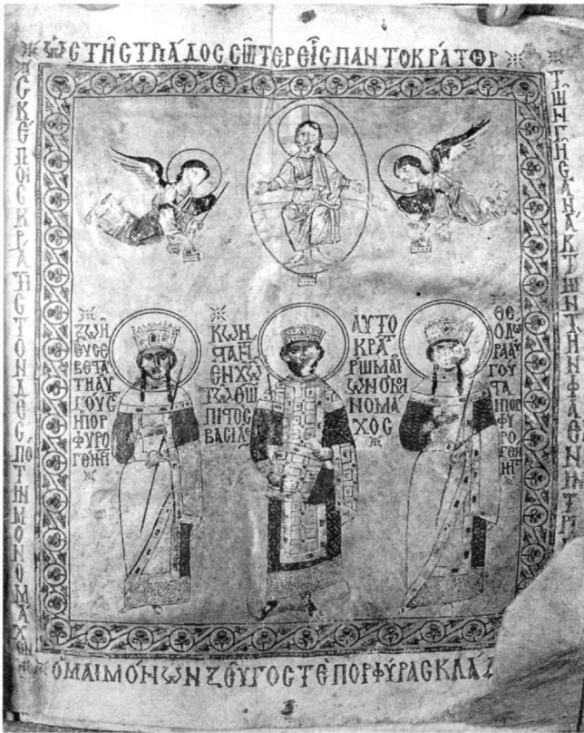
Εικ. 1. Χφ. Σινᾶ 364, φ. 3. Κωνσταντίνος Μονομάχος, Ζωή και Θεοδώρα.

Ο Ch. Walter 7 , μελετώντας την «φαιρινή τριάδα των ανάκτων» της μικρογραφίας του χφ. του Σινᾶ, παρατηρεί την αναλογία μεταξύ των οὐράνιας και της γήινης Τριάδας και σημειώνει ότι αξίζει να εξεταστεί ιδιαίτερα τό θέμα. Αναφέρει τή στέψη τριῶν συμβασιλέων, τοῦ Κωνσταντίνου, του Τιβερίου καί τοῦ Ἡρακλείου. Τότε οἱ κάτοικοι τῆς Χρυσουπόλεως ἐπευφημοῦσαν τό γεγονός: «Εἰς Τριάδα πιστεύομεν τοὺς τρεῖς στέψωμεν».