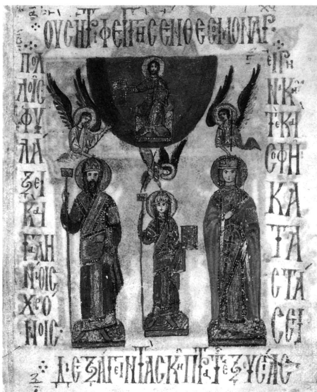
Εἰκ. 2. Χφ. Barberini 372, φ. 5. Τριφεγγής ἔνθεος μοναρχία.

σταντίνος δοκιμάζει τόν γιό του μέ ἐρωτήσεις «πολιτικής ὑποθέσεως». Ὁ Μιχαήλ ἀπαντᾷ μέ τρόπο πού ἐλήφθη ὡς «οἰωνός... ψυχῆς» θά διέπρεπε ὅταν θά γινόταν βασιλεύς καί ἀμέσως τήν βασιλείον πανήγυριν ἐκτελεῖ 14 . Ὁ Μιχαήλ ἦταν ἔτοιμος νά διαδεχθεῖ τόν πατέρα του.